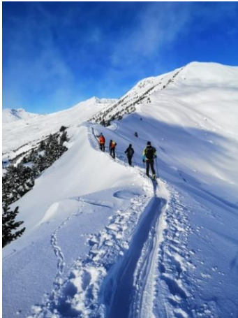
Sicher durch den Winter