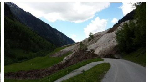
Bild links: Lawine Richtung Zillergrund Bild oben: Richtung Brandberg