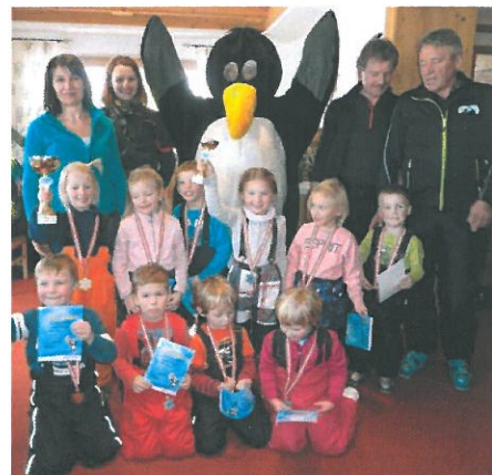
Die Brandberger Kindergartenkinder mit ihren Eltern und die Kindergärtnerin.