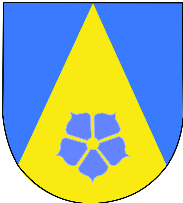
(Zeichnung: WR 2023)