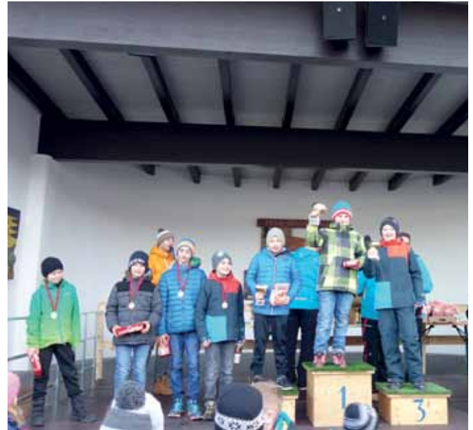
Siegerehrung Knaben U12