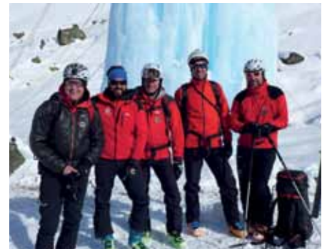
Die 5 fertig ausgebildeten Alpin Medics

Am 12.02.2017 schlossen 5 Mitglieder der Bergrettung Axams die 3-teilige Ausbildung zum Alpin Medic mit dem Winterkurs ab. Gratulation an alle 5 Teilnehmer.