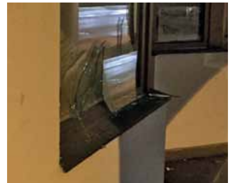
Die beschädigte Scheibe beim Axamer Pfarrsaal

von Axams ereignete. Aufmerksame Passanten haben anschließend die Einsatzkräfte dazu alarmiert. Vor Ort konnte jedoch mehr oder weniger Entwarnung gegeben werden. Bei dem lauten Knall handelte es sich um einen verbotenen Feuerwerkskörper der Klasse F4. Diese sind genehmigungspflichtig und dürfen dazu nur an Personen mit entsprechendem Ausweis ausgehändigt werden, da sich der Umgang mit solchen Böllern deutlich mit dem von frei erhältlichen unterscheidet. Durch die Detonation wurde auch eine Glasscheibe beschädigt. In diesem Fall hat die Polizei Axams ihre Ermittlungen aufgenommen. Ein Einsatz sowie eine nachstehende Gefahr bestand jedoch nicht.