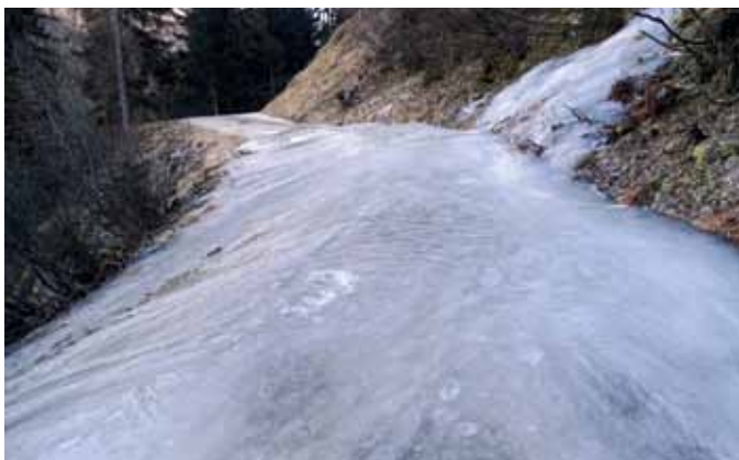
Hier ist auch für Fußgänger kein Weiterkommen mehr möglich.

weise auch für Fußgänger gesperrt werden. Eine Entspannung der Situation trat erst nach den leichten Schneefällen Ende der ersten Jänner-Woche ein.