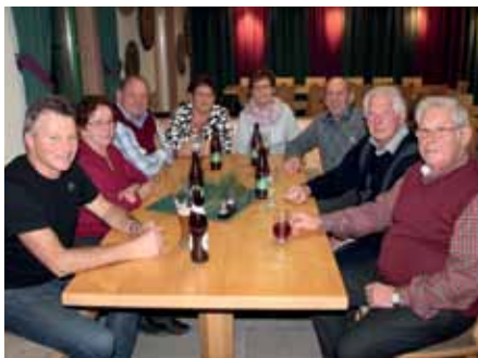
Rückblick und Vorschau: Vorsilvester-Feier am Schießstand

Mit der mittlerweile traditionellen Vorsilvester-Feier am 30.12.2016 verabschiedete die Georg-Bucher-Schützenkompanie ein abwechslungsreiches vergangenes Jahr. Im Rahmen dieser Veranstaltung wurden auch die Schießleistungen der Schützen gewürdigt – die Preisverteilung des Kompaniewertungsschießens stand auf dem Programm. Die Vorsilvester-Feier wird aber auch dazu genutzt, um gemeinsam in das neue