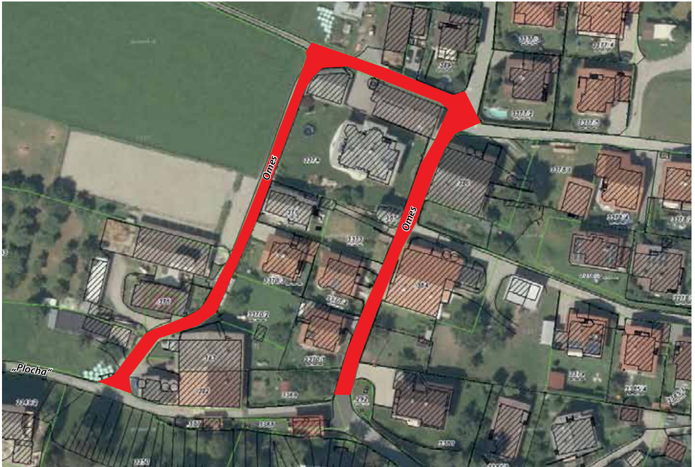
Übersichtsplan – rote Fläche = Baustellenbereich

errichtet werden. Gemeinsam mit der Neuverlegung im Hauptweg soll im Auftrag der Gemeinde Kematen eine neue Transportleitung verlegt werden. Beide Straßen werden auch ausgekoffert.