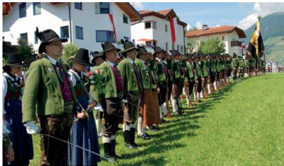
Freude über die Sonderausrückungen 2017: Zuerst Gauderfest, dann EHRENKOMPANIE am 10. Juni in Grinzens!

@ Vereinshomepage: www.schuetzen-axams.at