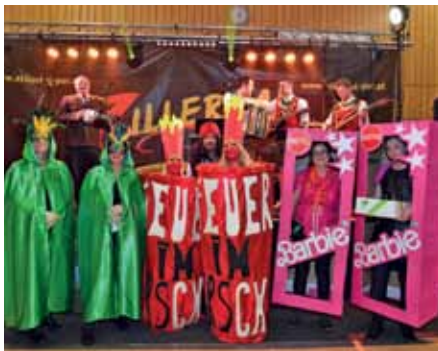
Die drei Erstplatzierten in der Paarwertung