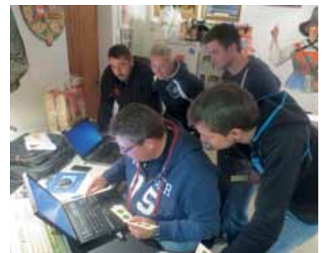
Spannung beim Auswerten ist für die Vereine auch heuer garantiert!