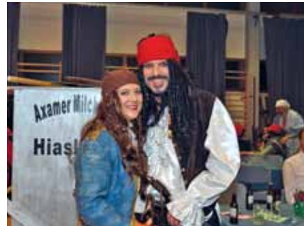
Auch unser Bürgermeister und seine Gattin warfen sich für den Ball in Schale.

derer, Sponsoren und natürlich an die zahlreichen Besucher für diese gelungene Veranstaltung!