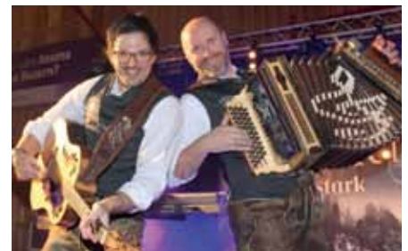
Stimmung pur mit den Zillertaler Mander