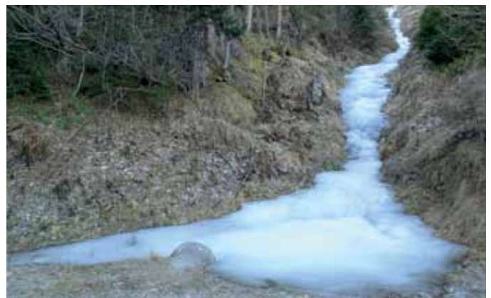
Durch die tiefen Temperaturen vereisten viele Bäche.