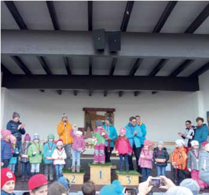
Siegerehrung Mädchen Bambini 2