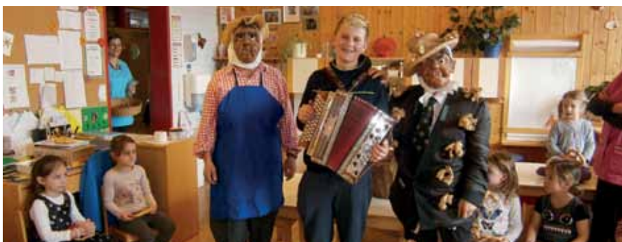
Fotos: Kindergarten Sylvester-Jordan-Straße