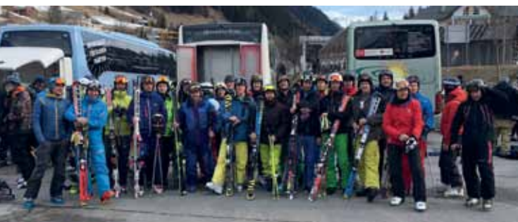
37 Dornacher folgten der Einladung zum Schiausflug nach Ischgl und 22 Dornacher schnürten sich die Eishockeyschuhe.