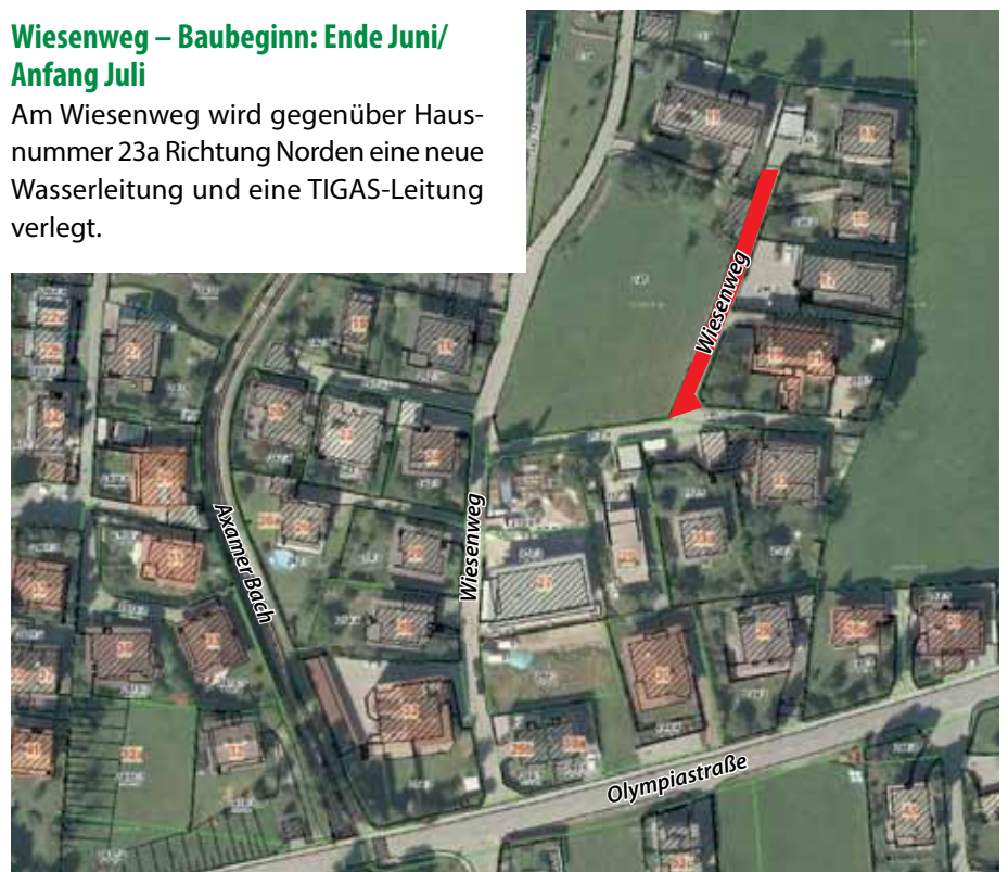
Übersichtsplan – rote Fläche = Baustellenbereich

Am Wiesenweg wird gegenüber Hausnummer 23a Richtung Norden eine neue Wasserleitung und eine TIGAS-Leitung verlegt.