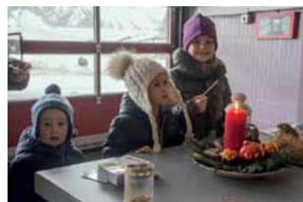
Ob Groß oder Klein – jeder kann das Friedenslicht holen