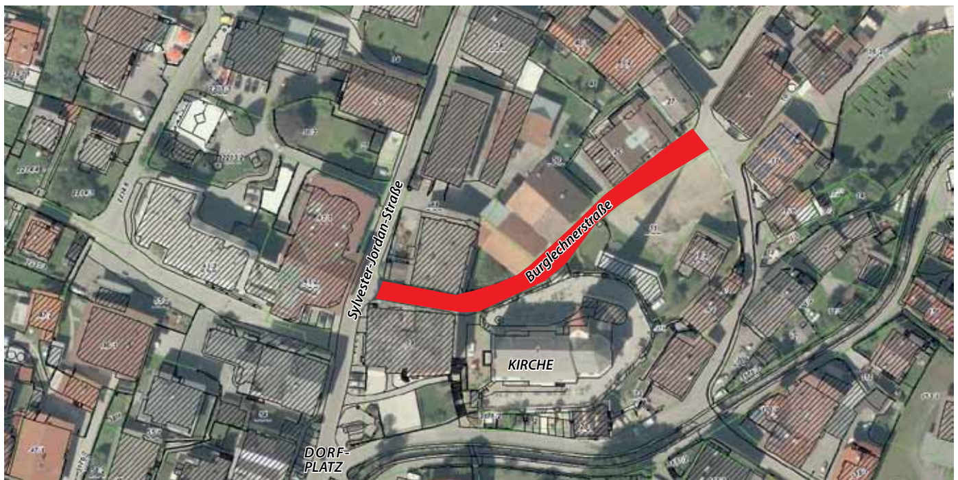
Übersichtsplan – rote Fläche = Baustellenbereich

ein 40 cm breiter Sickerstreifen aus Feinschotter eingebaut werden, der gegenüber der Fahrbahn durch einen Betonrandstein abgegrenzt wird. Weiters erfolgt die Verlegung eines neuen Straßenbeleuchtungskabels, eines Glasfaserkabels und eines Kabelschutzrohres.