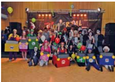
Die drei Erstplatzierten in der Gruppenwertung

Eine aktuelle Fotogalerie ist auf unserer Homepage online. Auch das Video, welches an diesem Tag an der Bar gemacht wurde, ist verlinkt. Ein großer Dank ergeht an alle Helfer, sowie an alle Gönner, För-