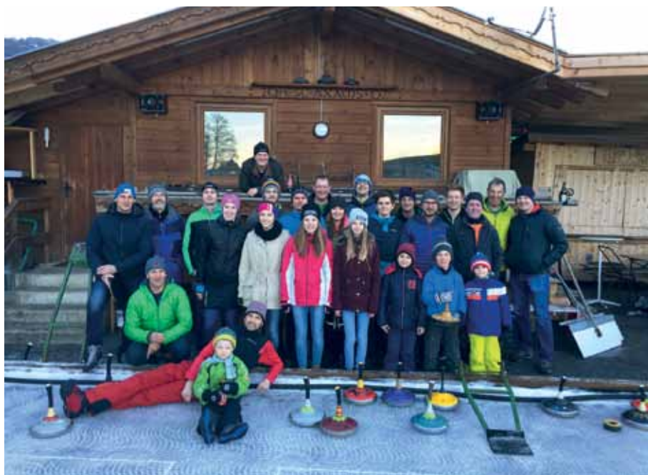
Zahlreiche unserer Musikanten folgten der Einladung zum Eisstockschießen.