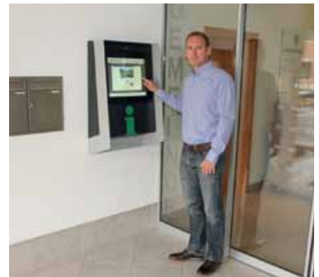
So sieht der Infopoint aus (am Beispiel der Gemeinde Kramsach), wenn er installiert ist.