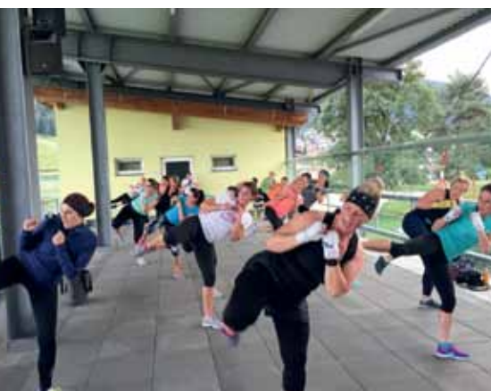
Während der Sommermonate trainieren die Tigers bei jedem Wetter im Ruifach-Stadion

Ab Oktober findet jeden Dienstag das Training wie immer in der Volksschulturnhalle Axams von 19:30 bis 20:30 Uhr statt, der 2. Trainingstermin der Woche ist dann ab sofort immer der FREITAG