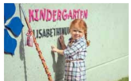
Der neue Kindergarten gefällt