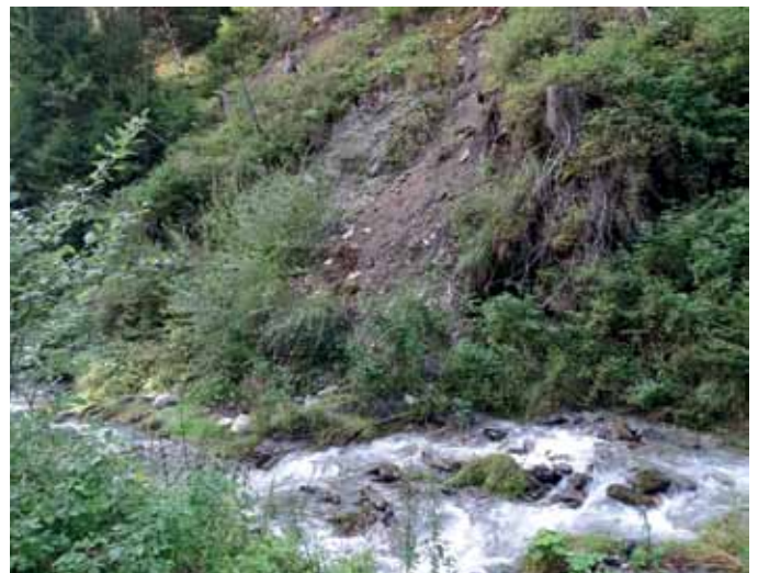
Hangrutsch Axamer Tal