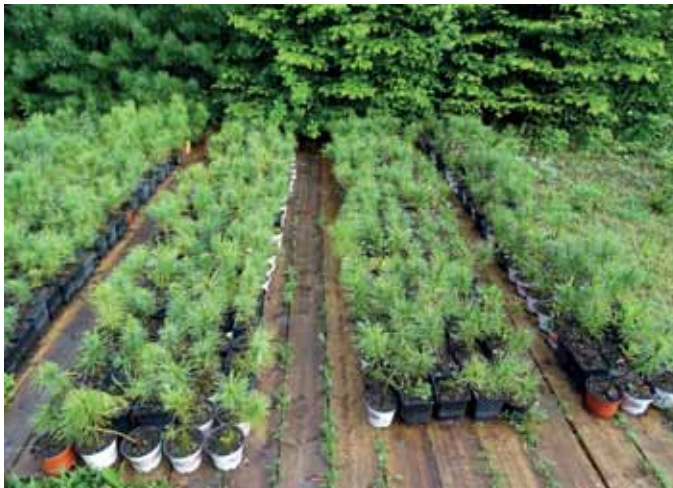
Verschulte Zirbenpflanzen in Töpfen