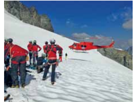
Übungsflüge am Tau

Axamer Lizum, wo der TT-Wandercup ebenfalls von der Bergrettung Axams betreut werden musste. Und so rückten 7 Bergretter der Ortsstelle Axams nach dem Arbeitsdienst am Dorfplatz in die Lizum ab, um dort bis 17.00 Uhr für die Sicherheit der mehr als 1.400 Teilnehmer zu sorgen.