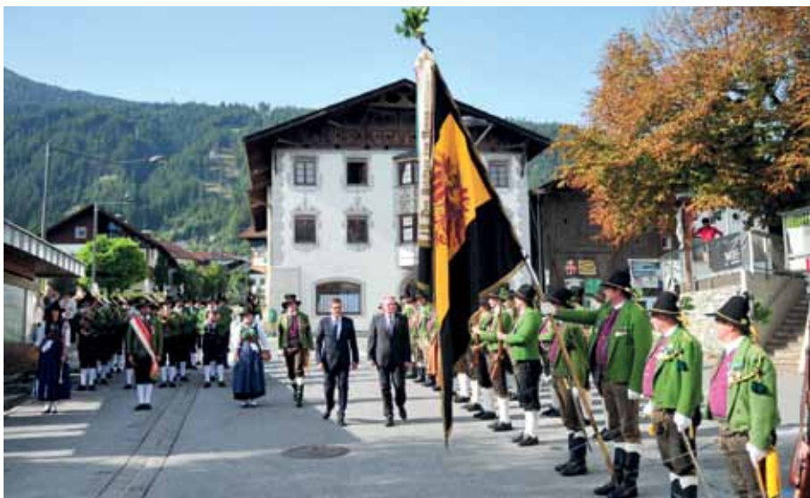
Abschreiten der Front beim landesüblichen Empfang am Dorfplatz

Das Gebäude ist im Niedrigenergiehausstil geplant. Sechs Kindergartengruppen und zwei Kinderkrippengruppen finden dort Platz. Neben den Gruppenräumen gibt es einen Werkraum, ein Atelier, eine Bibliothek, einen Schlafraum sowie einen großen Bewegungsraum. Im Garten sind großzügige Spiel- und Aufenthaltsbereiche vorgesehen.