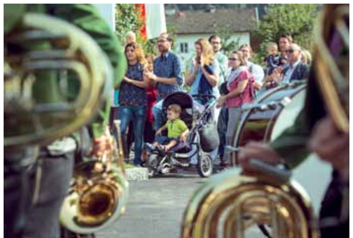
Großen Applaus für den neuen Kindergarten gab es von den zahlreich erschienenen Eltern.