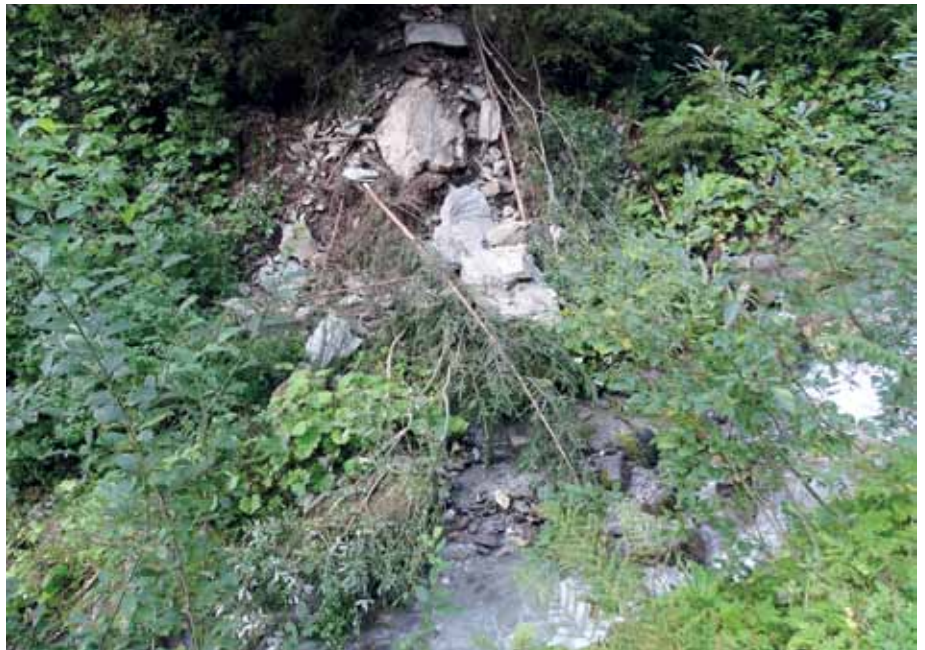
Felssturz in den Bach – Axamer Tal