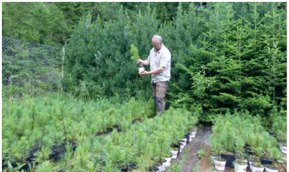
Qualitätskontrolle durch Waldaufseher