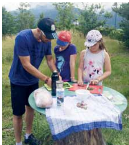
Wir bereiten einen Brotaufstrich mit unseren selbstgepflückten Kräutern zu