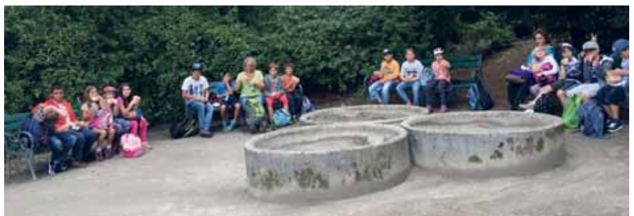
Besichtigung Schloß Ambras