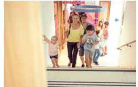
Für die Bevölkerung gab es die Möglichkeit zur Besichtigung