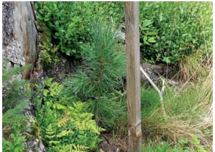
Aufgeförderte Zirbe, geschützt durch Pflock