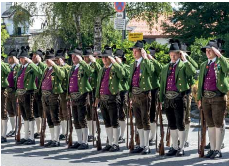
„Salutiert“ - der „Bluatstag“ hat eine besondere Bedeutung für unsere Schützen