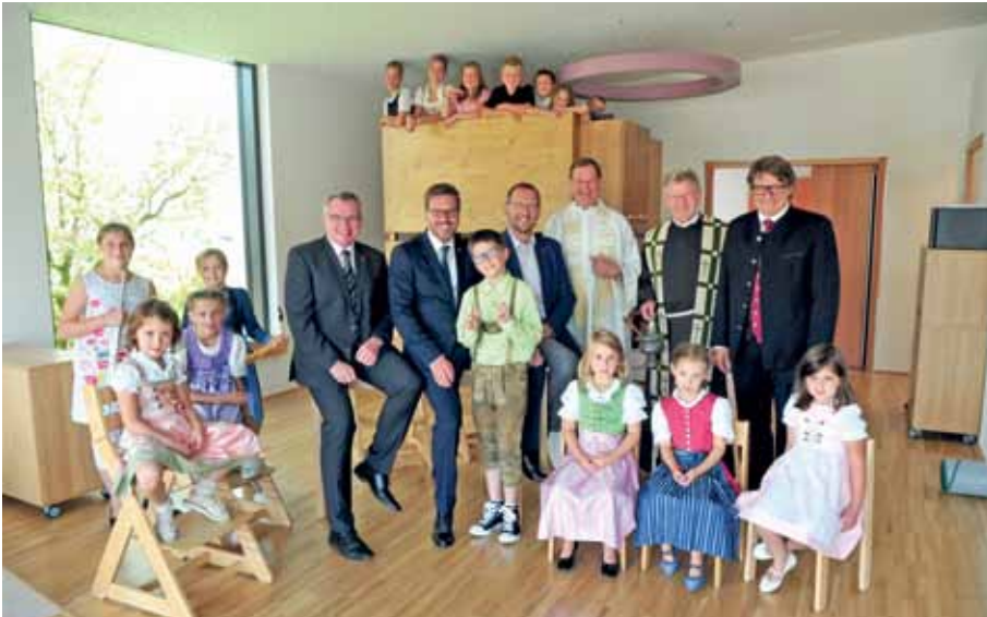
Gute Laune bei großen und kleinen Ehrengäste: Einige Kinder samt Ehrengäste beim offiziellen Einweihungsfoto!