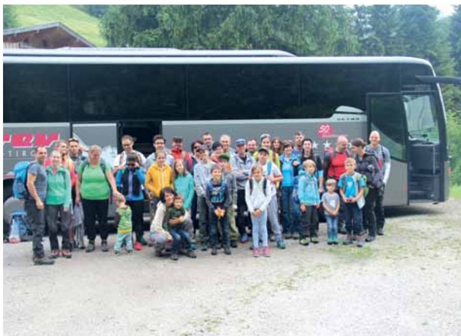
Mitreisende beim Naturfreunde-Ausflug