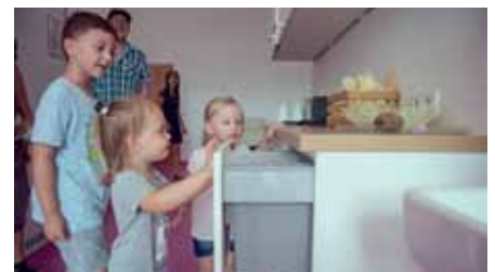
Viel Neues gab's zum Entdecken