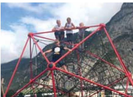
Ausflug zum Kemater Spielplatz