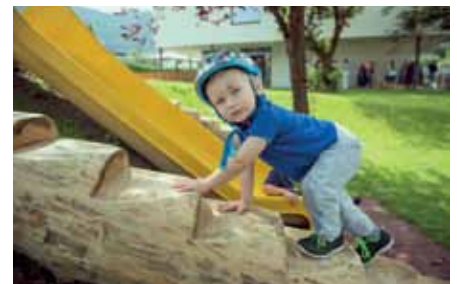
Action und Spaß sind garantiert!