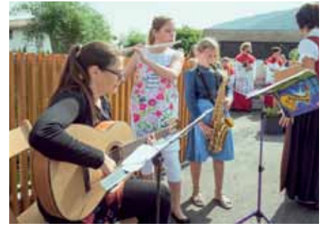
Kinder vom Kinderchor beim Schlusslied