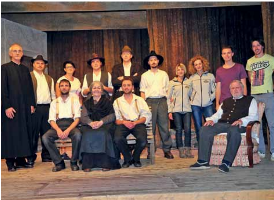
Die Mitwirkenden beim Theaterstück „Sonnwendtag“