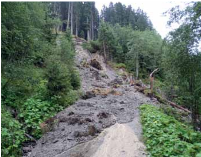
Mure auf Forstweg Nederschlag vor...