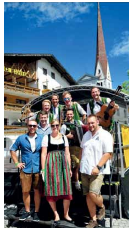
Das Organisationskomitee mit der Eschenauer Tanzmusi am Dorffest-Sonntag