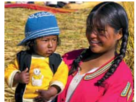
Das Weltladenteam bedankt sich bei allen Besuchern des Weltladens!

Vielen Dank allen, die den Weltladen besuchen, und so wesentlich für eine gerechtere Welt beitragen und der betroffenen Bevölkerung helfen.