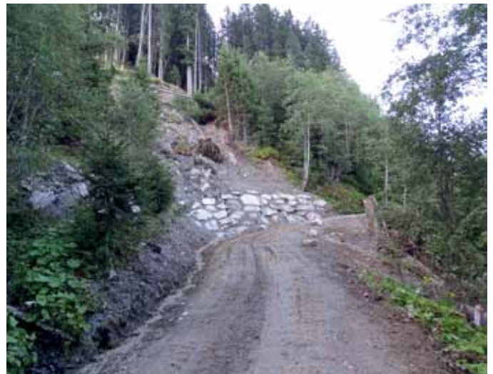
... und nach den Aufräumarbeiten