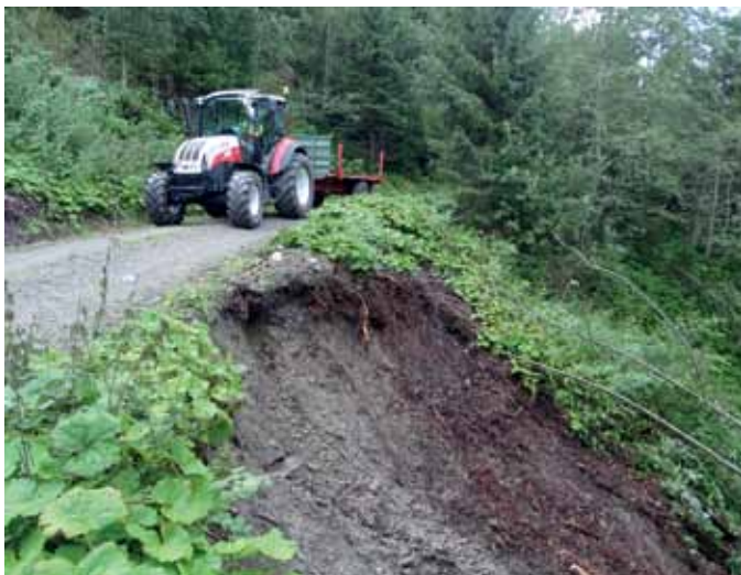
Hangrutsch talseitig von Forstweg