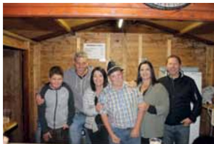
34. Axamer Dorffest 2017: Helfende Hände beim Schiklub Axams und Tuiflverein Axams – stellvertretend für die zahlreich mitwirkenden Vereine und deren guten Zusammenhalt!

Ein Beispiel für das wunderbar funktionierende Vereinsleben im Dorf zeigte