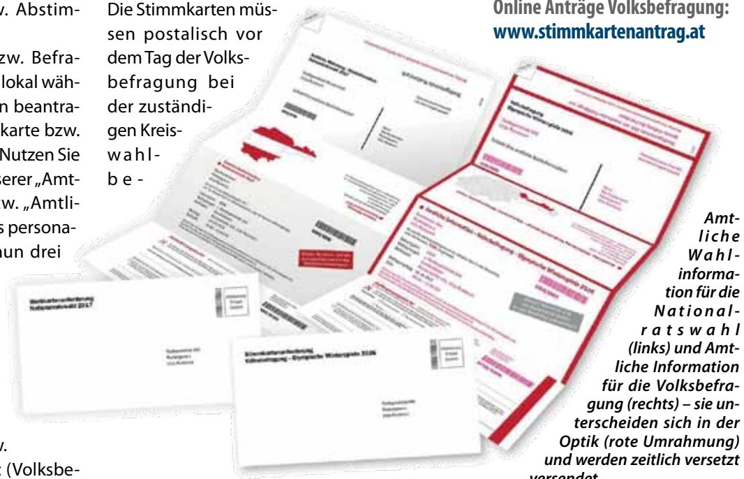
Amtliche Wahlinformation für die Nationalratswahl (links) und Amtliche Information für die Volksbefragung (rechts) – sie unterscheiden sich in der Optik (rote Umrahmung) und werden zeitlich versetzt versendet.

@ Online Anträge Nationalratswahl: www.wahlkartenantrag.at Online Anträge Volksbefragung: www.stimmkartenantrag.at