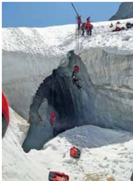
Abseilstation/Spaltenbergeübungen im Jamtal