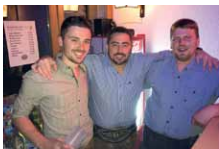
Beste Stimmung: Erfolgreicher Schützenball im Adelshof