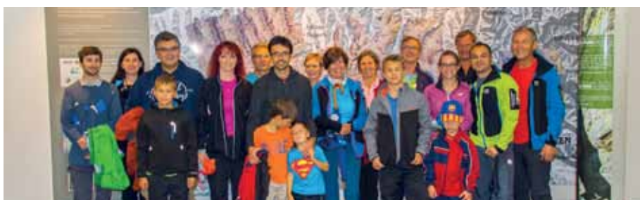
Die Mitgereisten waren vom Museum begeistert.