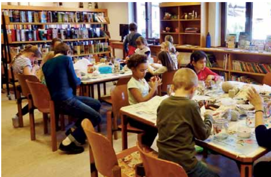
Die Kinder waren konzentriert bei der Arbeit.