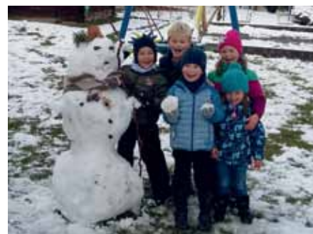
Voller Stolz präsentieren unsere Kinder ihren coolen Schneemann...