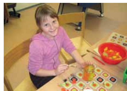
Basteln während der Adventszeit