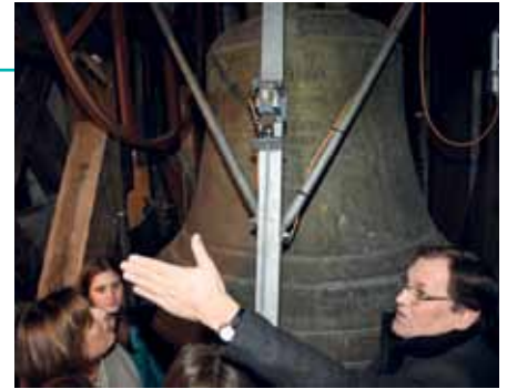
Der Pfarrer erklärt die Kirchenglocke.