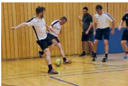
Seit November „zaubern“ die Dornacher beim beliebten Hallentraining.