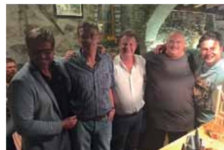
Ausflug der Schützen in die Partnergemeinde Naturns