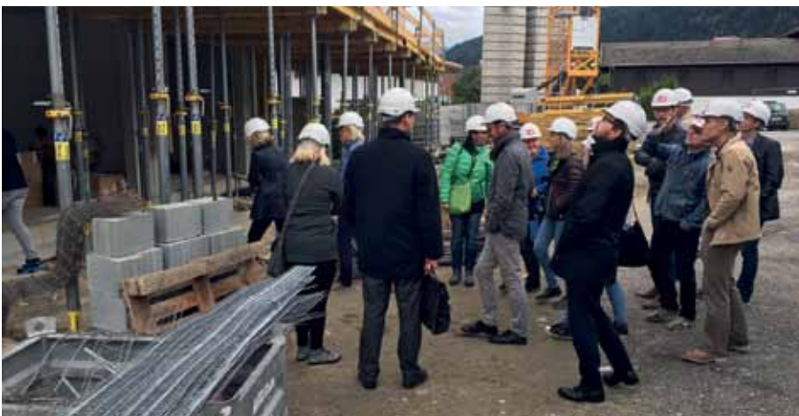
Am 14.10.2016 besichtigte der Gemeinderat den beeindruckenden Rohbau des neuen Kindergartens am Standort Mailweg.