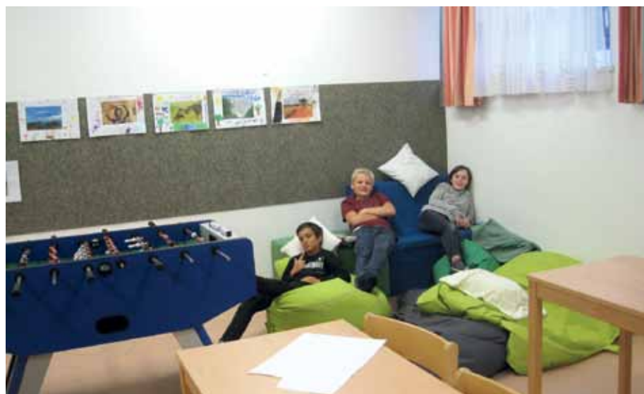
Die Schüler genießen die „Chill-Zone“.