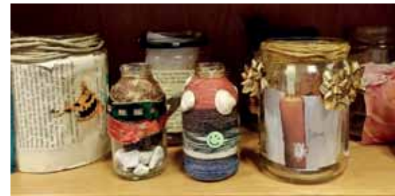
Die ersten Kunstwerke