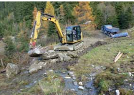
Beim Wegbau wurde auf ökologische Gesichtspunkte Rücksicht genommen und Nassstellen durch Grobsteinschüttungen überquert, damit das Wasser flächig durchfließen kann.

gung Schafalmmahd zur Schafalm und in der Folge weiter über den Pleisenweg zur Bärenhütte. Die Gesamtlänge der neuen Wegvariante beträgt knapp 6 km. Im Vergleich dazu ist der Axamer Talweg bis in die Lizum 3,6 km lang.