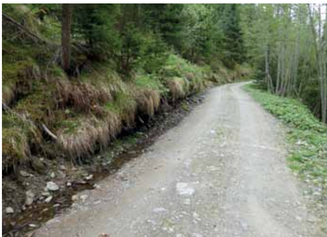
Die in die Jahre gekommenen Schutzbauten aus Holz...

von ca. 35 Jahren überschritten haben und sich teilweise schon in der Zerfallsphase befinden, sind in den Folgejahren auf diesem Gebiet sicher noch einige Investitionen notwendig, um eine sichere Wegbenützung gewährleisten zu können.