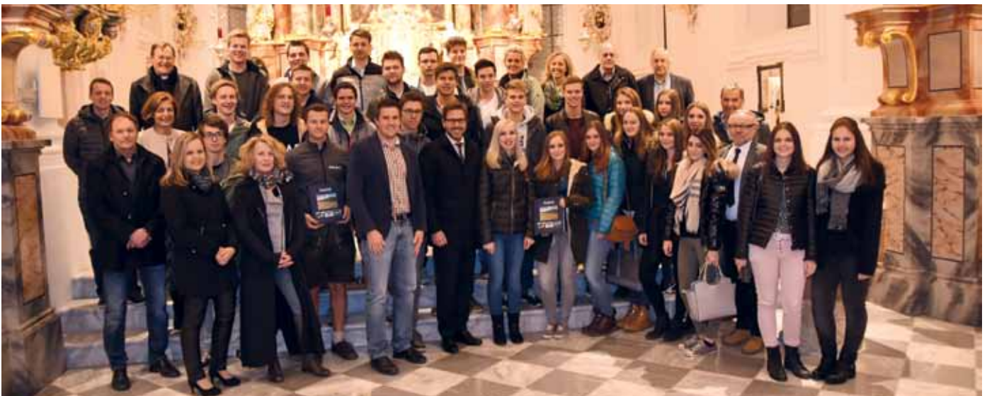
Andacht in der Pfarrkirche Axams