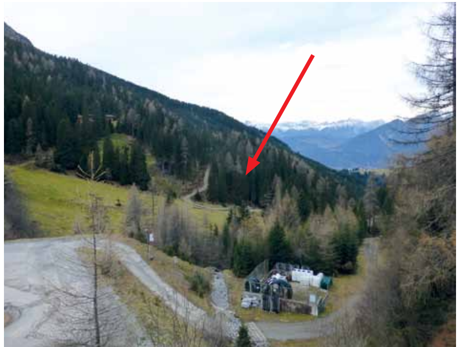
In der Bildmitte (siehe roter Pfeil) ein Teilstück des neu errichteten Weges zur Schafalm.