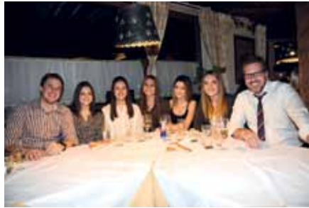
Der Bürgermeister und der Kulturausschussobmann in charmanter Begleitung...

sicherlich die Besichtigung des Kirchturmes. Abschluss des offiziellen Teiles war die Übergabe des Axamer Heimatbuches. Der gemütliche Teil fand dann im Gasthaus Kögele statt. Die Feier war ein voller Erfolg, den Jungbürgern hat es sehr gut gefallen und die Gemeinde bedankt sich hiermit bei allen Mitwirkenden.