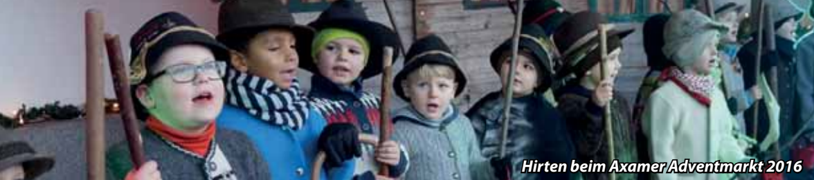
Hirten beim Axamer Adventmarkt 2016

e-mail gemeinde@axams.gv.at | homepage www.axams.gv.at