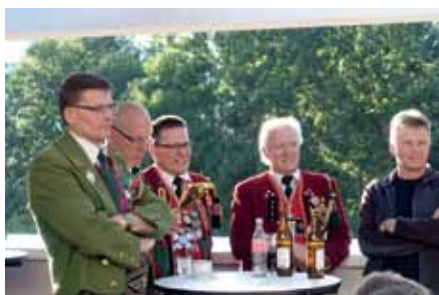
Viertelschießen in Zirl mit Axamer Beteiligung