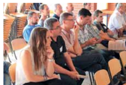
Die Delegation der Axamer Schützen beim Nachdenkenprozess.