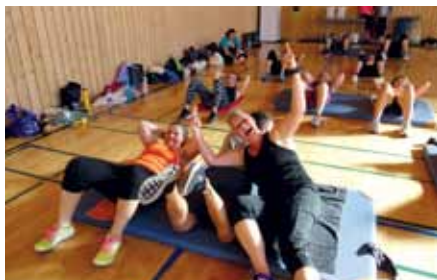
Caro und Gitti hatten sichtlich Spaß!

@ Vereinshomepage: www.taebo-tigers-tirol.at