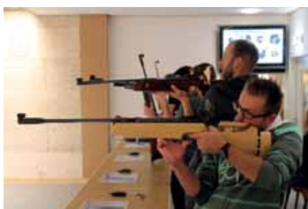
Bataillonsschießen in Sistrans: Axams auf Platz 6