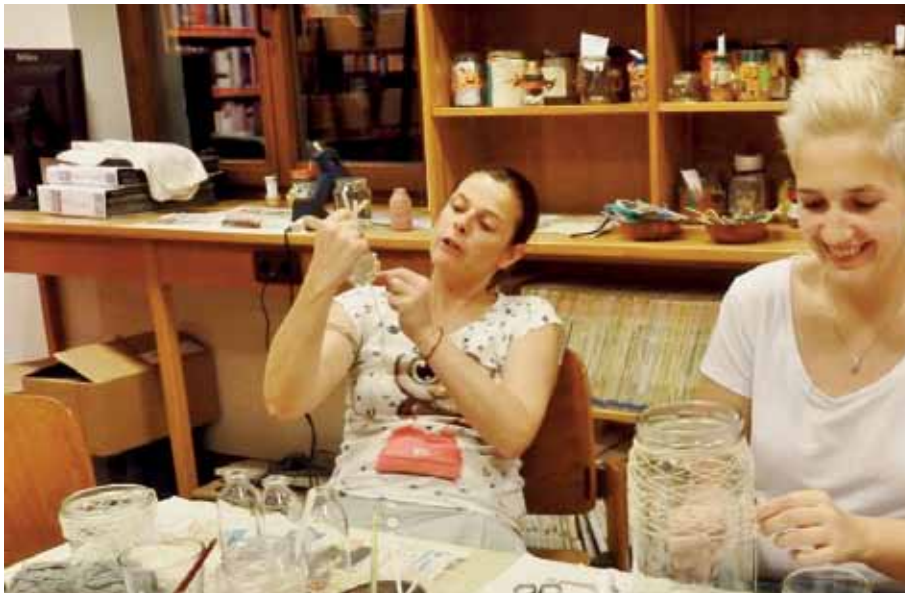
Geduld ist hier gefragt.

@ Homepage: http://www.buecherei-axams.blogspot.co.at