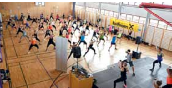
Tolle Stimmung bei vollem Haus