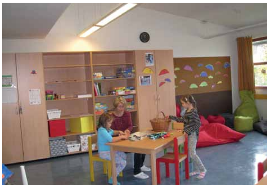
Der Mittagstisch als weiteres Betreuungsangebot