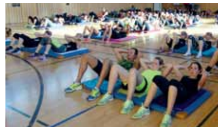
Smart.abs: Gemeinsam ist das Bauchmuskelttraining leichter.