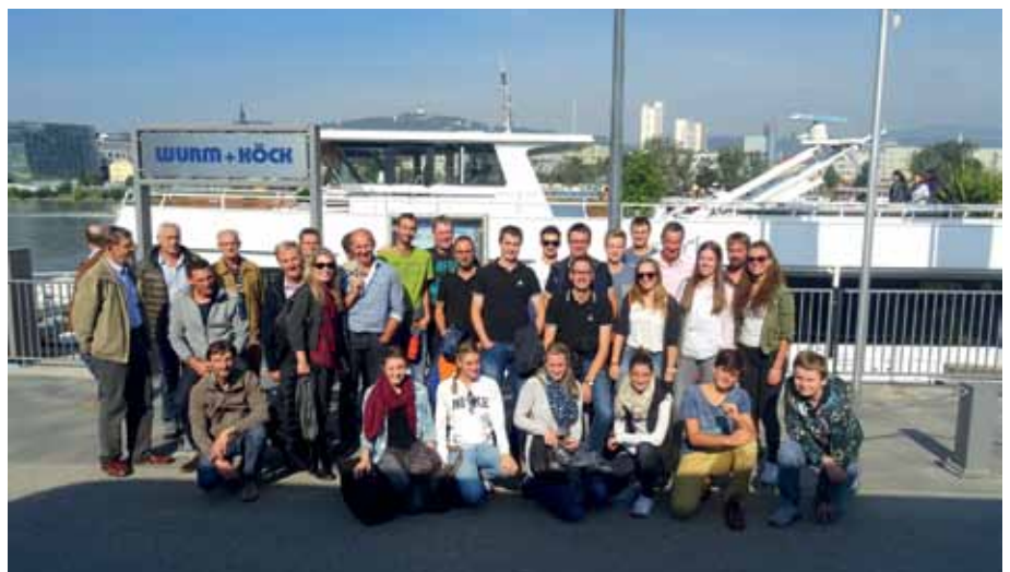
Gruppenfoto vor der Schifffahrt