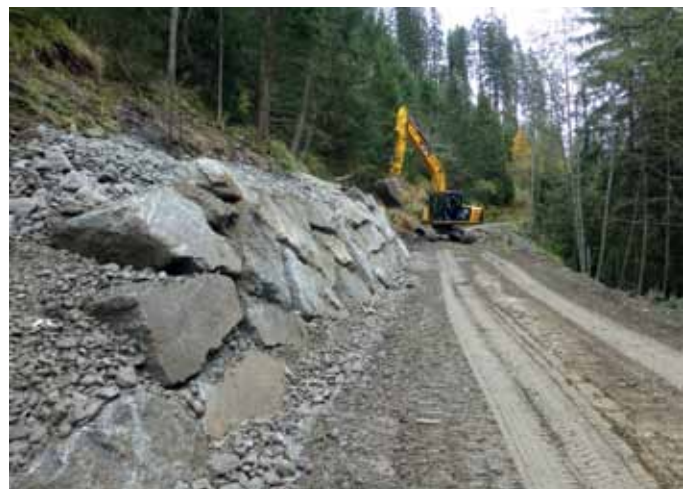
...wurden durch dauerhafte Steinschichtungen ersetzt.