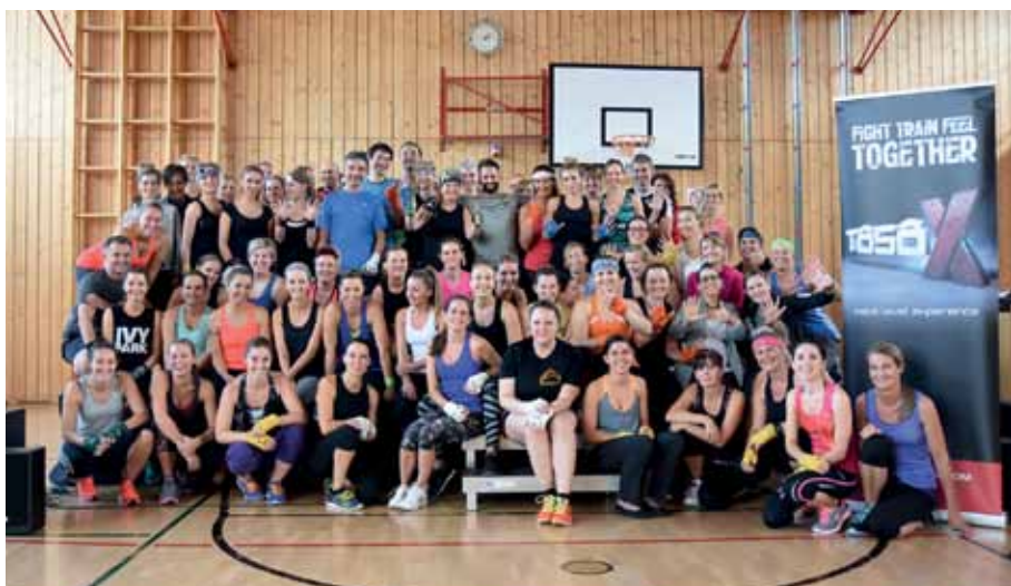
Rund 70 Sportbegeisterte waren beim Special dabei.