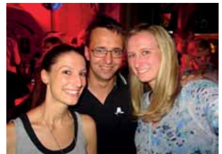
In der Linzer Alm