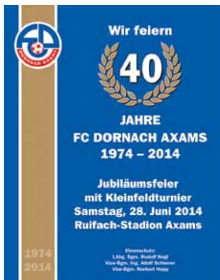
Festschrift anlässlich des Jubiläums

Der FC Dornach Axams begeht heuer sein 40-jähriges Vereinsjubiläum. Anlässlich dieses runden Jubiläums findet am Samstag, 28. Juni 2014 im Axamer Ruifach Stadion ein Festakt verbunden mit einem Fußball-Kleinfeldturnier statt. An diesem Festtag stehen auch zwei