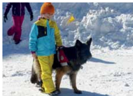
Das Üben mit einem Lawinenhund macht Spaß.

mit den Volksschülern der Klasse 2b einen informativen Tag in der Axamer Lizum durch. Nach einer kurzen Einführung in die Arbeit der Bergrettung durften die Kinder einige Aufgaben und Geräte der Bergrettung selbst ausprobieren. Es wurde fleißig mit dem LVS gesucht, verschiedene Untergründe sondiert (Schi, Rucksack, Boden), verletzte Personen mittels Vakuummatratze und Bergesack abtransportiert und da ein ausgebildeter Lawinenhund zur Verfügung stand, konnten die Kinder auch