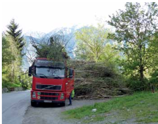
Das anfallende Material wird zu Energieholz verarbeitet.