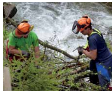
Profis der Wildbach- und Lawinerverbauung bei der Arbeit