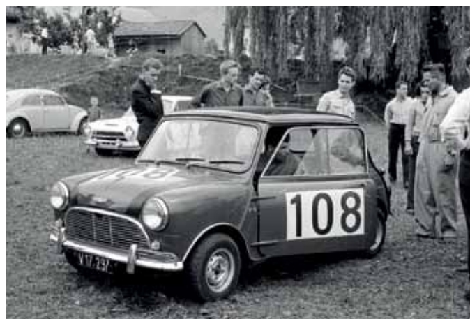
Letzte Startvorbereitungen im Bucher's Feld