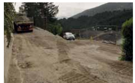
Auch der Kreuzungsbereich Kirchweg/Sonnleiten wird verbessert.