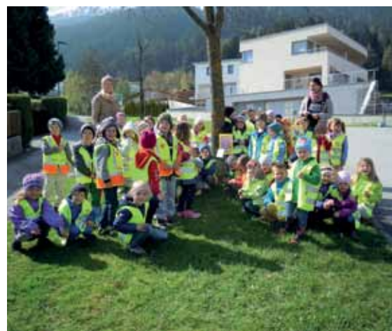
Ei, Ei, Ei, wir suchen den Osterhasen.