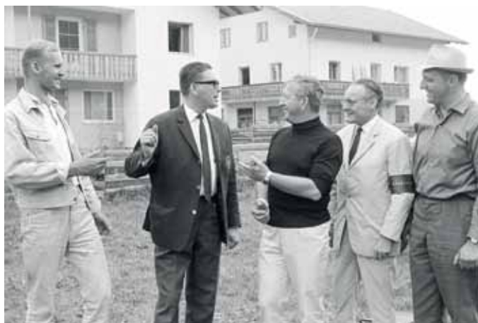
Frauenschwarm Gunther Philipp (3.v.li.) beim Fachsimpeln