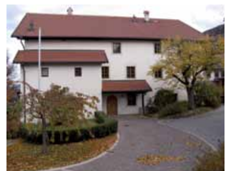
Die Vinzistund findet jeden Mittwoch von 17.00 bis 18.00 Uhr im Widum Axams statt.

@ Homepage: www.vinzenzgemeinschaft-tirol.at www.sr-wm.at