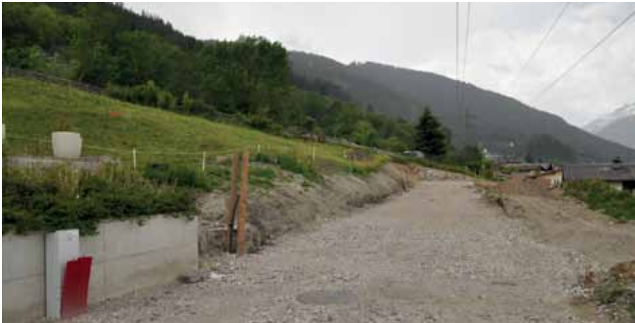
Am Franz-Zingerle-Weg Höhe Objekt Nr. 93 in Blick Richtung Westen – südlich des verlängerten Weges werden demnächst Wohnhäuser gebaut.

Aufgrund der ÖBB-Hochspannungsleitung wurde das neue Straßenniveau tiefer gebaut als das Bestandsgelände. Die angrenzenden Parzellen wurden ebenfalls den neuen Gegebenheiten angepasst. Die Arbeiten wurden von der Firma Hochtief Solutions AG mit den Billigstbieterpreisen aus dem Baulos Sonnleiten durchgeführt.