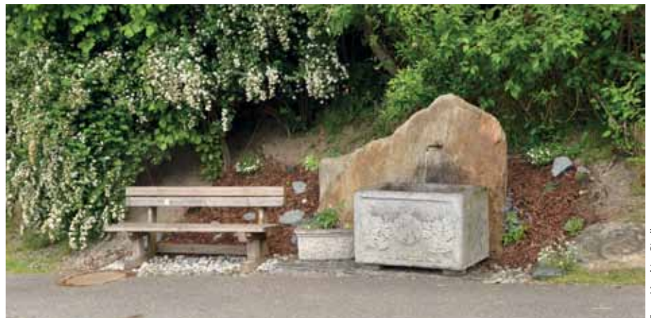
Dieses schöne Plätzchen entlang der Kögelestraße wird von Gabi und Thomas Mayrl betreut.

Interessierte mögen sich bitte beim Tourismusbüro Axams melden (Telefonnummer 05234/68178, E-Mail-Adresse: axams@innsbruck.info ).