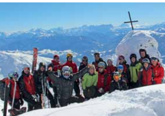
Mannschaftsfoto auf der Hochgrubachspitze