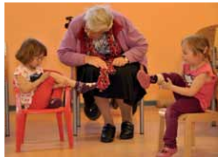
Bewegung mit Musik verbindet Alt und Jung.