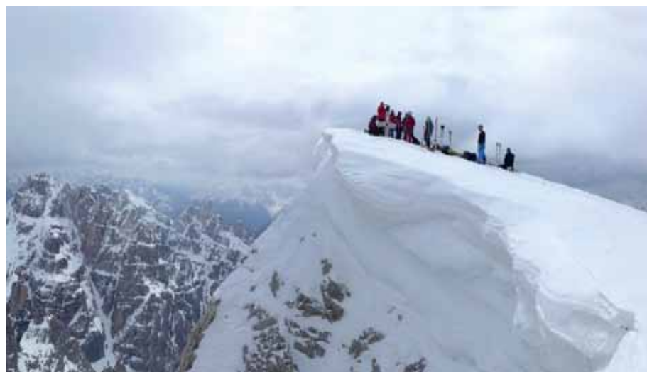
Hochbrunnenschneid – Gipfelfoto