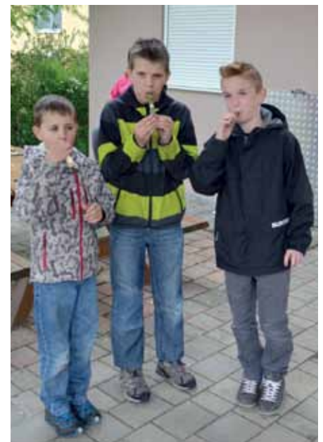
Mit Stolz wurden die Maipfeiferln präsentiert.