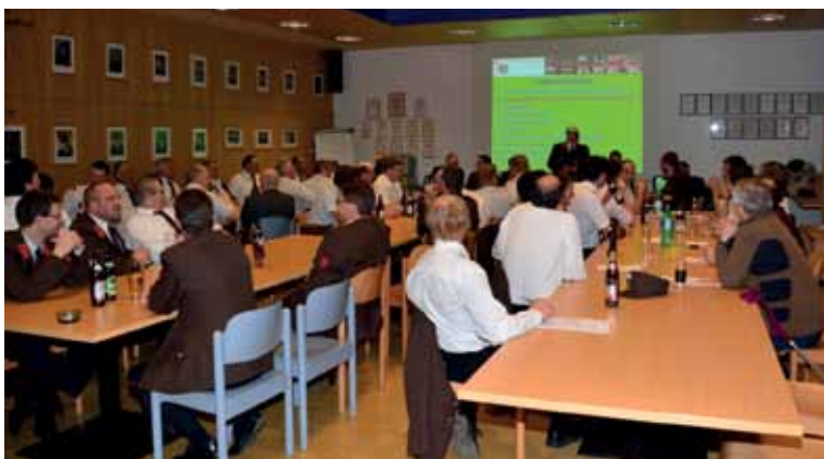
Zahlreiche Mitglieder nahmen an der Versammlung teil.