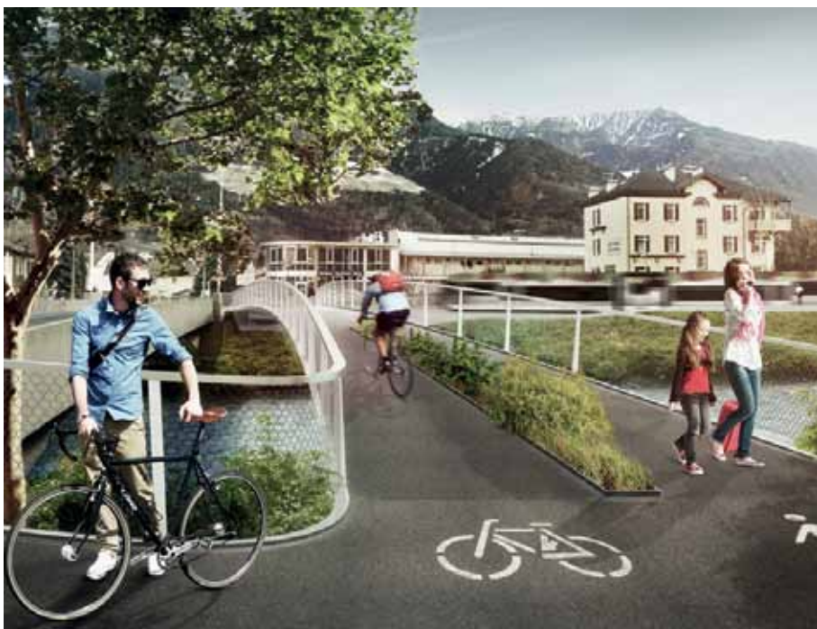
So wird die neue Brücke „Axamer Steg“ nach Fertigstellung aussehen.