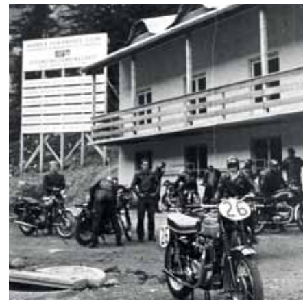
Damalige Skihütte – heute Lizumerhof

@ Weitere Bilder unter: www.innsbruck.info/axams Menüpunkt „Erleben“ Rubrik „50 Jahre Olympische Zeiten“