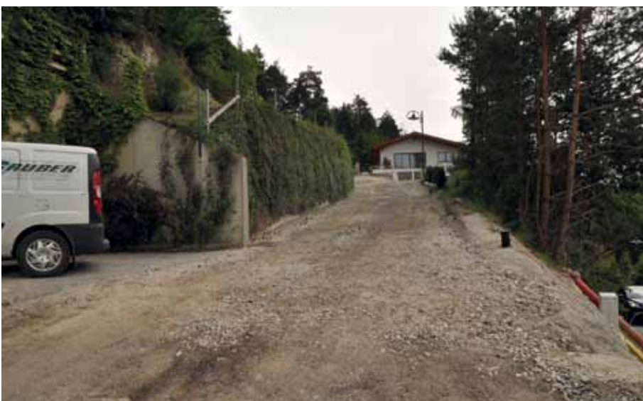
Der nördliche Abschnitt des Kirchweges konnte durchgehend auf eine Breite von mindestens vier Metern ausgebaut werden.