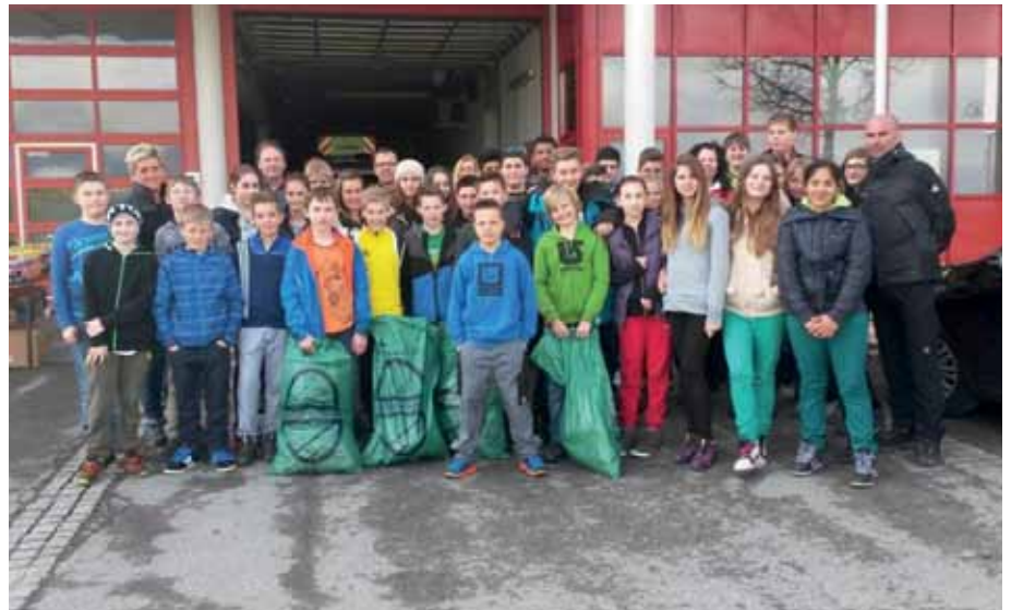
Die fleißigen Sammler wurden mit einer zünftigen Jause belohnt.