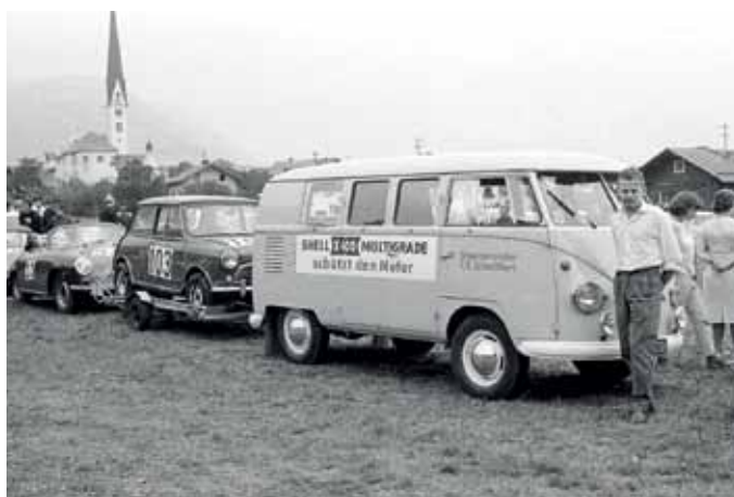
Bucher's Feld wurde als Boxenstraße umfunktioniert.