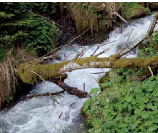
Diese ökologisch wertvolle „Brücke“ wurde natürlich belassen.

Das Schneebruchereignis vom 11. Oktober 2013 hat im Axamer Tal zahlreiche Bäume ins Bachbett gedrückt. Vor allem waren Erlen und Weiden betroffen. In vielen Bereichen des Axamer Tales wur-