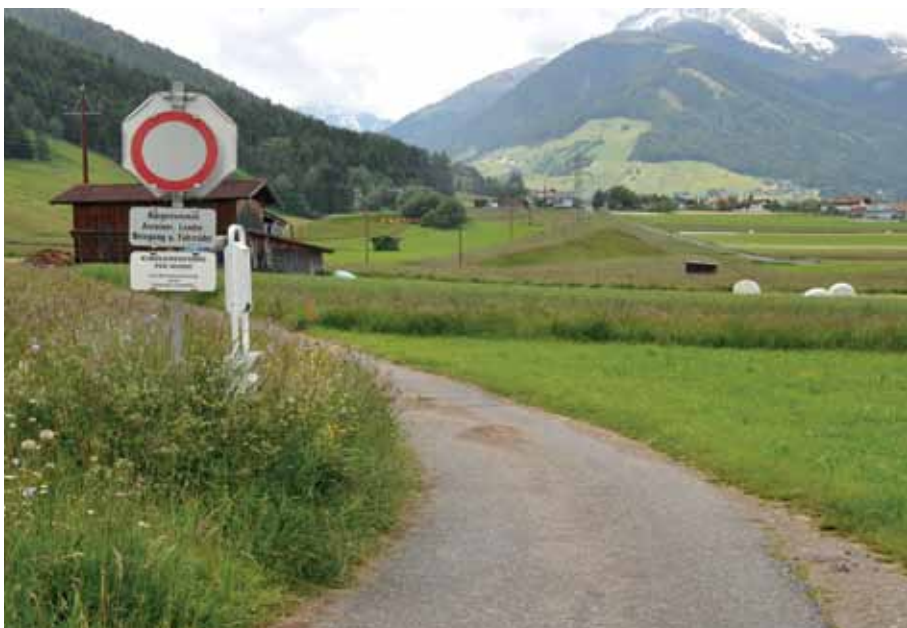
In Axams herrscht für Hunde Kurzleinenzwang. Schilder weisen darauf hin.

@ Verordnung unter: www.axams.gv.at Menüpunkt „Bürgerservice“ Rubrik „Verordnungen“