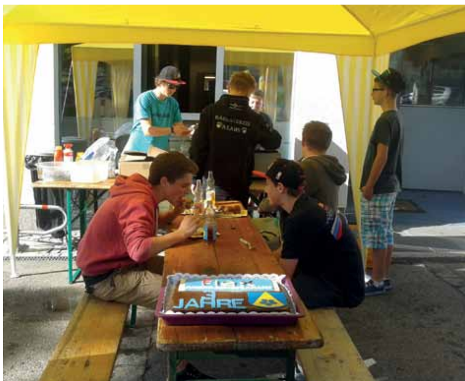
Zur 3-Jahresfeier gab es sogar einen speziellen Kuchen.

Bevor das Jugendzentrum in die Sommerpause geht, steht noch einiges an. Auch heuer wieder veranstaltet JiM – Jugend im Mittelgebirge, eine Kooperation der Jugendzentren in Götzens, Axams und Grinzens, eine Summerparty am 27. Juni beim Freizeitzentrum in Axams. Bei guter Musik mit hervorra-