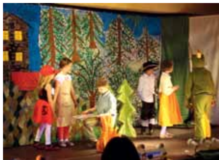
Theaterstück „Im Auftrag seiner Majestät“