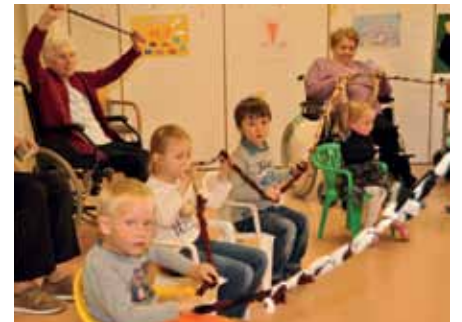
Durch Spaß an der Bewegung mit Musik wird Lebensfreude wieder gefunden.