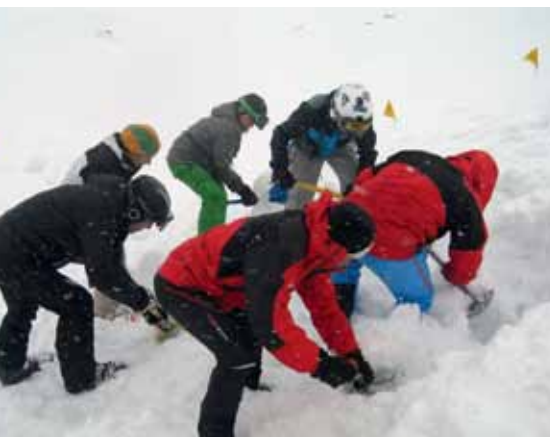
Den Jugendlichen wurde der richtige Umgang mit Schaufel und Sonde beigebracht.

Am 12.4.2014 organisierte das Flax, in erfolgreicher Kooperation mit der Bergrettung Axams, das erste Lawinen- und Sicherheitstraining für jugendliche Freerider und Tourengänger. Die ganztägige Schulung beinhaltete einen theoretischen Teil, wo den Teilnehmern das richtige Verhalten im offenen Skiraum, sowie die Beurteilung der vorherrschenden Lawinensituation näher gebracht wurde. Anschließend ging es gleich über zur Praxis. Es wurde der richtige Umgang mit dem LVS-Gerät sowie Schaufel und Sonde geübt. Bei der abschließenden, wohlverdienten Mahlzeit konnten alle den etwas anderen, aber lehrreichen, Skitag gemütlich ausklingen lassen. Das Flax freut sich schon auf eine erfolgreiche Zusammenarbeit und rege Teilnahme im nächsten Jahr!