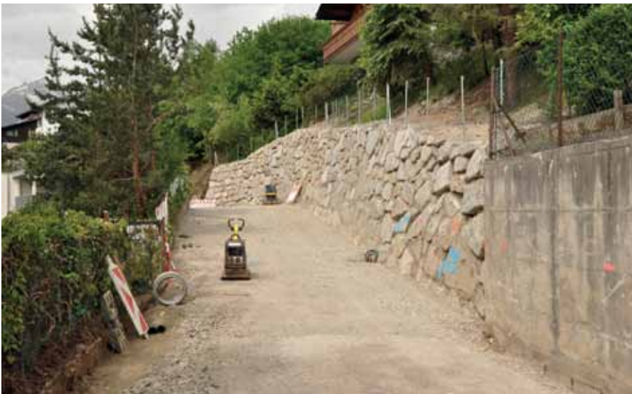
Die nördlichen Böschungen des Sonnleitenweges wurden überwiegend mittels Steinschlichtmauern befestigt.

Die Gemeinde Axams bedankt sich bei sämtlichen Anrainern für ihre aufgebrachte Geduld und den getätigten privaten Baumaßnahmen aufgrund der Baustelle. Mit Fertigstellung im Juli 2014 kann die Straße wieder ordnungsgemäß und in perfekter Ausführung benützt werden.