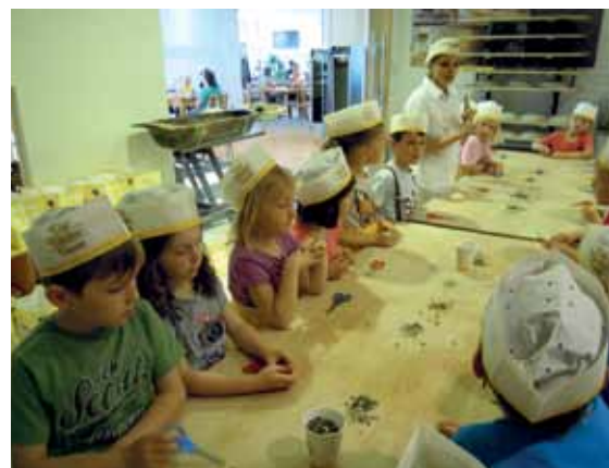
Backe, backe Brot – selbstgemacht schmeckt doch am besten.