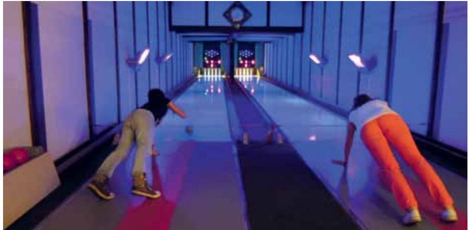
Erstaunlich, auf wie viele kreative, sportliche Varianten man kegeln kann.

Deutschland. Der Vorstand wünscht seinen Mitgliedern für die nächsten Jahre wieder alles Gute, viel Gesundheit und sportliche Events.