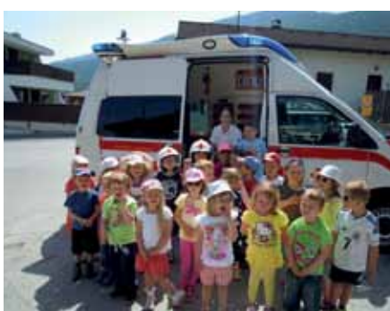
Was tun bei einem Unfall? Dank der Rettungssanitäter wissen wir genau, was zu tun ist.