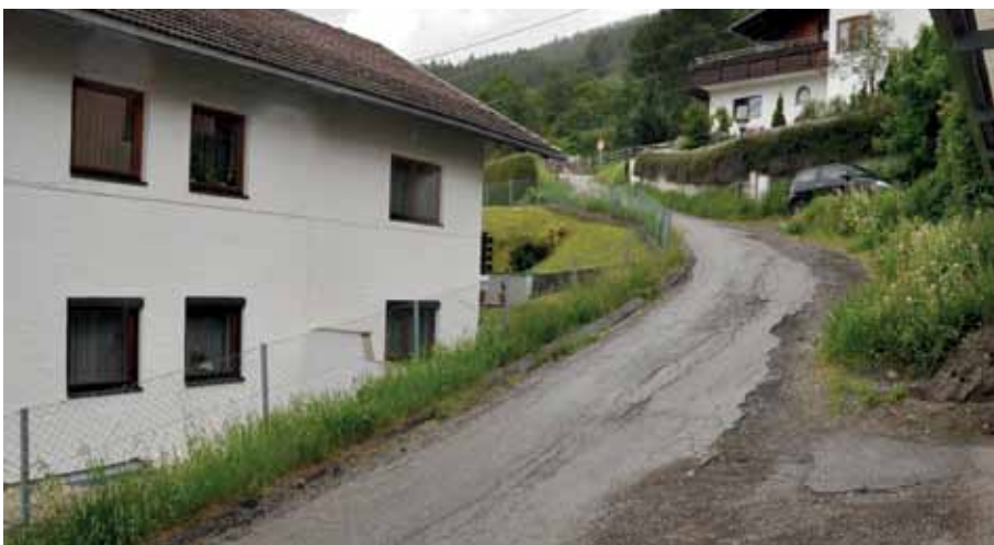
In diesem Abschnitt wird die Gemeindestraße Kalchgruben (Höhe Objekt Nr. 37) in Richtung Süden (Panoramaweg) erneuert.

Zudem wird der Regenwasserkanal vom Panoramaweg nach Kalchgruben hin erweitert und die Tigasleitung mitverlegt. Nach dem Auskoffern der Gemeindestraße wird diese neu asphaltiert.