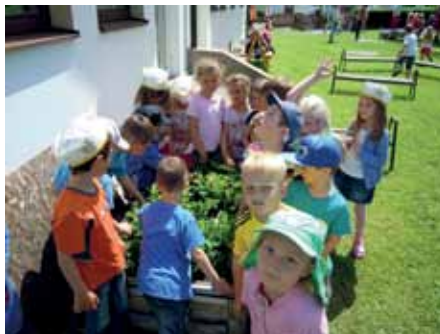
Unser Erdbeerland ist hiermit eröffnet.