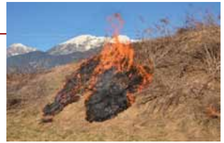
Noch in der Entstehungsphase wurde das Feuer beim BöschungsbRAND in Zifres bekämpft.

Wir bedanken uns daher bei unseren Kameraden für die Freiwilligkeit und Bereitschaft für so viele Leistungen, welche neben dem normalen Lebensalltag vollbracht werden!