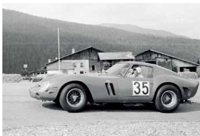
Die Rennstrecke führte beim Adelshof vorbei.