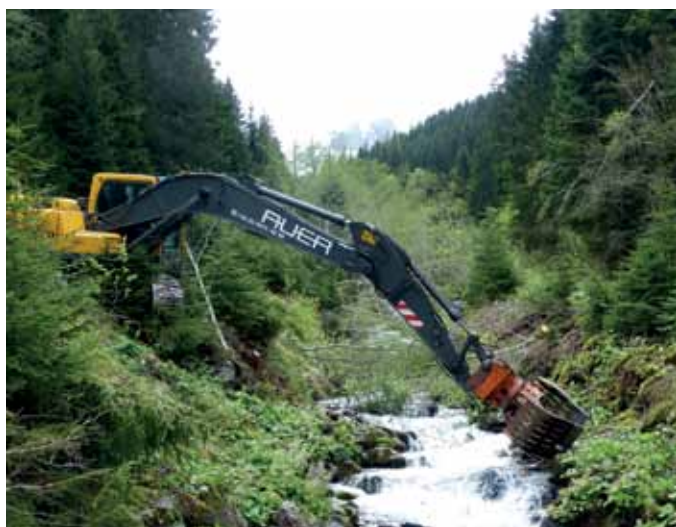
Für die Bachräumung war schweres Gerät notwendig.