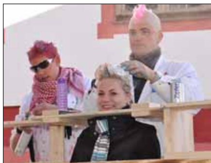
Der Frisörsalon der "Kögele-Hex'n" verteilte an die Besucher/innen Gutscheine.