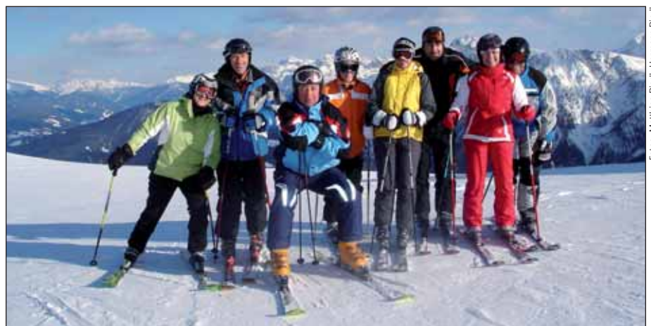
Gruppenfoto am Kronplatz: ein Teil der Mitgereisten