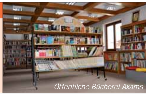
Öffentliche Bücherei Axams