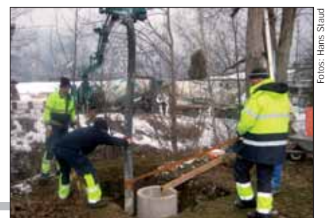
Die Erdarbeiten werden größtenteils von der Gemeinde in Eigenregie ausgeführt.