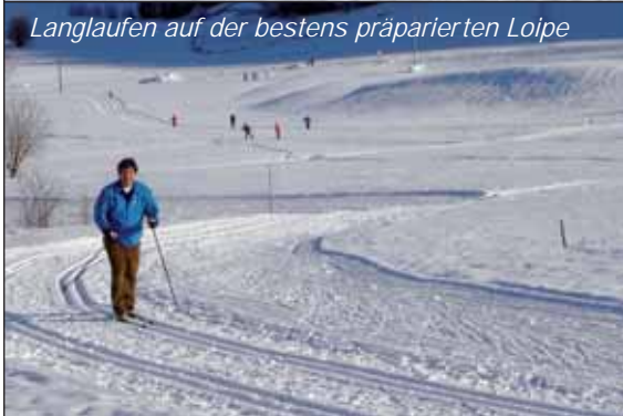
Langlaufen auf der bestens präparierten Loipe