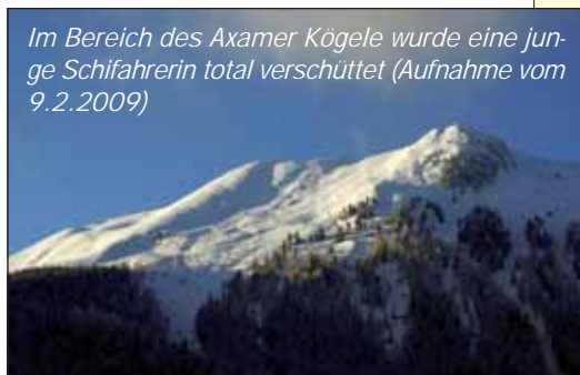
Im Bereich des Axamer Kögele wurde eine junge Schifahrerin total verschüttet (Aufnahme vom 9.2.2009)