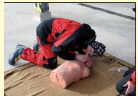
Die intensive Aus- und Weiterbildung der Bergretter in der Ersten Hilfe stellt bei jeder Übung einen Fixpunkt dar.

Mit der neu entwickelten Rastersuche kann nun der Lawinenkegel noch systematischer abgesucht werden.