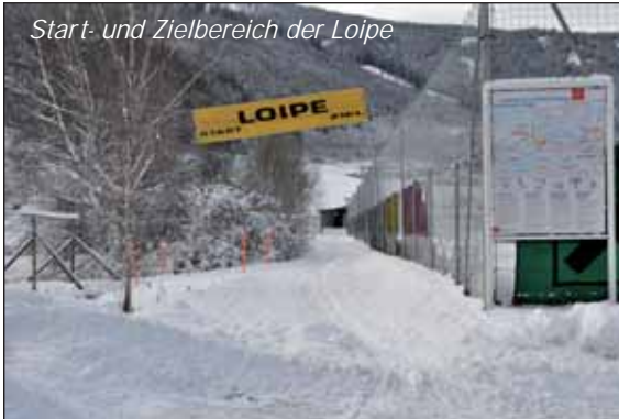
Start- und Zielbereich der Loipe