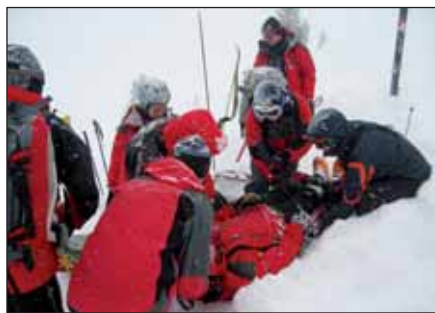
Nachdem der "verschüttete" Tourengeher von den Bergrettern ausgegraben wurde, wird er versorgt und mit dem Akja abtransportiert.