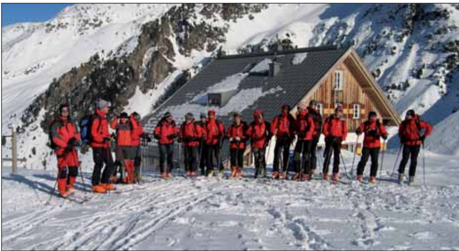
Insgesamt nahmen an der Übung 25 Bergretter der Ortsstelle teil.