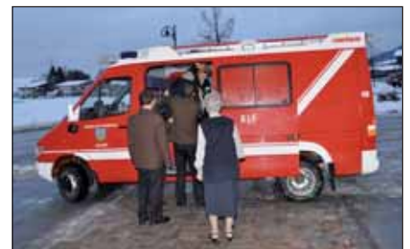
Die Feuerwehr Axams brachte die Senioren wieder sicher nach Hause.