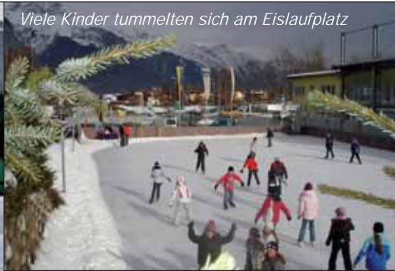
Viele Kinder tummelten sich am Eislaufplatz