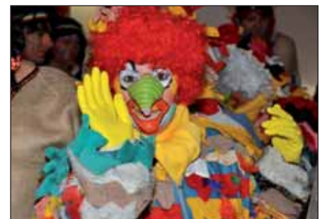
Axamer Hennen haben bewiesen, dass man auch gekochte Eier legen kann.