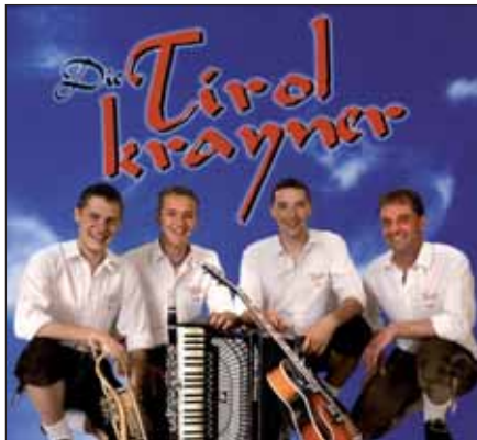
Spielen beim Musikball auf: Tirolkryoner

nächste Jahr wird ein ganz besonderes für die Axamer Musikkapelle: 2010 feiern wir sowohl unser 200-jähriges Bestehen als auch das Bezirksmusikfest in Axams .