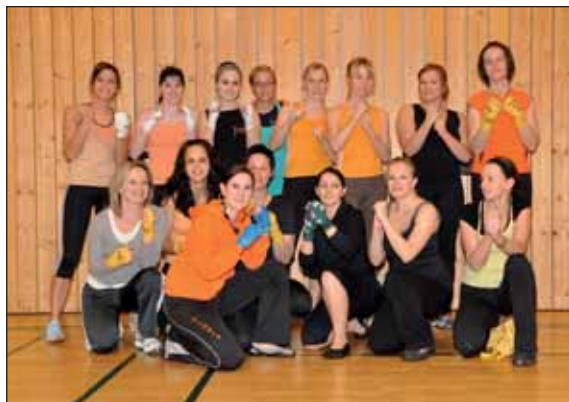
Die Taebo Tigers freuen sich bereits auf das Training im Freien.

intensiven, ausgelassenen, mit toller Musik umrahmten Trainingsstunden einladen. Tae Bo muss man erleben, um es richtig zu spüren. Sei es, um den inneren Schweinehund zu besiegen, die Kondition zu verbessern, die Kraft zu trainieren, Stress abzubauen oder die Ausdauer zu fördern - bei Tae Bo ist für jeden etwas dabei. Probier's aus und komm zu einer Schnupperstunde vorbei!