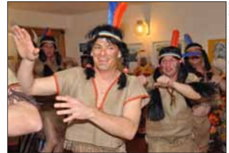
"Asterix & Obelix bei den Indianern" - hervorragend inszeniert von der Feuerwehr Axams.