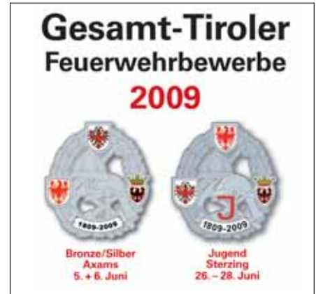
Die eigens kreierten Abzeichen

Gemeinden und dem generellen Rauchverbot waren die Ball-Lokalitäten bis auf den letzten Platz gefüllt. Nach der Premiere als Maskenball im Vorjahr boten viele maskierte Pärchen und Gruppen ein farbiges Bild für alle Besucher und sorgten damit für gute Stimmung. Die Balleinlage der Ausschussmitglieder sorgte nach einem Jahr Pause wieder für viele Lacher. Der Orig. Almrauschklang war für eine volle Tanzfläche bis in die frühen Morgenstunden verantwortlich. Für den nächsten Ball am 6. Feber 2010 laufen bereits die Verhandlungen mit einer neuen Musikgruppe. Wir bedanken uns bei allen Beteiligten, die zum Gelingen dieses großartigen Balles beigetragen haben.