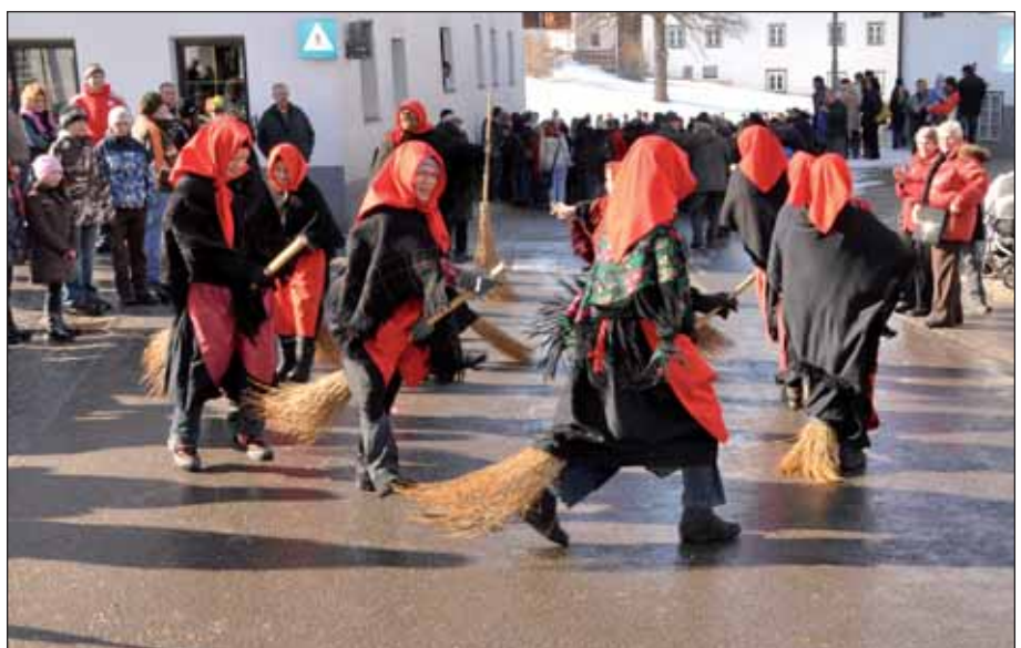
Um den Laniger-Nachwuchs braucht man sich keine Sorgen machen.