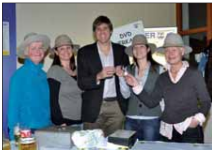
Die Fasnachtmitglieder freuten sich über den gelungenen Abend.