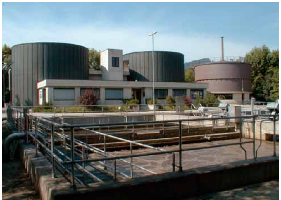
Im Klärwerk des Abwasserverbandes Untere Schranne werden unsere Abwässer behandelt und entsorgt.

Achten Sie zudem bei der Verwendung von Reinigungsmitteln auf eine vernünftige Dosierung. Das spart Geld, sowohl im Einkauf als auch bei den Entsorgungskosten Ihres Abwassers.