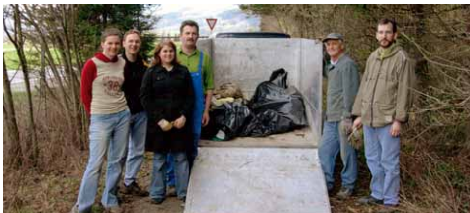
Die freiwilligen Helfer der BMK Ebbs mit ihren „Funden“ bei der Dorfputzaktion 2005

Weiters möchten wir uns bei unserem Entsorgungsunternehmen, der Firma Recycling Ost GmbH., bedanken, die im heurigen Jahr erneut die kostenlose Entsorgung (nur die Bundesabgabe – Altlastensanierungsbeitrag – ist zu entrichten) des gesammelten Mülls ermöglicht. Nun ist nur noch ein Großaufgebot von freiwilligen Gemeindebürgern (Vereine, Schulen, etc.) notwendig, um die illegalen Müllablagerungen im Gemeindegebiet zu beseitigen und ein schönes Orts- und Landschaftsbild zu erhalten. Im Vorjahr wurden unsere Bäche, Wiesen und Wälder von insgesamt 1.480 kg Müll befreit.