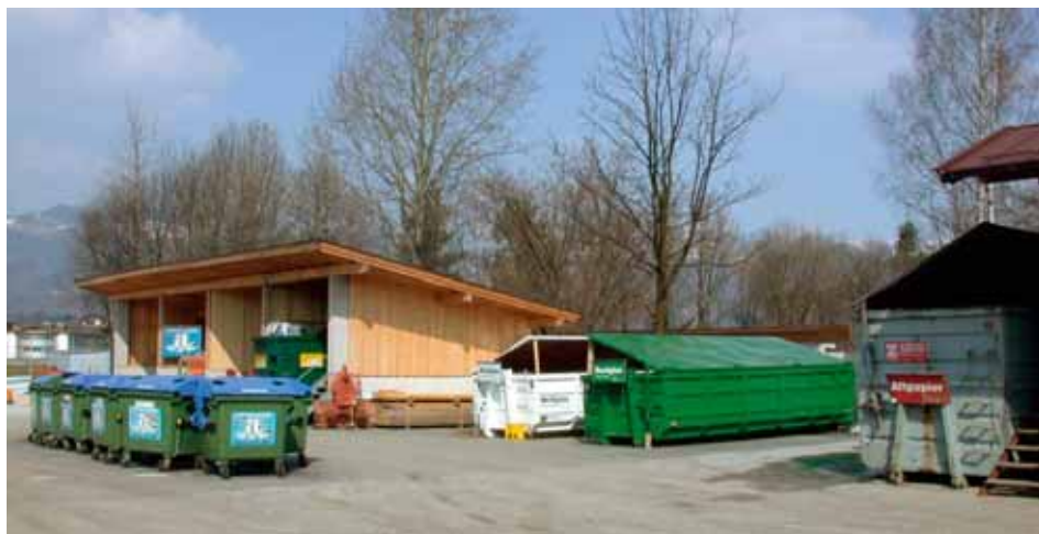
Der Recyclinghof der Gemeinde Ebbs.

Aufgrund der Montag-Feiertage (Ostermontag, Staatsfeiertag) ist der Recyclinghof am Dienstag, den 18. April von 13–18 Uhr und am Dienstag, den 2. Mai von 8–12 und von 13–18 Uhr ( ganztäglich wegen der Altkleidersammlung ) geöffnet.