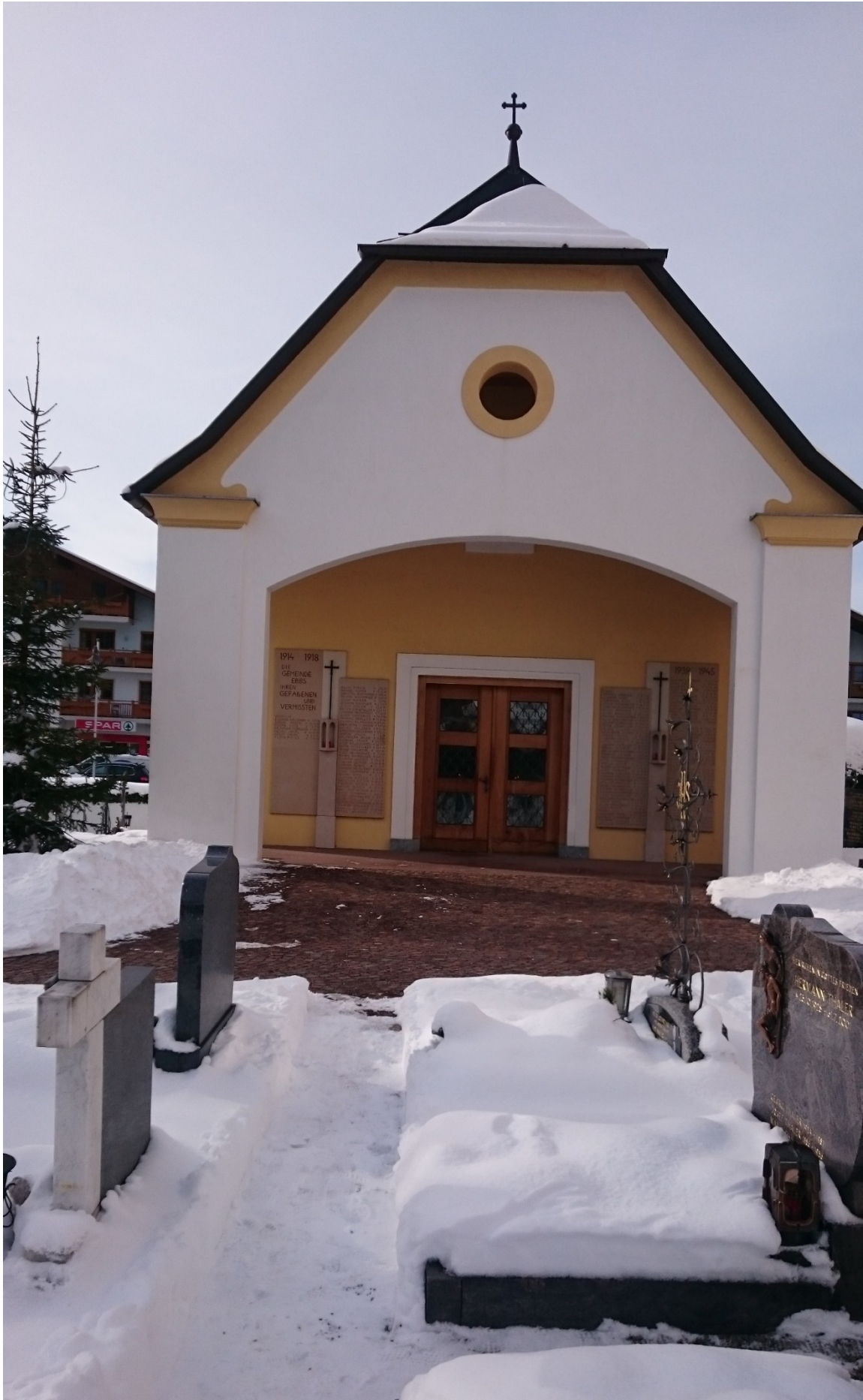
Neue Kapelle aus dem Jahr 2006