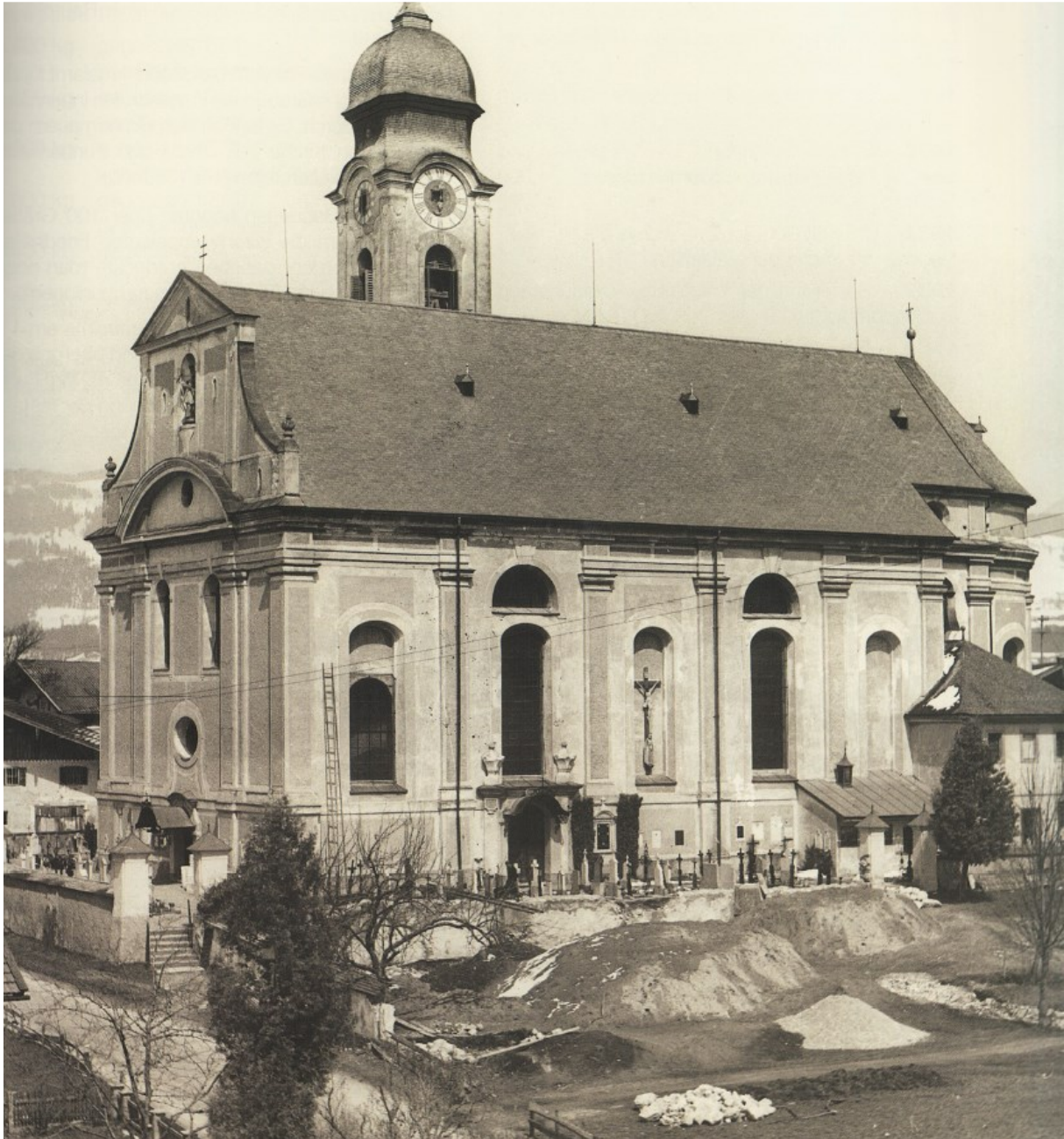
Friedhofserweiterung 1954, Bild aus Ebbsbuch von Georg Anker aus dem Jahr 2014

Der um die Kirche gelegene Friedhof der Gemeinde Ebbs wurde zu klein. Daher wurde eine Erweiterung Richtung Süden hin vorgenommen. Das stark abfallende Gelände wurde mit Mehlsand aus dem Inn aufgefüllt. Die Bürger aus Ebbs (Bauern aber auch Gewerbetreibende und Häuslbauer bzw. Wohnungsmieter) aus Eichelwang (Bauerngehöfte), Schanz, Oberndorf, Ebbs, Wagrain, Point, Tafang und Oberweidach (es gab damals dort nur wenige Häuser) wurden zur Erbringung von