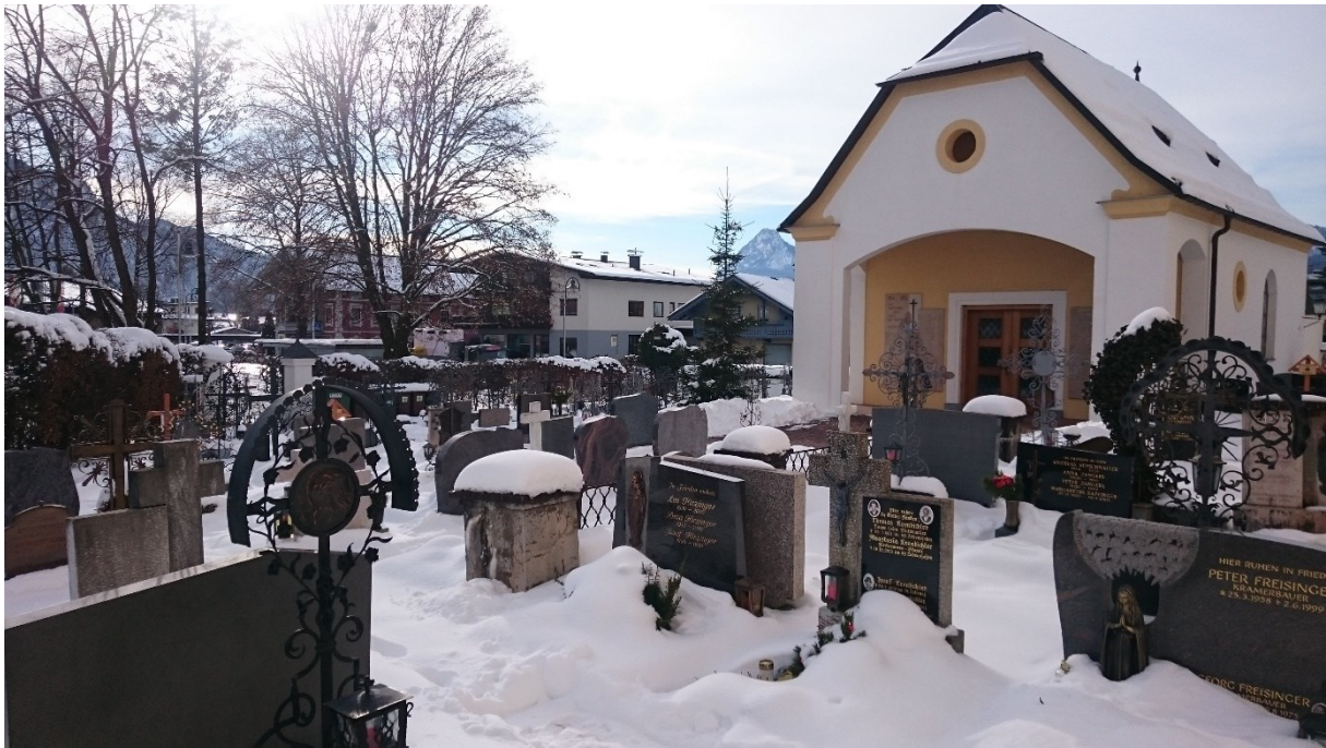
Neue Kapelle 2006