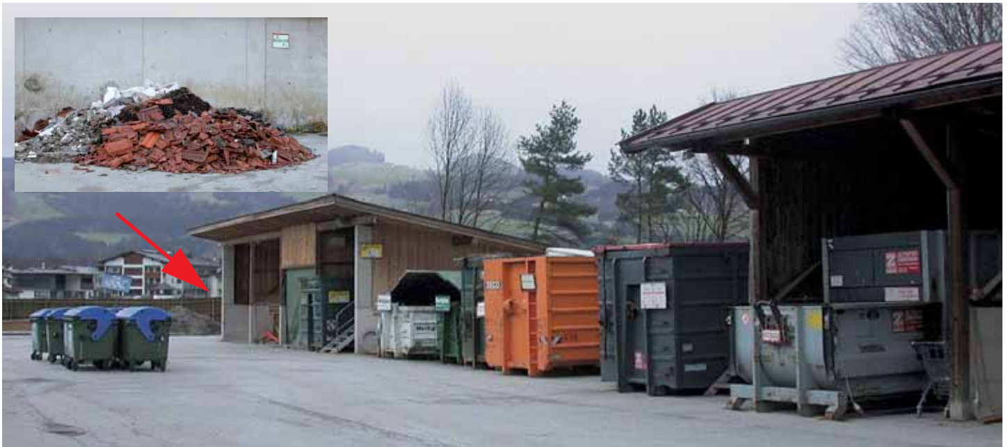
Die Sammelstelle für Bauschutt im Recyclinghof hinter den Lagerhallen auf der rechten Seite.