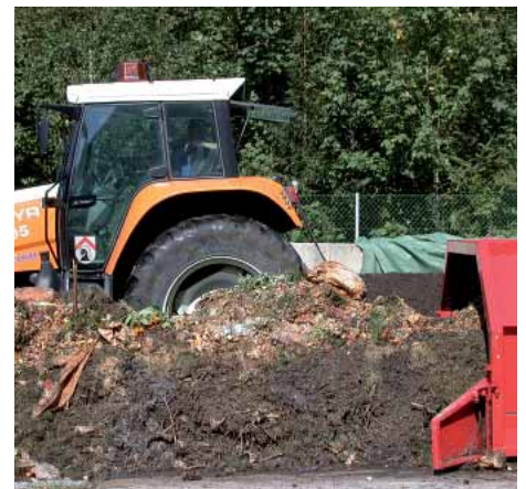
Der Gemeindebauhof beim Wenden des Biomülls, eine notwendige Arbeit für die Herstellung unserer Komposterde.

Eine kürzlich durchgeführte Analyse unserer Komposterde hat ergeben, dass diese qualitativ hochwertig ist und sich besonders für Park-, Garten- und Landschaftspflege eignet. Im Haus- und Gartenbereich wird die Verwertung in einem Mischverhältnis von 1/1 mit Humus empfohlen.