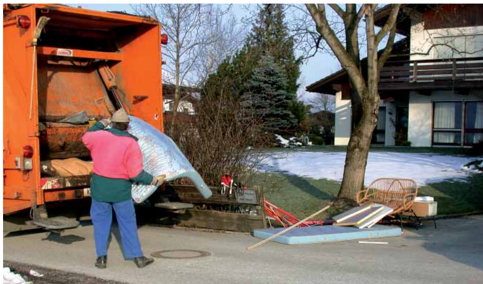
Ca. 310 m 3 Sperrmüll, Altholz und Kleinschrott wurden letztes Jahr vom Gemeindebauhof gesammelt und entsorgt.

Tip: Alles, was bei der Sperrmüllaktion entsorgt wird, wird vom Bauhof geschätzt und verrechnet. Elektroaltgeräte, Bildschirme und Kühlschränke können jedoch jederzeit während der Öffnungszeiten im Recyclinghof kostenlos abgegeben werden.