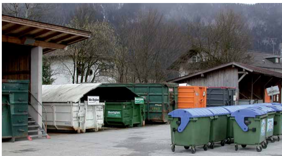
Der Recyclinghof der Gemeinde Ebbs.

Aufgrund der Montag-Feiertage (Ostermontag, Pfingstmontag) ist der Recyclinghof am Dienstag, 25. März 2008 von 13 – 18 Uhr und am Dienstag, den 13. Mai 2008 von 13 – 18 Uhr geöffnet.