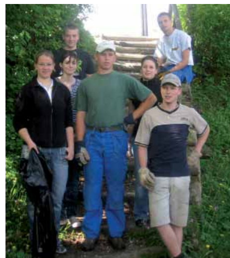
Die freiwilligen Helfer der Landjugend Ebbs im Einsatz bei der Dorfputzaktion 2007.

Im Vorjahr wurden unsere Bäche, Wiesen und Wälder von insgesamt 540 kg Müll befreit.