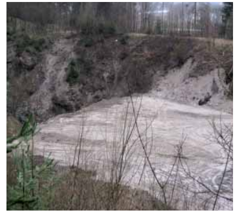
Auf der Deponie Schanzer Lahn darf Bodenaushub, Bauschutt und Betonabbruch deponiert werden.