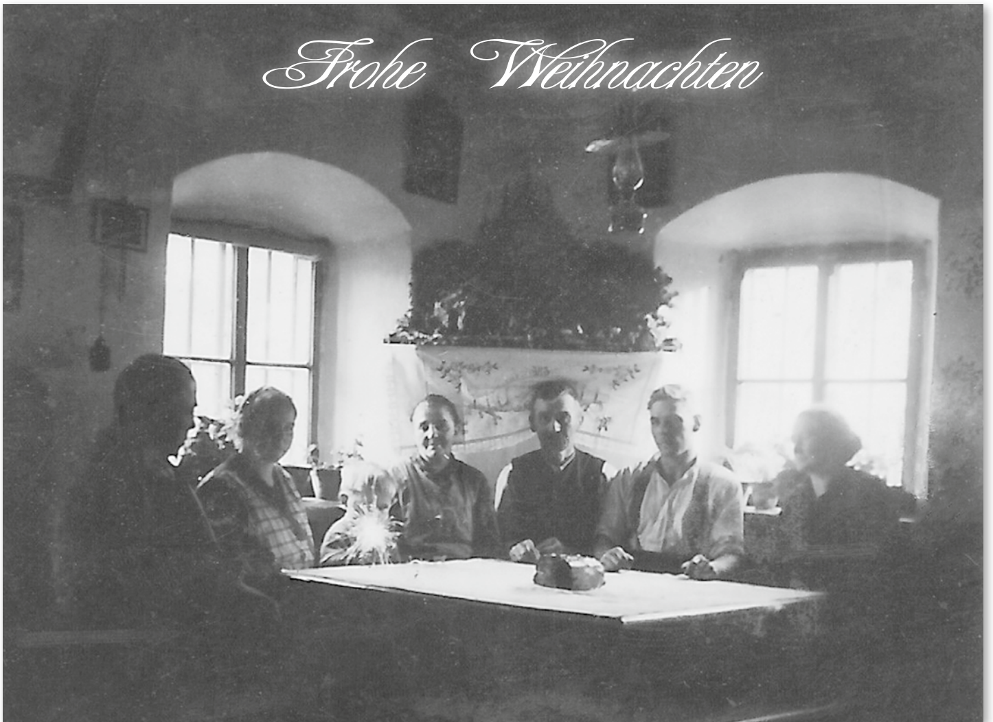
Weihnacht in Oberbuchberg beim Stadler nach dem 2. Weltkrieg.