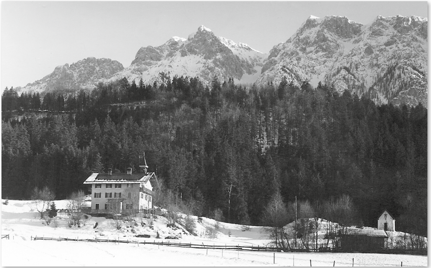
Buchberger Schule um 1955

Die einklassige Volksschule Buchberg bestand von 1929 bis 1984. Das Gebäude wurde 1986 abgetragen.