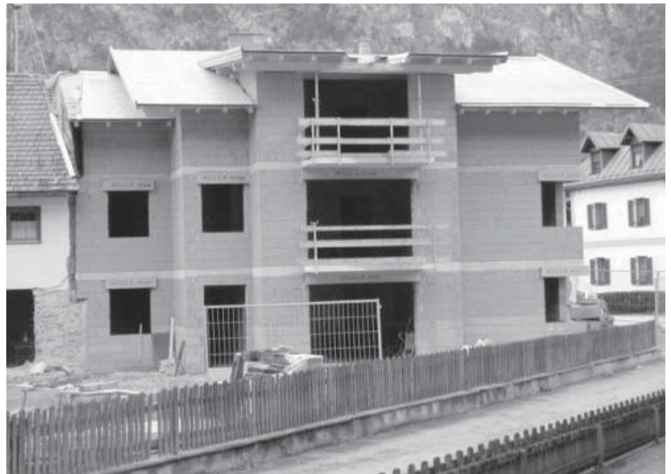
Abfalltrennung am Bau spart Kosten und schont die Umwelt.

Verpackungsabfälle wie Schachteln, Kunststofffolien, Styropor und dgl. können sauber getrennt kostenlos im Recyclinghof während der Öffnungszeiten abgegeben werden. Problemstoffe wie Lackdosen mit Restinhalten, Gebinde mit Farben, etc. können ebenfalls kostenlos im Recyclinghof abgegeben werden.