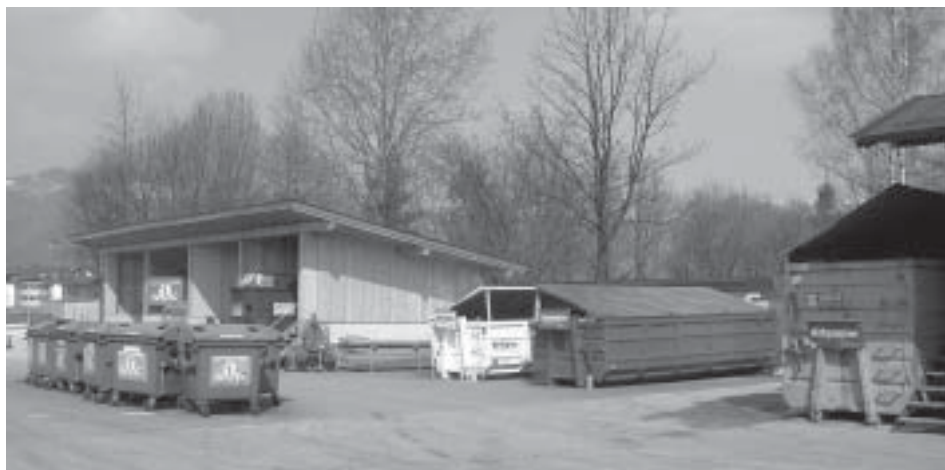
Der Recyclinghof der Gemeinde Ebbs.

Am Montag, den 18. Oktober 2004 ist der Recyclinghof aufgrund der Altkleidersammlung ganztägig von 7.00 bis 12.00 Uhr und von 13.00 bis 17.00 Uhr zur Abgabe Ihrer Wert- und Problemstoffe geöffnet.