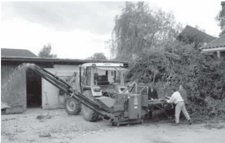
Der Gemeindebauhof beim Häckseln von Baum- und Strauchschnitt.

Zusätzlich ist der Gemeinderecyclinghof an jedem Montag von 13.00-17.00 Uhr und Freitag von 7.00-