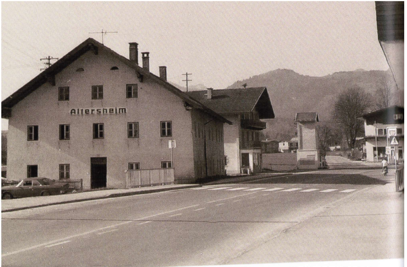
Das Altersheim Ebbs, oder auch Spital genannt, war bis 1974 im Theaterweg untergebracht. Ca. 17 bis zwanzig Bewohner, vorrangig „Gemeindearme“, haben hier ihren Lebensabend verbracht.