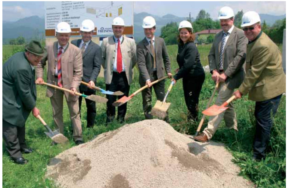
Der Spatenstich zum Baubeginn erfolgte am 4. Juni 2007 ...

Durch den Betrieb dieser zentralen Wärmeversorgungsanlage und die Umstellung der Kundenheizanlagen von fossiler Energie (größtenteils Heizöl) auf Energie aus regionaler Biomasse kann ein effizienter Heizbetrieb in Ebbs aufgenommen werden. Auch der Hausbrand wird durch den Wegfall der eigenen Wärmeerzeugungsanlagen samt Kaminanlagen eingedämmt und somit kann die Luft- und Lebensqualität für die