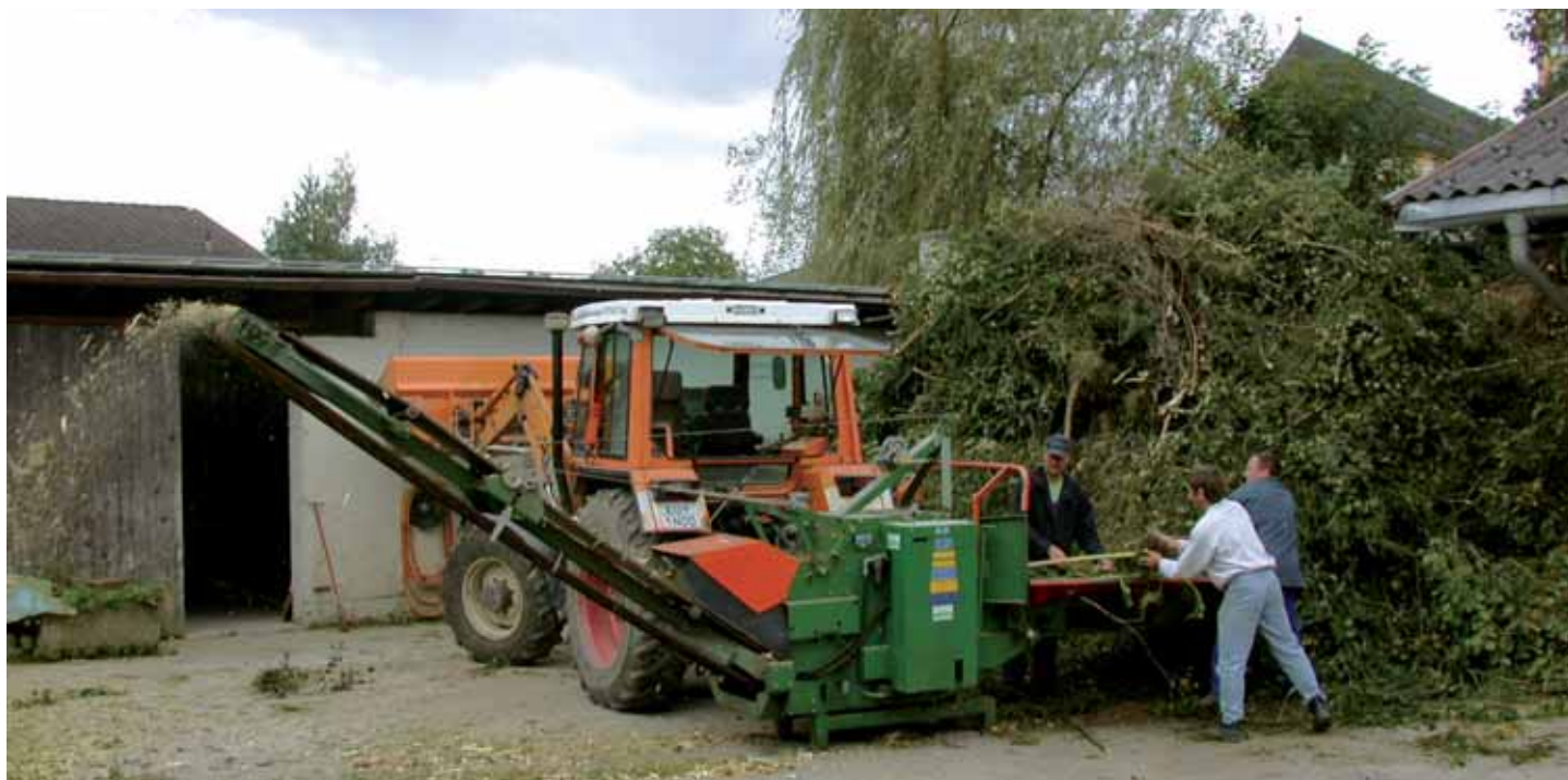
Der Gemeindebauhof beim Häckseln von Baum- und Strauchschnitt.

Ebbs-Dorf, Sammelstelle beim Recyclinghof