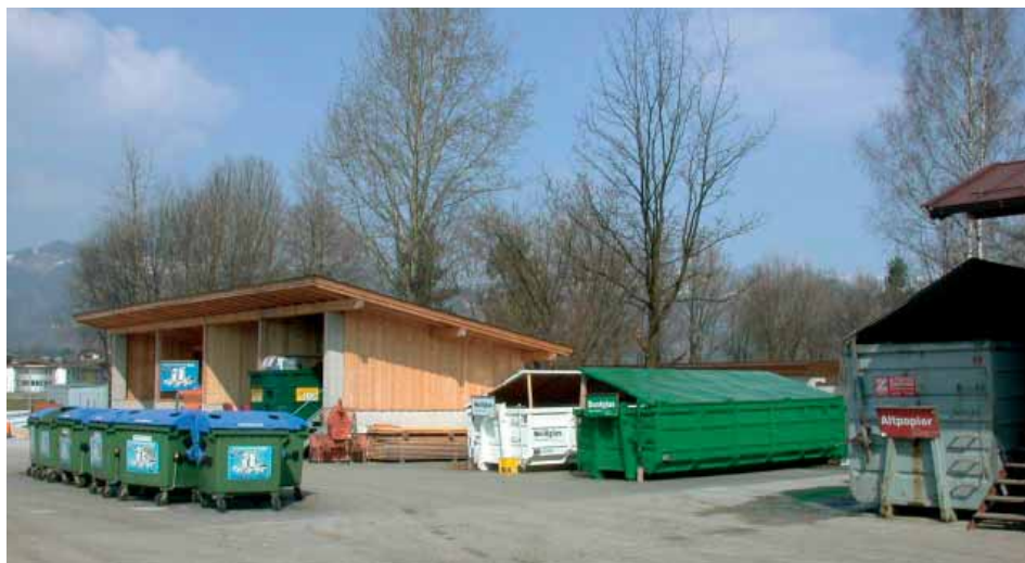
Der Recyclinghof der Gemeinde Ebbs.

Ab dem 29. Oktober 2007 sind die Öffnungszeiten an den Montagen aufgrund der Umstellung auf die Winterzeit jeweils von 13.00 bis 17.00 Uhr .