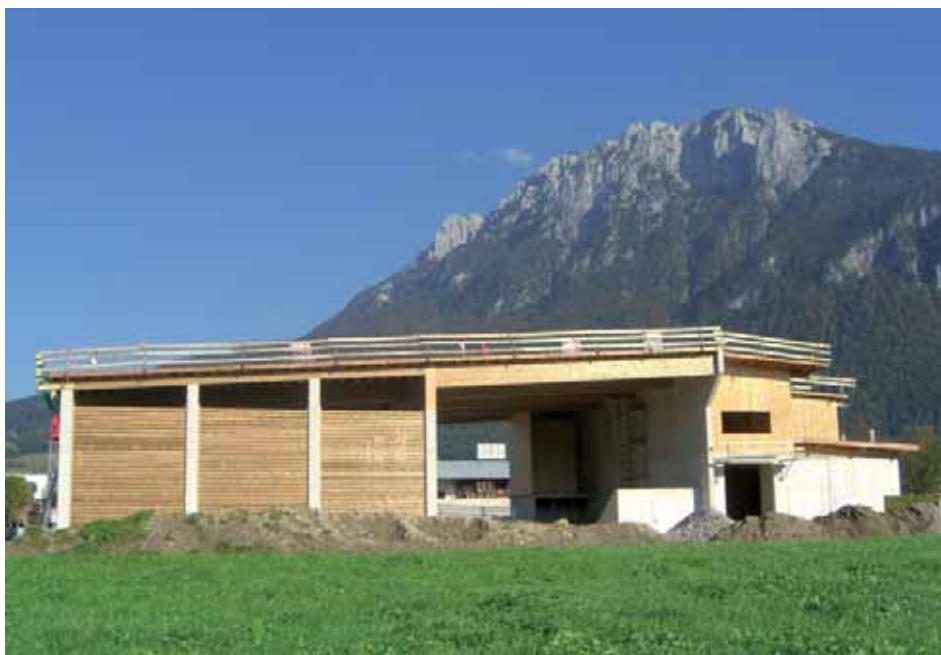
... Baufortschritt der Anlage Ende September 2007.

Ab Inbetriebnahme des Heizwerkes können in Ebbs jährlich rund 1.000 Tonnen Heizöl bzw. rund 2.000 Tonnen CO 2 – Kohlendioxid eingespart werden und somit leistet die Gemeinde Ebbs einen entscheidenden Beitrag zum aktiven Klimaschutz sowie zur nachhaltigen Schonung unserer Umwelt.