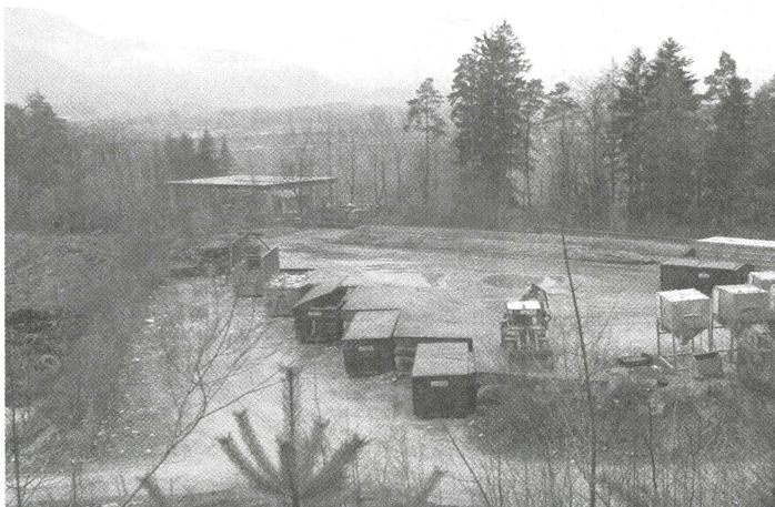
Annahmestelle für Sperrmüll und Altholz - die Umladestation Schanzer Lahn!

sowohl unbehandeltes als auch behandeltes Holz angenommen. Das Material darf jedoch nicht behaftet sein mit Steinen, Ziegel, Beton, Textilien, Papier, Pappe, Glas, Spiegel, Kunststoff, Dämmstoff, Dachpappe, Bitumenreste, Kabel, Metalle größer als 20 mm Durchmesser, Stahlbänder und Drähte länger als 200 mm.