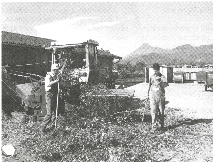
Gemeindebauhof beim Häckseln von Baum- und Strauchschnitt.

Bitte bringen Sie Ihr Häckselgut - ohne Steine und Wurzeln - zu den angegebenen Zeiten zu nachfolgenden Sammelstellen, welche der Bauhof kostenlos anfährt: