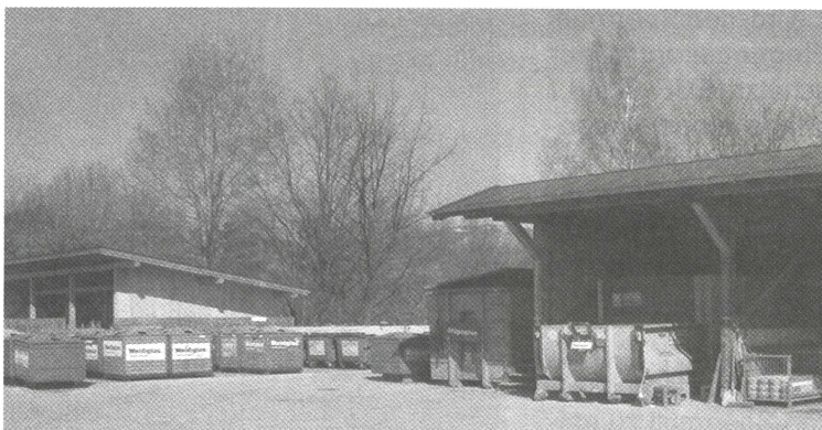
Der Recyclinghof der Gemeinde Ebbs.

falls kostenlos sämtliche Problemstoffe wie Altöl, Farben und Lacke, Säuren, Laugen, Lösemittel, Haushaltsreiniger, Batterien, Druckgaspackungen, Medikamente und Körperpflegemittel, Leuchtstoffröhren, Elektronikschrott, Pflanzen- und Holzschutzmittel, abgeben. Gegen Kostenersatz werden auch Bildschirme und Fernsehgeräte (EUR 10,90 / Stk.) und Kühlschränke (EUR 32,70 / Stk.) übernommen.