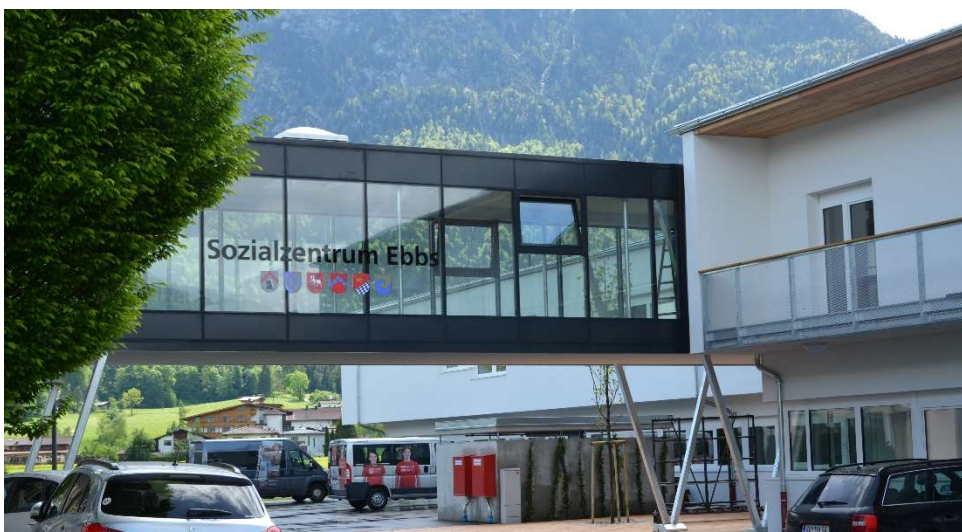
Das Sozialzentrum ist mit einer Brücke mit dem bestehenden Wohn- und Pflegeheim verbunden

Das neu errichtete Sozialzentrum (2014 errichtet) neben dem Wohn- und Pflegeheim Ebbs, seit 1974 im Roßbachweg. Im Sozialzentrum ist im 1. Stock eine Pflegestation mit 15 Plätzen in großzügigen Einzelzimmern (mit eigenem Badezimmer: Dusche, WC und Waschbecken) untergebracht. 2021 werden dort weitere 14 Heimplätze geschaffen, sodass eine Stationsgröße von 29 Betten und damit eine wirtschaftliche Betriebsgröße gegeben sein wird. Im Parterre sind Betreute Wohnungen, der Sozial- und Gesundheitssprengel Untere Schranne (ambulanter Dienst mit deckungsgleichem Einzugsgebiet wie das Heim) mit ihren Büroräumlichkeiten und der Tagespflege sowie eine Hausarztpraxis untergebracht.