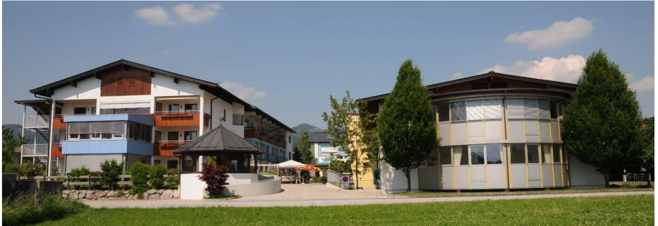
Links der 1974 errichtete Neubau mit Erweiterung im Jahre 1992, rechts der Erweiterungszubau aus 2000.