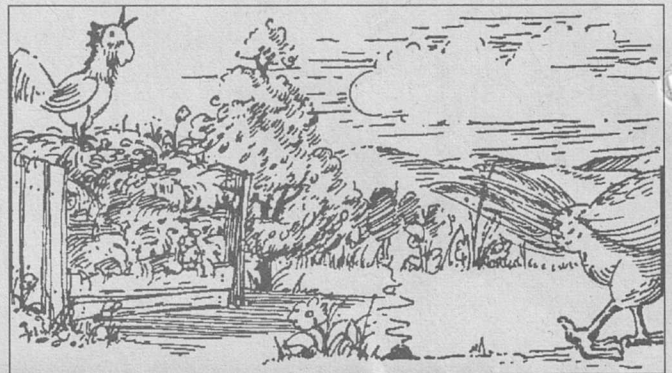
Kompostieren - die Natur erzeugt keinen Abfall

Plastik und Gummi Metalle, Textilien Glas, Keramik, Steine grobes Holz Koks- und Kohlenasche