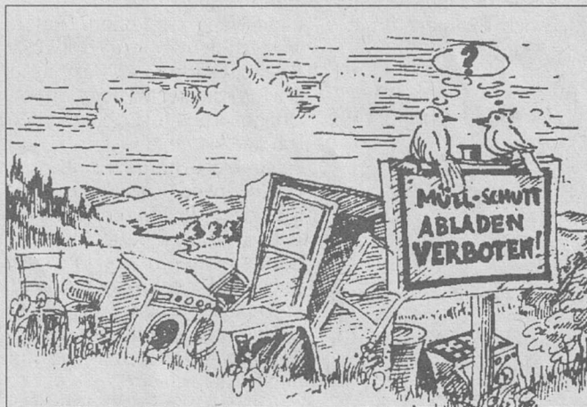
Haltet die Umwelt rein

Es wird ausdrücklich darauf hingewiesen, daß jede Müllentsorgung nur über die öffentliche Müllabfuhr erfolgen darf.