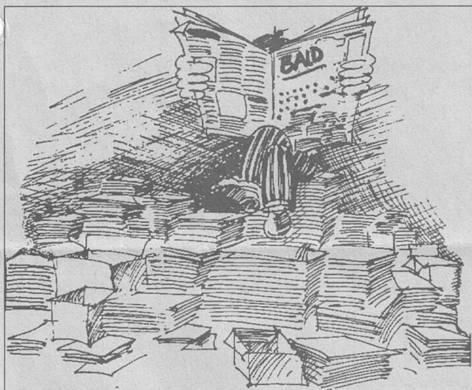
Altpapierhaussammlung 2 x jährlich