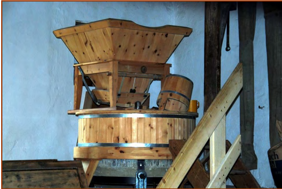
Teilansicht eines Mahlwerkes in „Mair`s Mühle“.