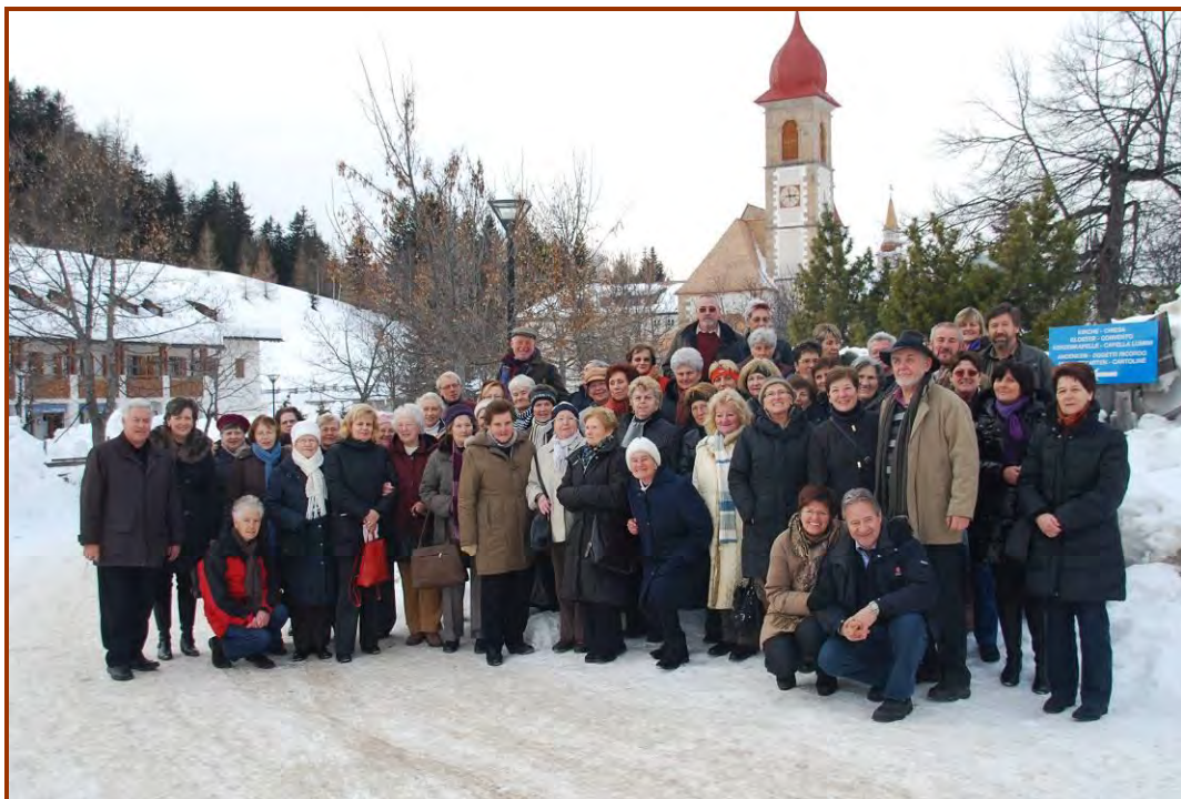
Die Ausflugsgruppe des Tanzkreises Telfs, Oberhofen und Flaurling in Weißenstein.

Der Tanzkreis Flaurling feierte sein fünfjähriges Bestehen (in Oberhofen 10 Jahre, in Telfs 15 Jahre) mit einem Gemeinschaftsausflug nach Maria Weißenstein und weiter in das Krippendorf Tesero.