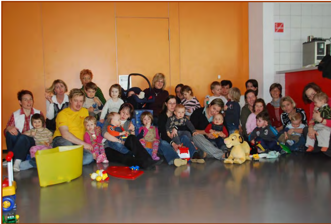
Gruppenbild vom MUKI-Treff am 30 März

MUKI – Treff im Gemeindezentrum, der Osterhase wurde gesucht.