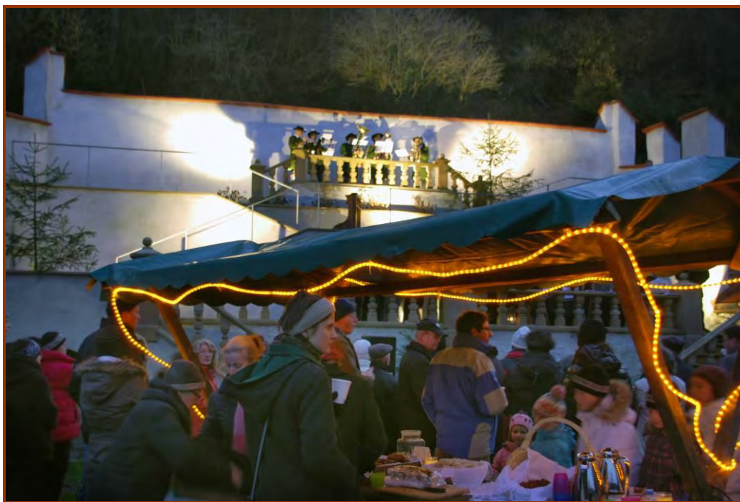
Stimmungsbild vom Adventabend im Risgarten

Auf der Internetseite des Kulturverein ist zu lesen: Unter der Regie von Engelbert Kaneider erlebten die Zuschauer und Zuhörer eine Veranstaltung die weit ab des üblichen Weihnachtsrummels angesiedelt war. Zurück zu den Wurzeln des Adventgedankens war die Devise. Die Veranstaltung wurde von der Flauringer Bevölkerung hervorragend angenommen und zeigte einmal mehr, dass der Gedanke einer besinnlichen Weihnacht durchaus Platz in einer modernen und hektischen Zeit hat, ja vielen Bürgern ein Bedürfnis ist.