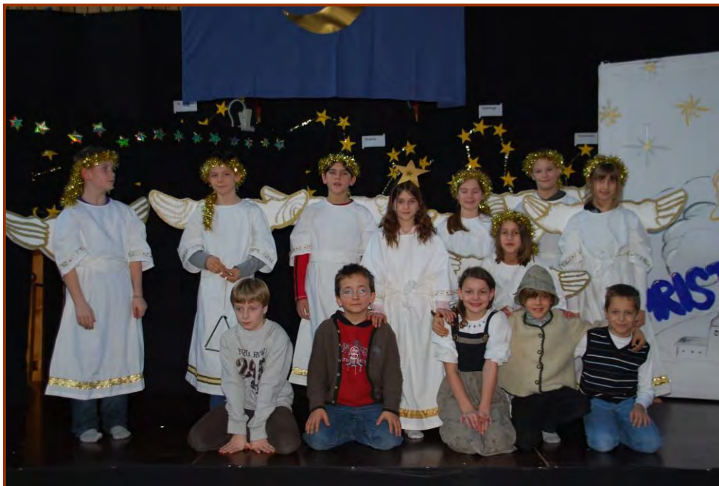
Die Darsteller von „Christkindl`s Erdenreise“