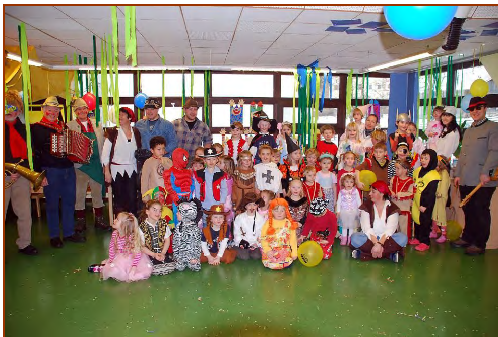
Der Faschingsdienstag im Kindergarten.

Faschingsdienstag - Vormittag wird in der Schule und im Kindergarten noch einmal ordentlich gefeiert, am Nachmittag gastiert die Theatergruppe „StromBomBoli“ aus Hall beim bunten Familienfasching im Gemeindezentrum.