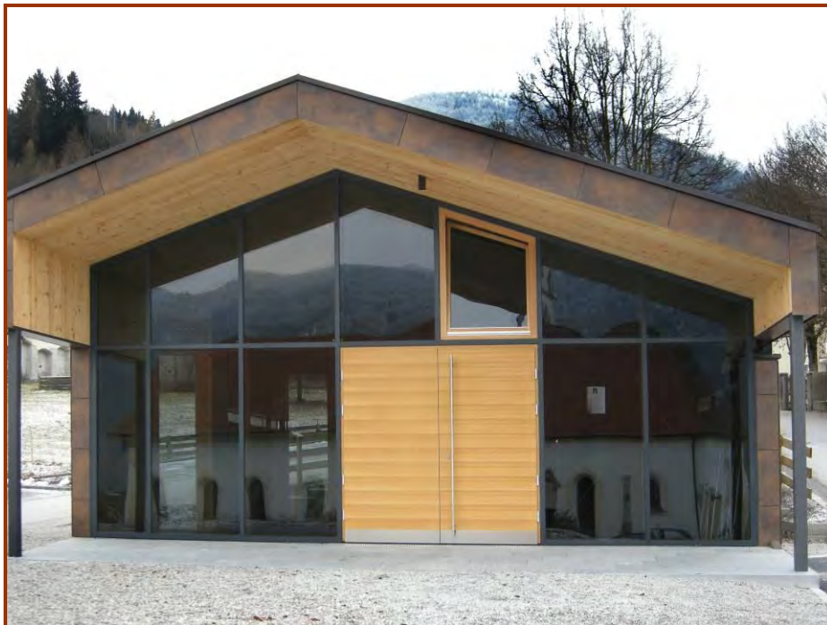
Die neue Aufbahrungskapelle

Ende November ist nun die neue Aufbahrungskapelle nahezu fertig und präsentiert sich als ein sehr attraktiver Bau. Dem Architekten ist es gelungen, mit modernen Materialien ein Bauwerk zu schaffen, dass trotz seiner Schlichtheit mit spannungsgeladenen baulichen Elementen beeindruckt, so sieht es jedenfalls der Chronisten.