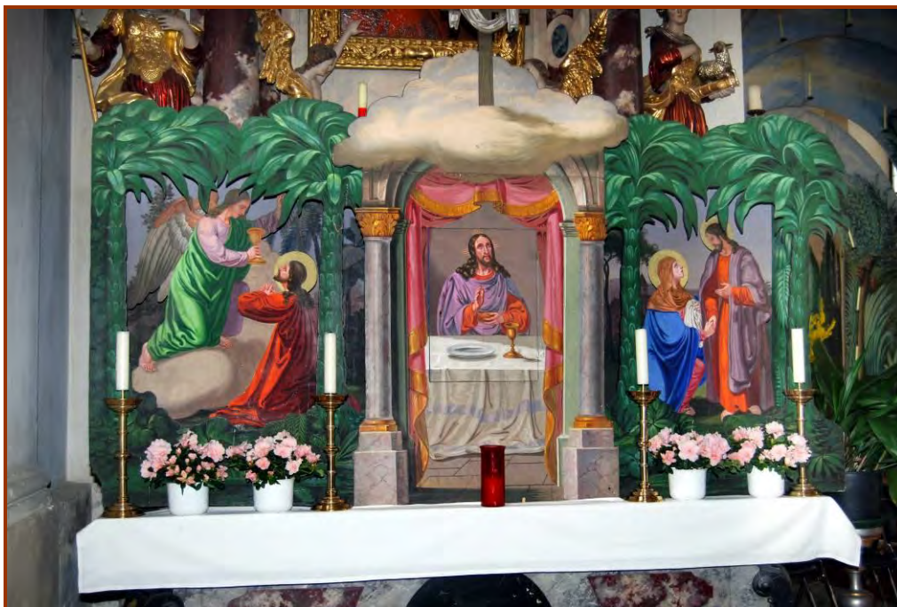
Zum Flauringer Ostergrab gehört auch der Seitenaltarteil mit dem Tabernakelgehäuse

Palmsonntag – Am Vormittag die traditionelle Palmenweihe im Schulhof mit anschließender hl. Messe, am Nachmittag stellten die Mitglieder der Landjugend das Flauringer Ostergrab auf.