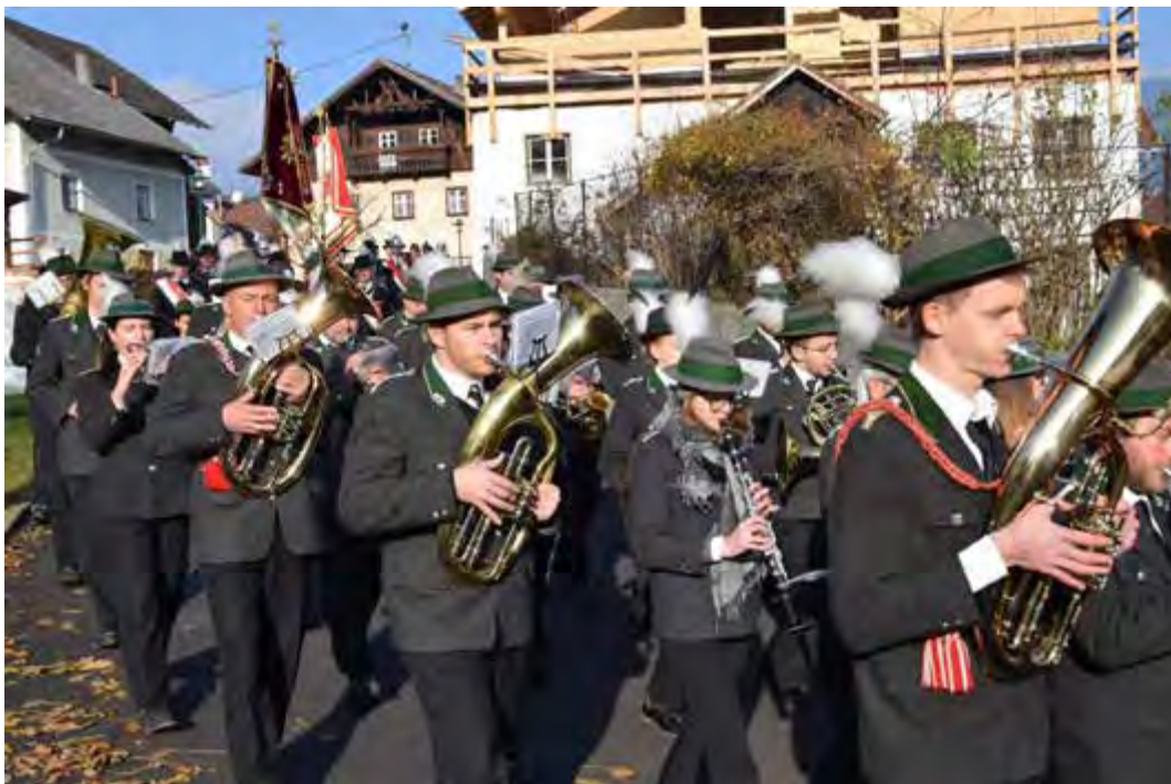
Abmarsch der Musikkapelle zur Jahreshauptversammlung beim Wirt