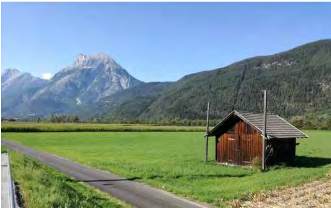
Herbststimmung in den Feldern am Inn