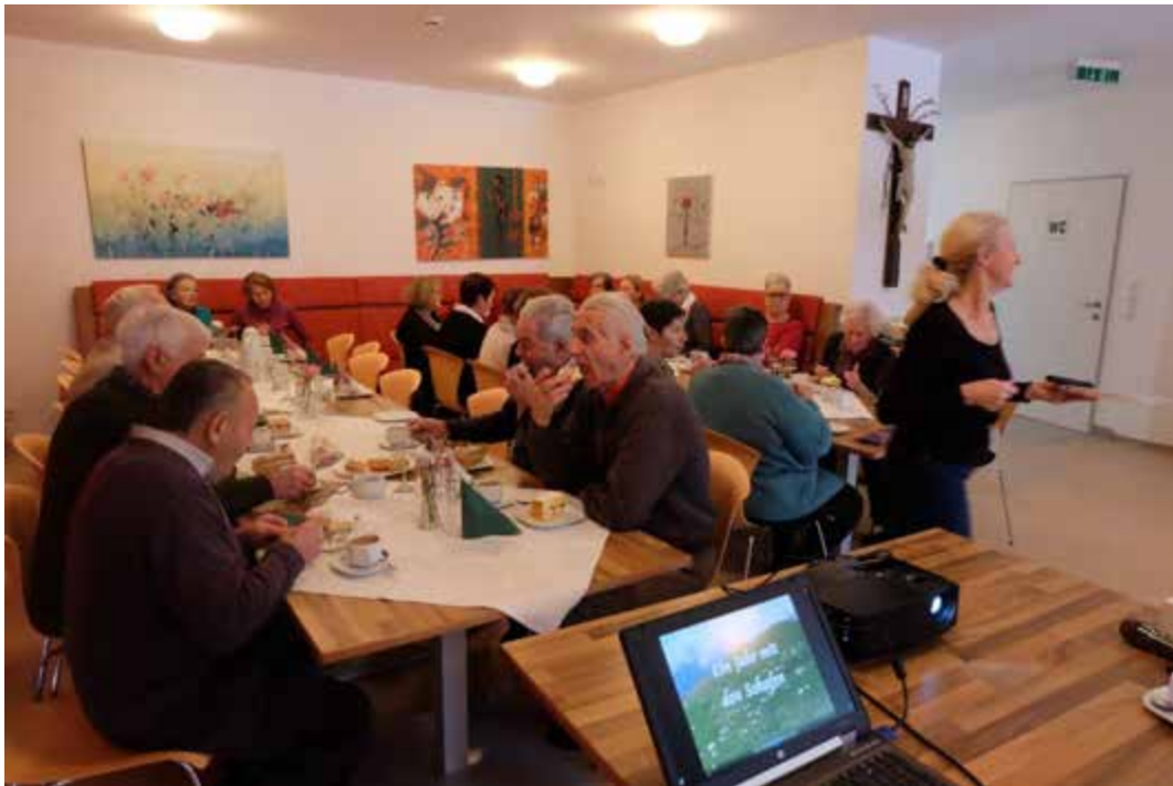
Nach Kaffee und Kuchen gab es Bilder aus der Chronik