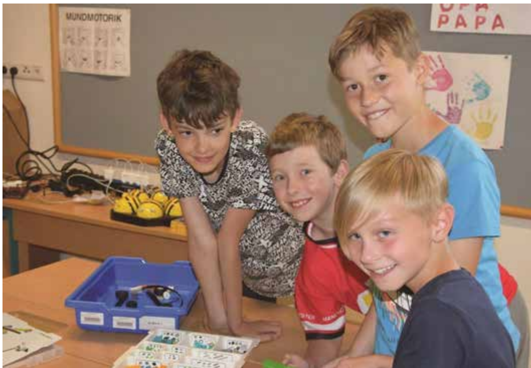
Techniktag in der Volksschule