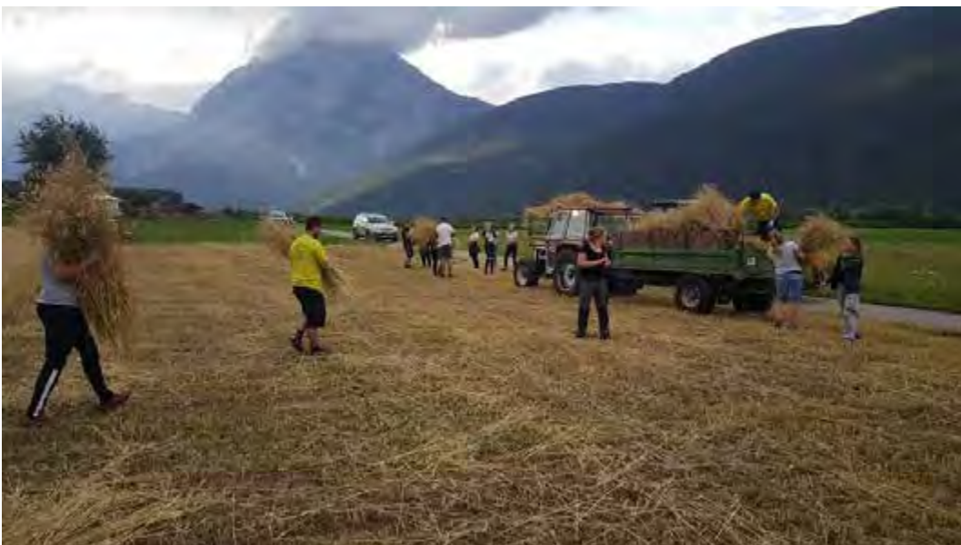
Einholen der Garben für die Erntedank-Krone