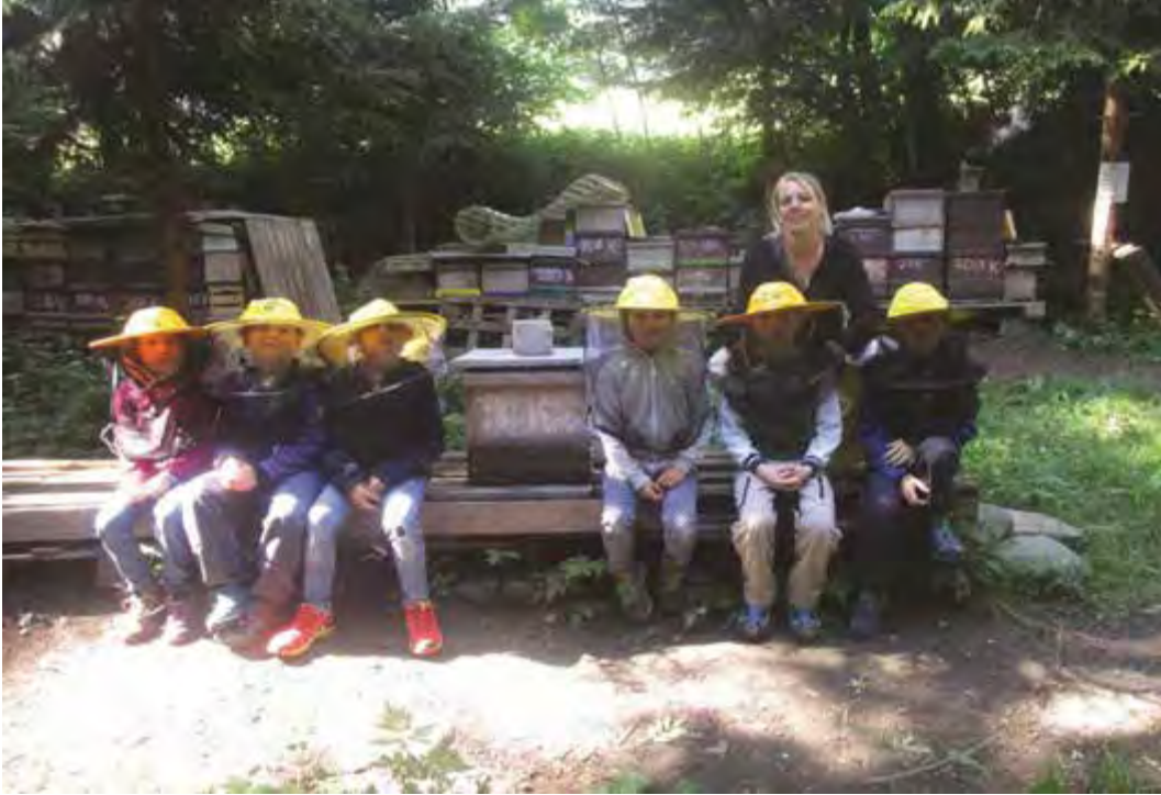
Alles über Bienen erfahren die VolksschülerInnen