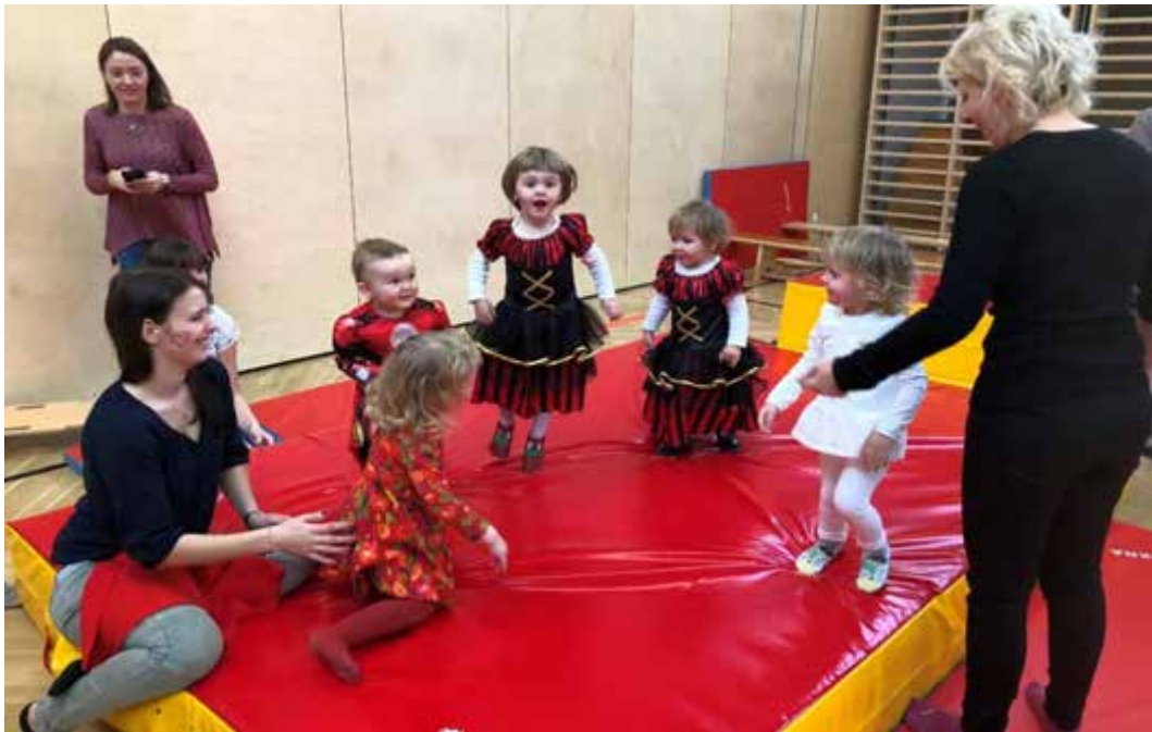
Viel Spaß hatten die verkleideten MUKI's im Turnsaal