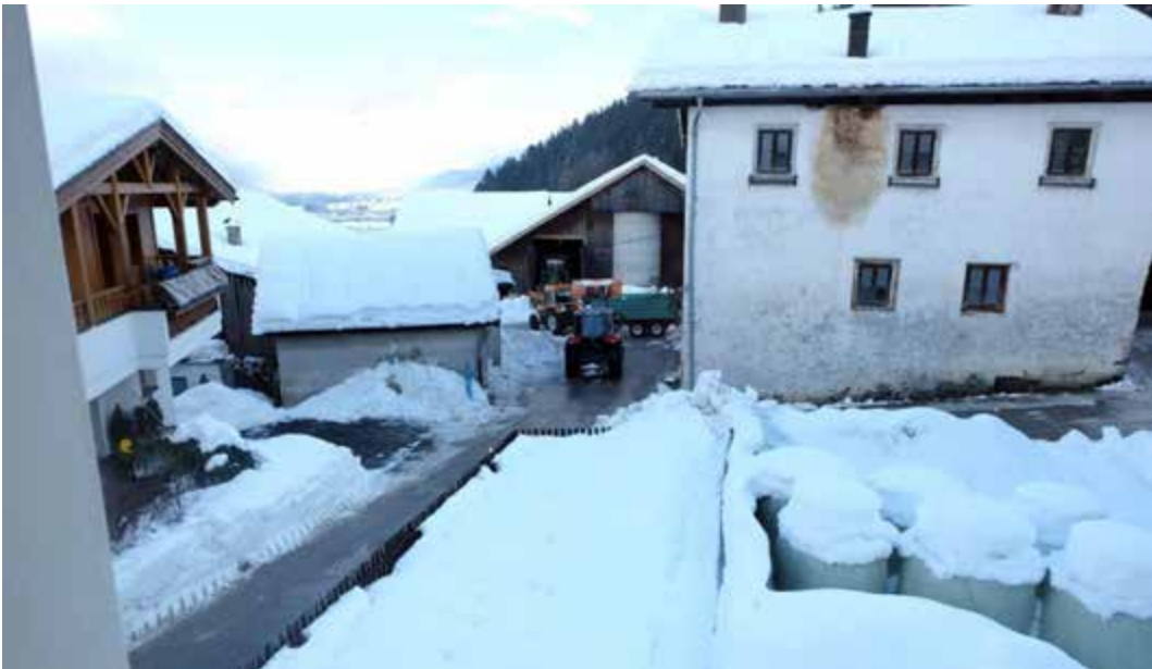
Schwere Schneefälle waren eine Herausforderung für Mensch und Maschine