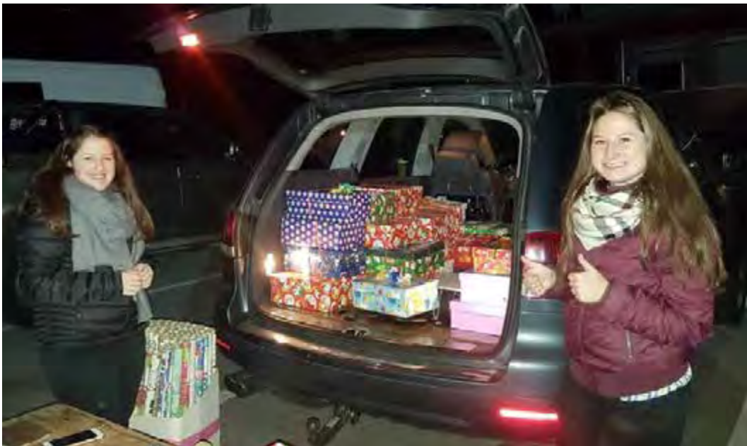
Weihnachten im Schuhkarton

Im November gab es noch von der Landjugend: