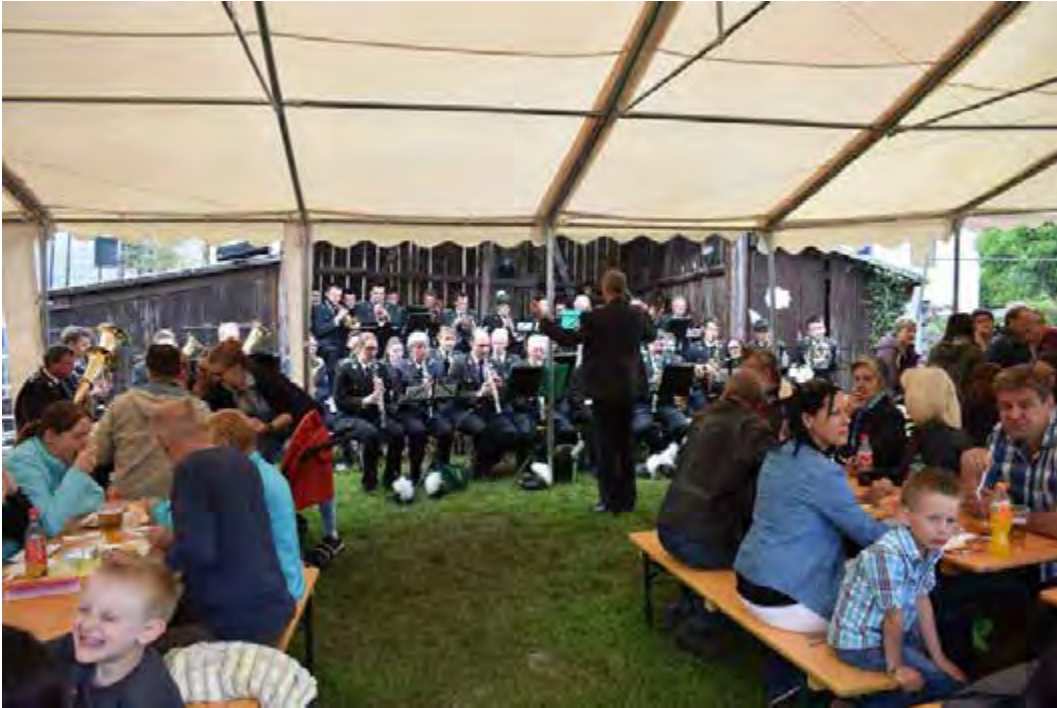
Die Musik spielt beim Maibaumkraxln auf