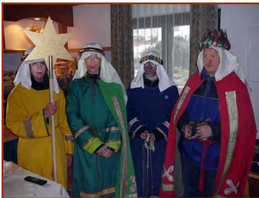
Eine Gruppe der Sternsinger zu Besuch beim Chronisten