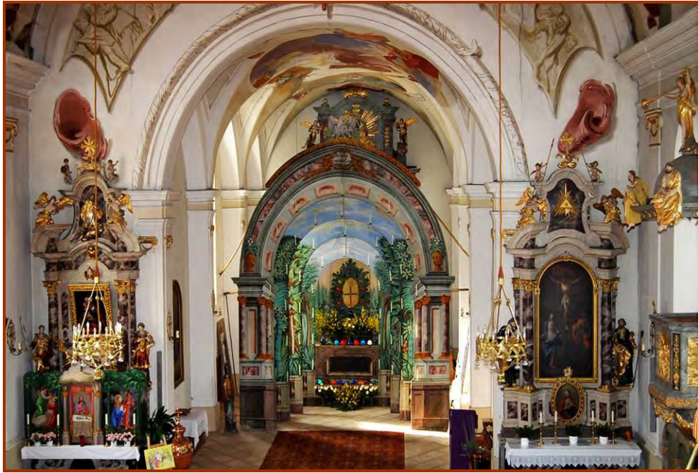
Das Ostergrab in der Pfarrkirche Flurling