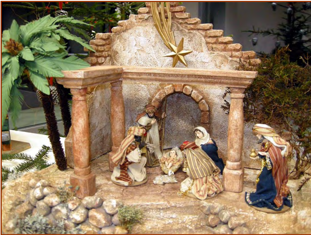
Zwei der von den Teilnehmern des Krippenbaukurses gebauten Weihnachtskrippen

14. Dezember 2008 Adventsingens der Chorgemeinschaft Flaurling und Krippen Schau der im Krippenbaukurs geschaffenen Weihnachtskrippen.