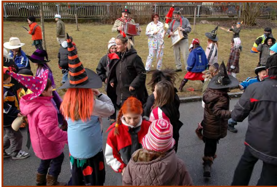
Lebhaftes Maskentreiben am Schulhof