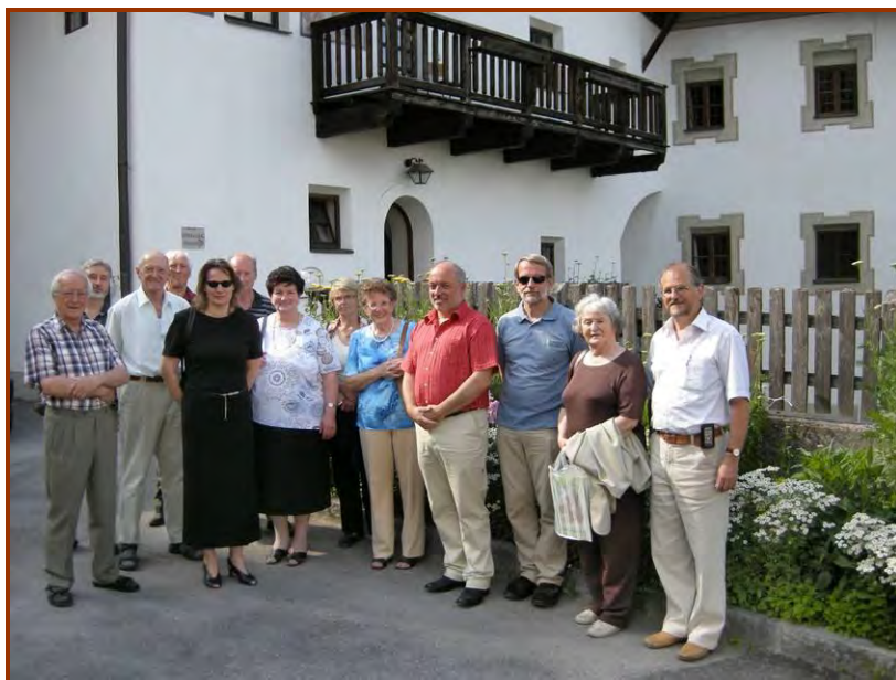
Beim Bezirkschronistentag wurde auch das „Mesnerhaus“ ein besichtigt.

Chronistentag in Flauring – Die Chronistinnen und Chronisten des Chronistenbezirkes Innsbruck – West trafen sich heuer in Flauring (Saal „Schönblick“ im neuen Seniorenheim) zum Bezirkschronistentag 2008