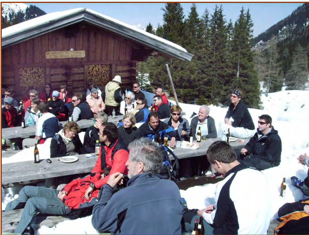
Die Flauringer Alm – Austragungsort des Almbiathlon