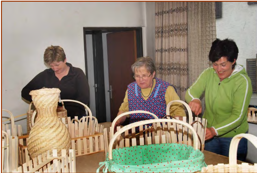
Die fleißigen Korbflechterinnen bei der Arbeit

Das Kursangebot „Korbflechten“ der Erwachsenenschule nützten einige Frauen, um sich im uralten Handwerk des Korbflechtens zu betätigen. Unter Anleitung einer professionelle Korbflechterin wurde die verschiedensten Körbe angefertigt.