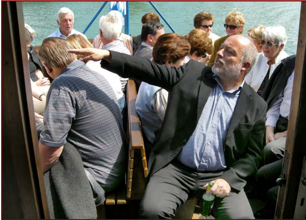
Bei der Bootsfahrt über den Kochelsee gab es auch einiges zu erklären