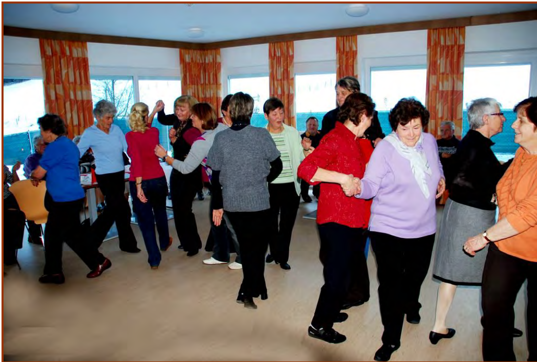
Tanzen ist Lebensfreude und erhält jung

Seniorenachmittag im Saal „Schönblick“ – Ein geselliger Nachmittag mit Vorführungen der Tanzgruppe des VIT Klubs Flaurling.