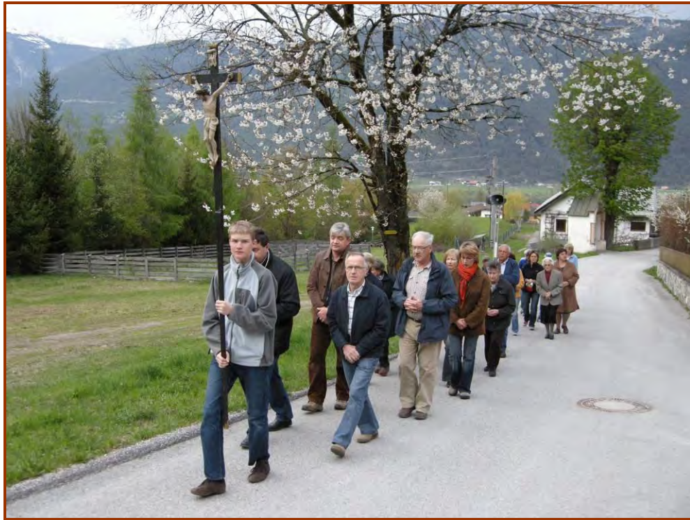
Der kleine Trupp der Bittgänger auf dem Weg zur Ländkapelle.