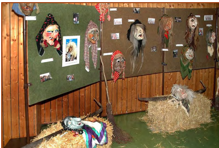
Eine Auswahl der Flaurlinger Hexenmasken