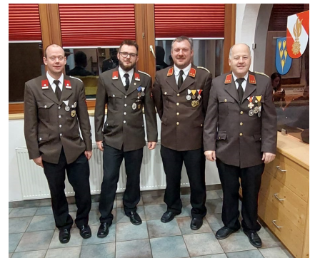
Die Leitung der Feuerwehr Flirsch

Wichtige Information: Alle größeren Feuer (etwa beim Wiesenräumen, Lawinenholz verbrennen, Almen räumen etc.) im öffentlichen Raum sind meldepflichtig. Die Meldung muss früh genug beim Bürgermeister oder beim Feuerwehrkommandat er-