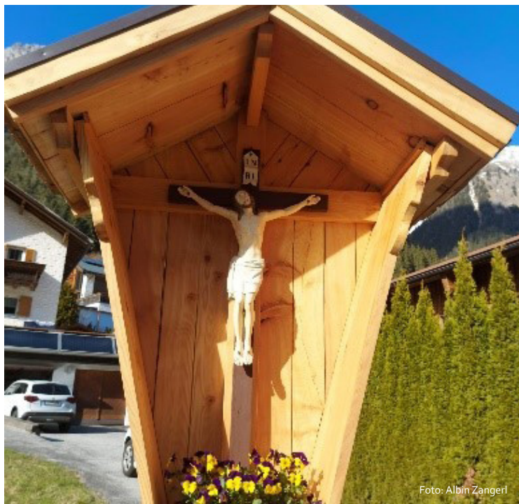
Das „Kreizli“ an der Dorfstraße westlich der Kirche

Die nächsten beiden Vorhaben betreffen die Wiedererrichtung des alten Friedhofskreuzes (um 1900 gab es sogar zwei). Der große Christuscorpus des ehemaligen Missionskreuzes ist nach Vorbild des Künstlers Andreas Thamasch errichtet worden, stammt aber nicht von diesem. Das Kreuz, das aktuell im Widum verwahrt wird, soll neuerlich auf