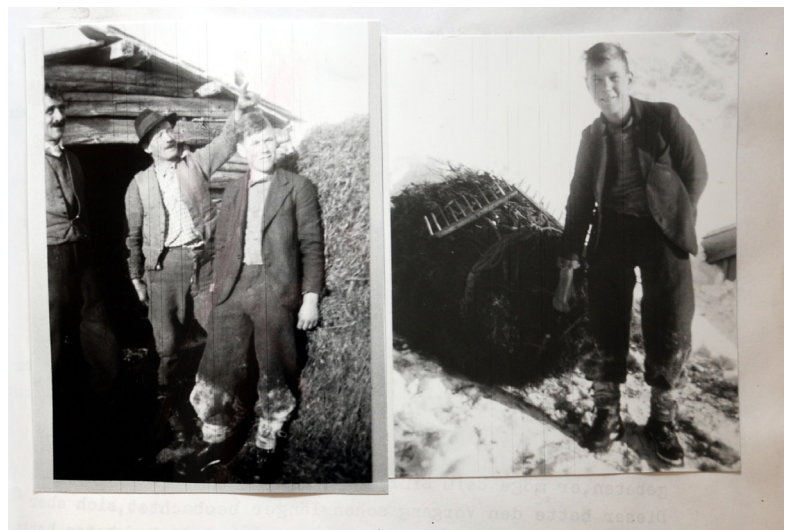
Heuzug über Flirsch