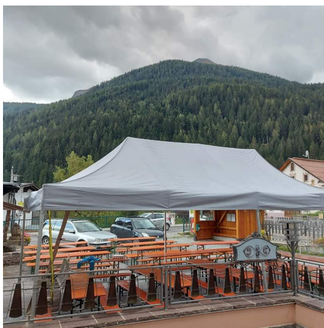
Dorfplatz beim Almbtrieb 2022

Auch beim Adventmarkt am 25. November werden die Jungbauern wieder mit dabei sein und Stände betreuen.