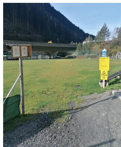
Am Fußballplatz ist es nicht gestattet Rad zu fahren und Hunde abzurichten.