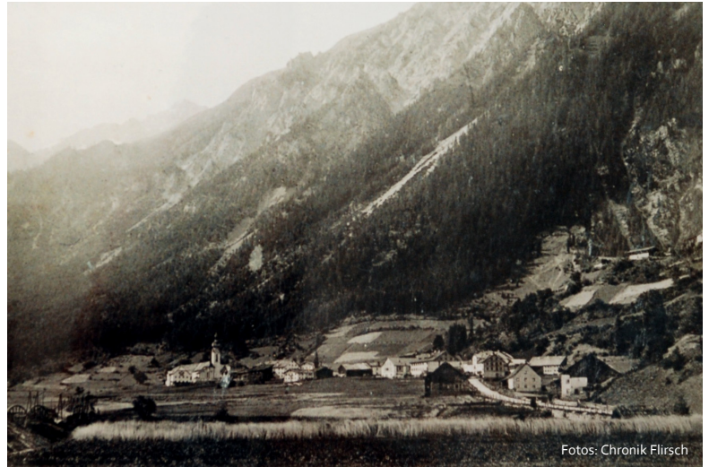
Ansicht von Flirsch um das Jahr 1900

In dieser Rubrik sollen – durch dankenswerte Mithilfe von Chronist Rudolf Juen – Fotoschätze aus der Vergangenheit unserer Gemeinde gezeigt werden. Auch früher wurden in Flirsch bereits zahlreiche Traditionen gepflegt, die sich noch heute im Ortsbild wiederfinden.