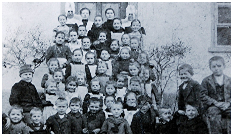
Schülergruppe aus dem Jahr 1912