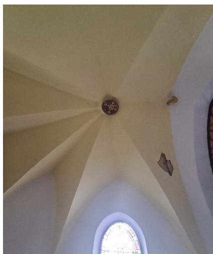
Versteckte Kunstwerke hinter dem Verputz in der Lourdeskapelle