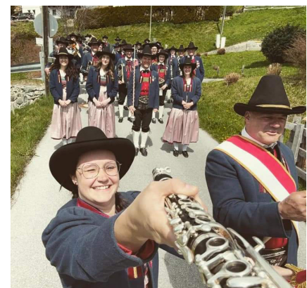
Ein etwas anderes Selfie