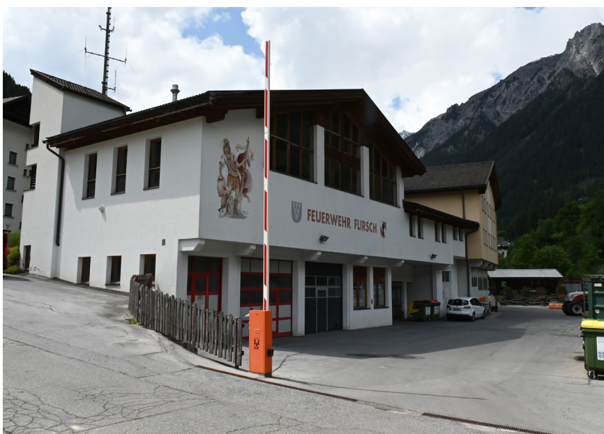
Am Bauhof wird investiert.

Darüber hinaus wolle man sich auch mehr dem Umweltschutz widmen. Daher soll beim Umbau der Volksschule auch Photovoltaik aufs Dach kommen.