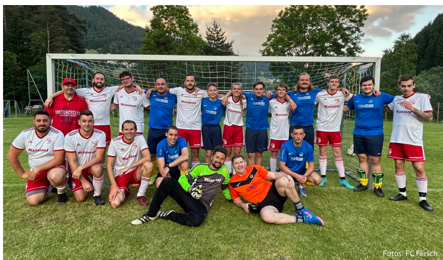
Ein gemeinsames Mannschaftsfoto vom FC Flirsch (blau) und den Red Eagles Austria (weiß) nach einem gut besuchten Freundschaftsspiel in Flirsch.

Wichtige Information: Da der Fußballclub Flirsch, vor allem der Platzwart, stets darum bemüht ist, einen gut zu bespielenden Sportplatz zur Verfügung zu stellen, soll auf diesem Wege nochmal darauf hingewiesen werden, dass das Radfahren und das Abrichten von Hunden am Sportplatz nicht erlaubt ist. Vielen Dank für das Verständnis.