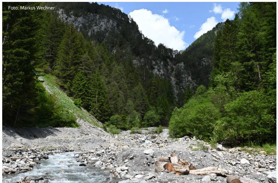
Am Griesbach soll ein Oberstufenkraftwerk entstehen.

Aktuell sei der Planer mit der Ausarbeitung der Fassung beschäftigt. Vielleicht werde laut Bürgermeister auf Herbst hin die Planung sowie die Einreichung fertig. Dann hoffe man auf Verhandlungen im nächsten Frühjahr. Insofern könnte man bereits im nächsten Jahr mit dem Bau beginnen. Eventuell komme es erst 2024 zur Bewilligung, dann könne 2025 – spätestens 2026 – mit dem Bau begonnen werden.