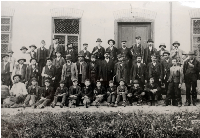
Ältestes Fabrikfoto, wahrscheinlich um 1905