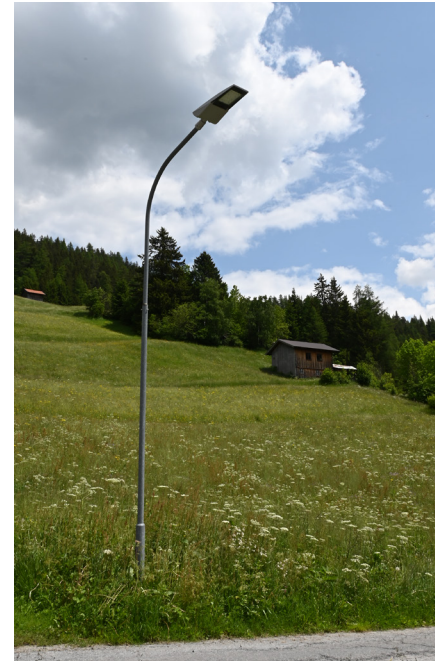
Umstellung auf LED

Hierzu soll das obere Geschoss, wo sich derzeit Wohnungen befinden, umgebaut werden. Geplant sind zwei Gruppen. All dies soll noch in diesem Jahr geplant werden, damit man nächstes Jahr mit dem Bau beginnen könne. „Es werden immer mehr Kinder im Kindergarten. Derzeit wird dort schon eine Ganztagesbetreuung angeboten“, erklärt Roland