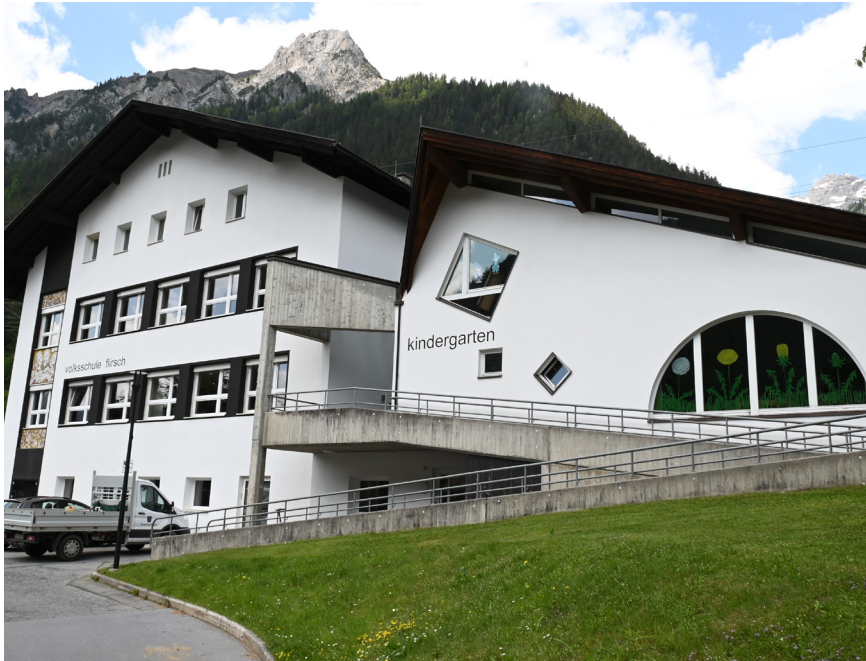
In der Volksschule ist eine Kleinkindbetreuung angedacht.

Darüber hinaus wolle man auf lange Sicht auch die Kleinkindbetreuung in Flirsch weiter ausbauen. Derzeit wird dies für Kinder ab drei Jahren angeboten. Die Kleinkindbetreuung sei derzeit nach Pians ausgelagert. Hier möchte sich die Gemeinde mit Strengen und Pettneu zusammentun und eine derartige Einrichtung in der Flirscher Volksschule realisieren.