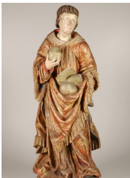
Statue des Hl. Stephanus