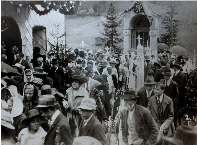
Einweihung des Kriegerdenkmales 1923