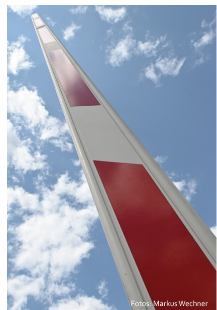
Diese Schranke soll ersetzt werden.