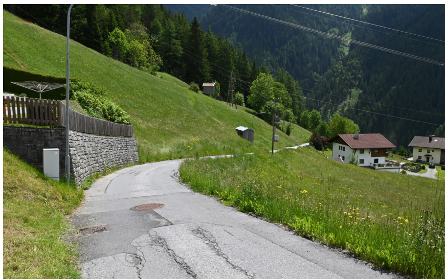
Hier, zwischen Permen und Wolfen, soll die Straße verbreitert werden.

Im Zuge einer Gemeinderatssitzung konnte die Bauvergabe für den LWL-Ausbau beschlossen werden. Die Gemeinde Flirsch hat hierfür ein Angebot für die planerische Begleitung vom LWL-Competence-Center eingeholt. Dieses beläuft sich auf netto € 50.327,31. Wie bereits geschildert, soll im August der LWL-Ausbau am Flirscher Berg vorangetrieben werden. Die Vergabe der Grabungsarbeiten für die LWL-Neuverlegung hat der Gemeinderat einstimmig abgesegnet. Somit erhält den Auftrag die Firma Fröschl AG & Co KG für € 126.356,64 netto.