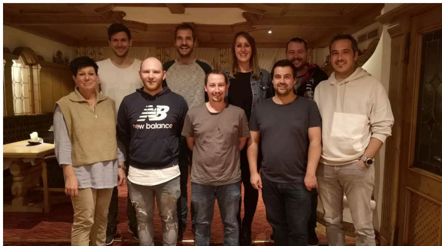
Die neuen und ehemaligen Funktionäre des Fanclubs mit Ski-Star Michael Matt