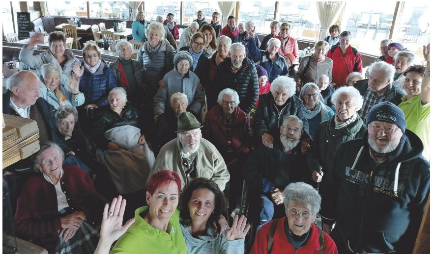
Der letzte Ausflug des Pflegeheimes St. Johann / Oberndorf führte nach Ellmau auf den Hartkaiser.

Bahnfahrt und dem Team von der Bergkaiser Lodge für die freundliche Bedienung!