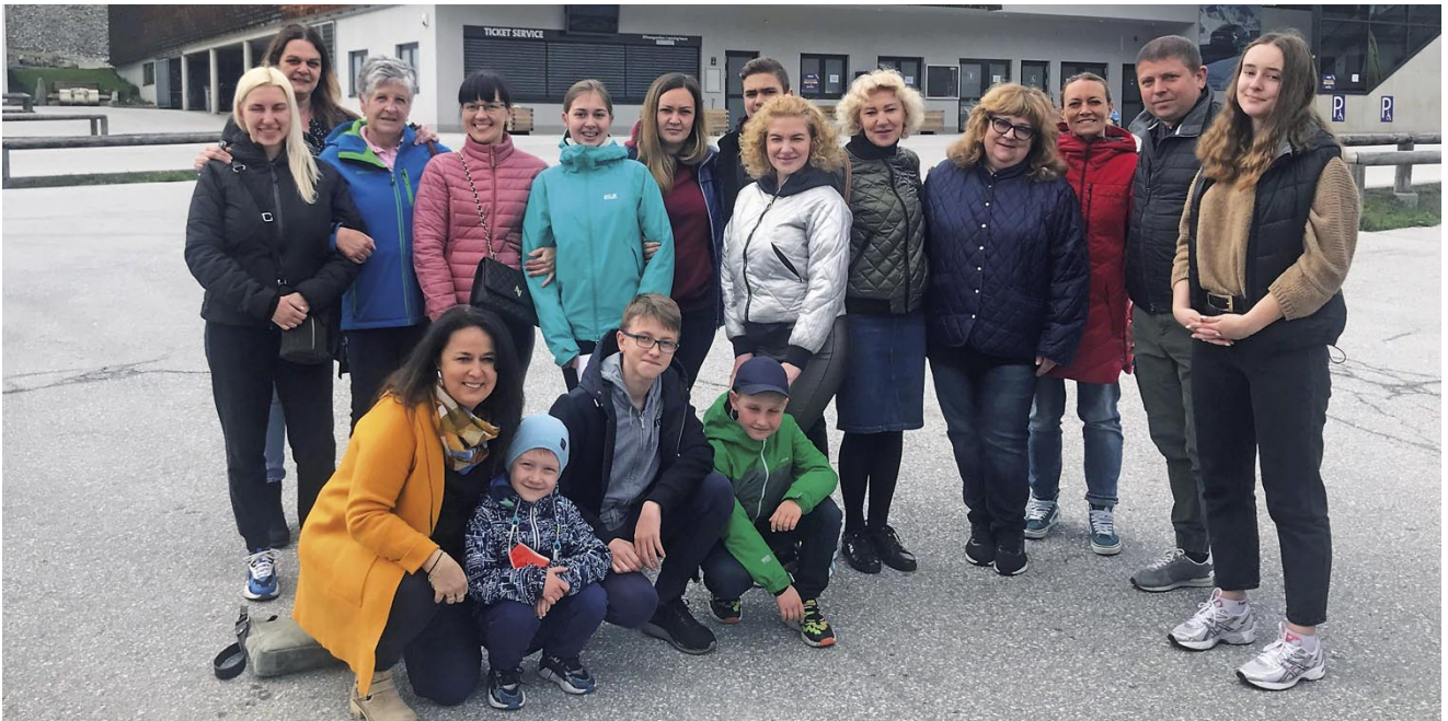
Einkaufsfahrt nach Mittersill, um auch einmal etwas Neues zu kaufen - organisiert von unserer Vinzenzgemeinschaft mit großzügiger Unterstützung von Chorgemeinschaft und Sozialverein. Zusammen sind wir mehr. - Danke für die Mithilfe, die Gesichter zum Strahlen zu bringen!

Die anderen sind Kinder und Jugendliche, die die ukrainischen Gleichaltrigen wie selbstverständlich mitnehmen - zum Spielen, Skaten oder ins Jugendzentrum. So wie es jetzt aussieht, sind wir auf einem guten Weg. Danke an alle, die mithelfen, Integration zu leben!