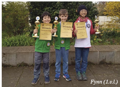
Fynn (l.u.l.)

Mit sehr aktiver Jugendarbeit und auch breit aufgestelltem Mannschaftsbereich ist „Schach ohne Grenzen“ ein sehr guter Verein, in