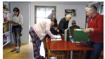
Reges Interesse im Archiv