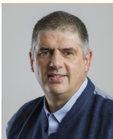
Bürgermeister Tel. 5202-12 oder 0664/44 18 779 buergemeister@jochberg.tirol.gv.at