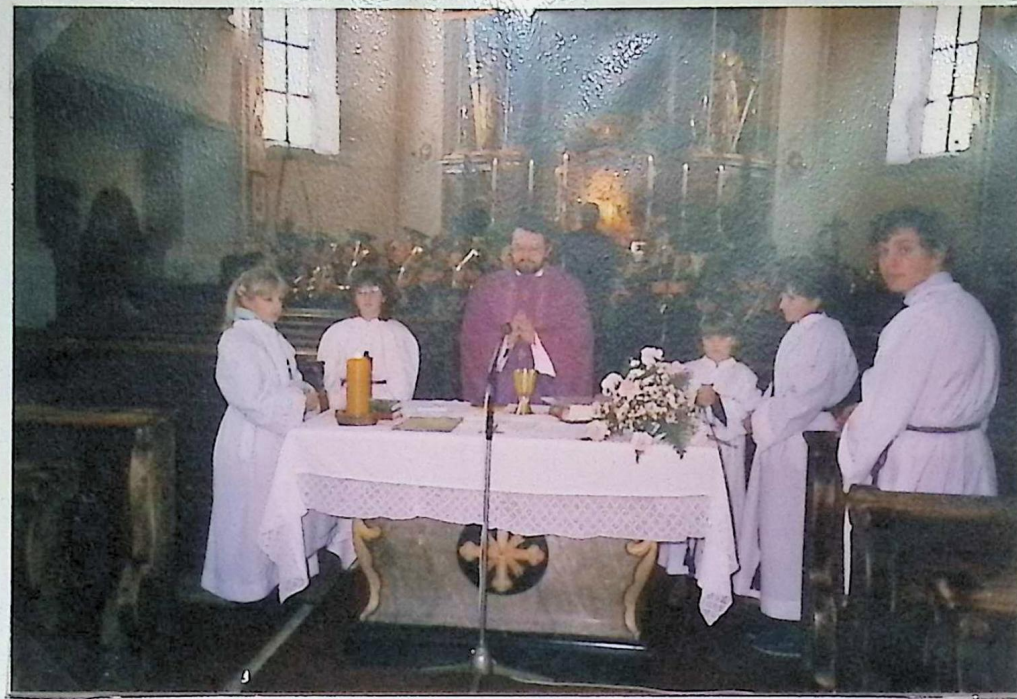
Cöziliienkirchgarnung der Musikkapelle Zochberg 1987