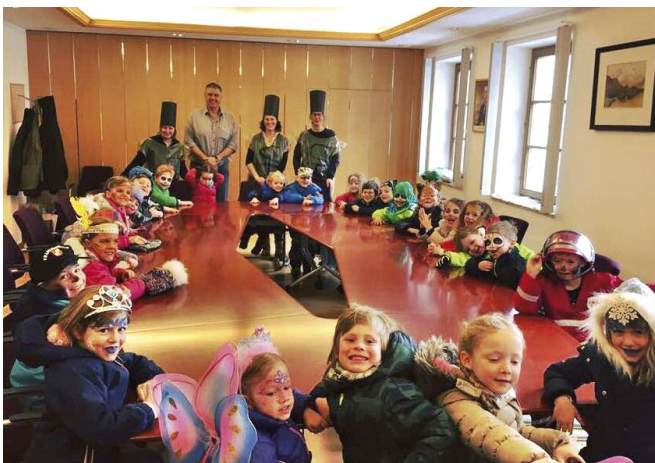
„Besuch beim Bürgermeister“

wurden für ihren Besuch im Gemeindeamt vom Bürgermeister mit Faschingskrapfen und Saft belohnt. Nach der Pause besuchten sie die Volksschulkinder und tanzten gemeinsam „So ein schöner Tag“. Einhellige Meinung: „Wir freuen uns schon auf den Fasching im nächsten Jahr!“