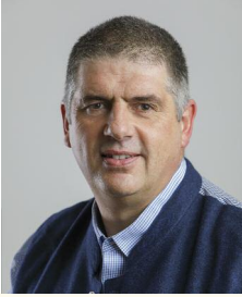
Bürgermeister Tel. 5202-12 oder 0664/44 18 779