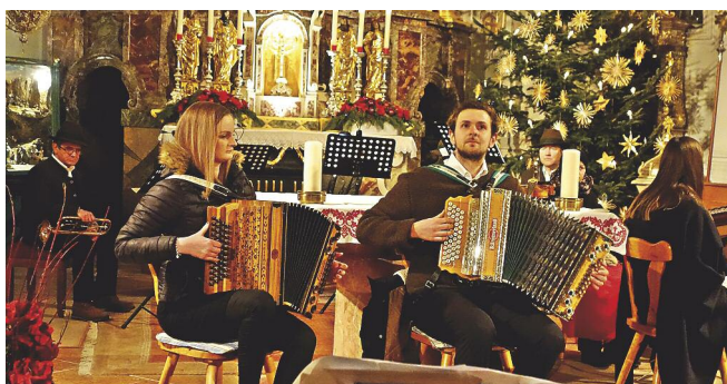
Einige mitwirkende Musik- und Gesangsgruppen

Am Stefanitag veranstaltete die Chorgemeinschaft Jochberg zum achten Mal ein Weihnachtskonzert, bei dem verschiedene Sänger und Musikanten eine feierliche Konzertsstunde in der Pfarrkirche Jochberg gestalteten.