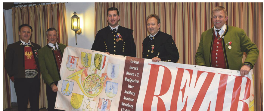
Übernahme des Banners bei der Bezirksversammlung.

Wir stecken bereits mitten in den Vorbereitungen und freuen uns, euch vom 10. bis 12. Juli 2020 beim Musikfest am Kultursaal-areal begrüßen zu dürfen.