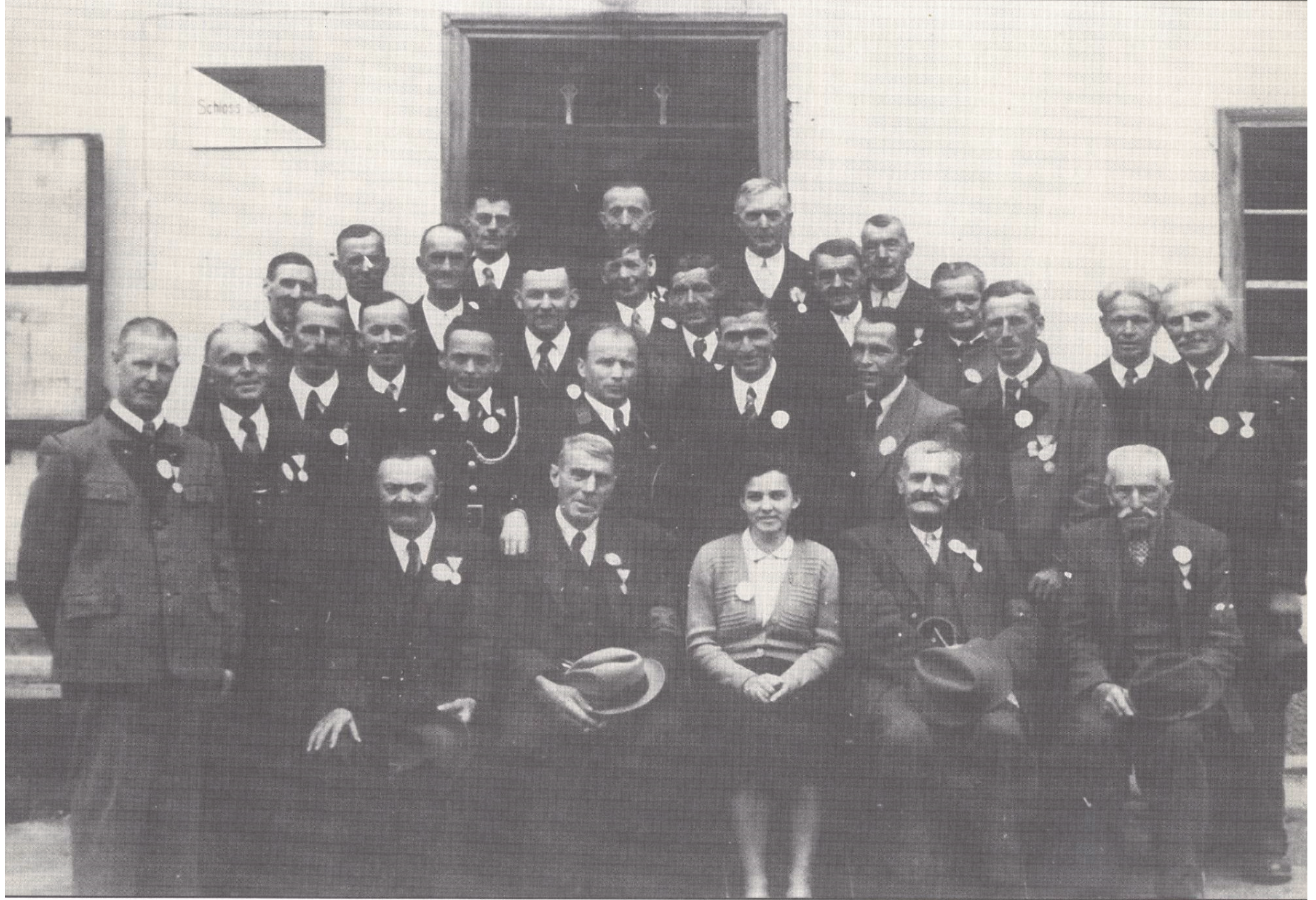
Feuerwehr 1949, Motorspritzenweihe