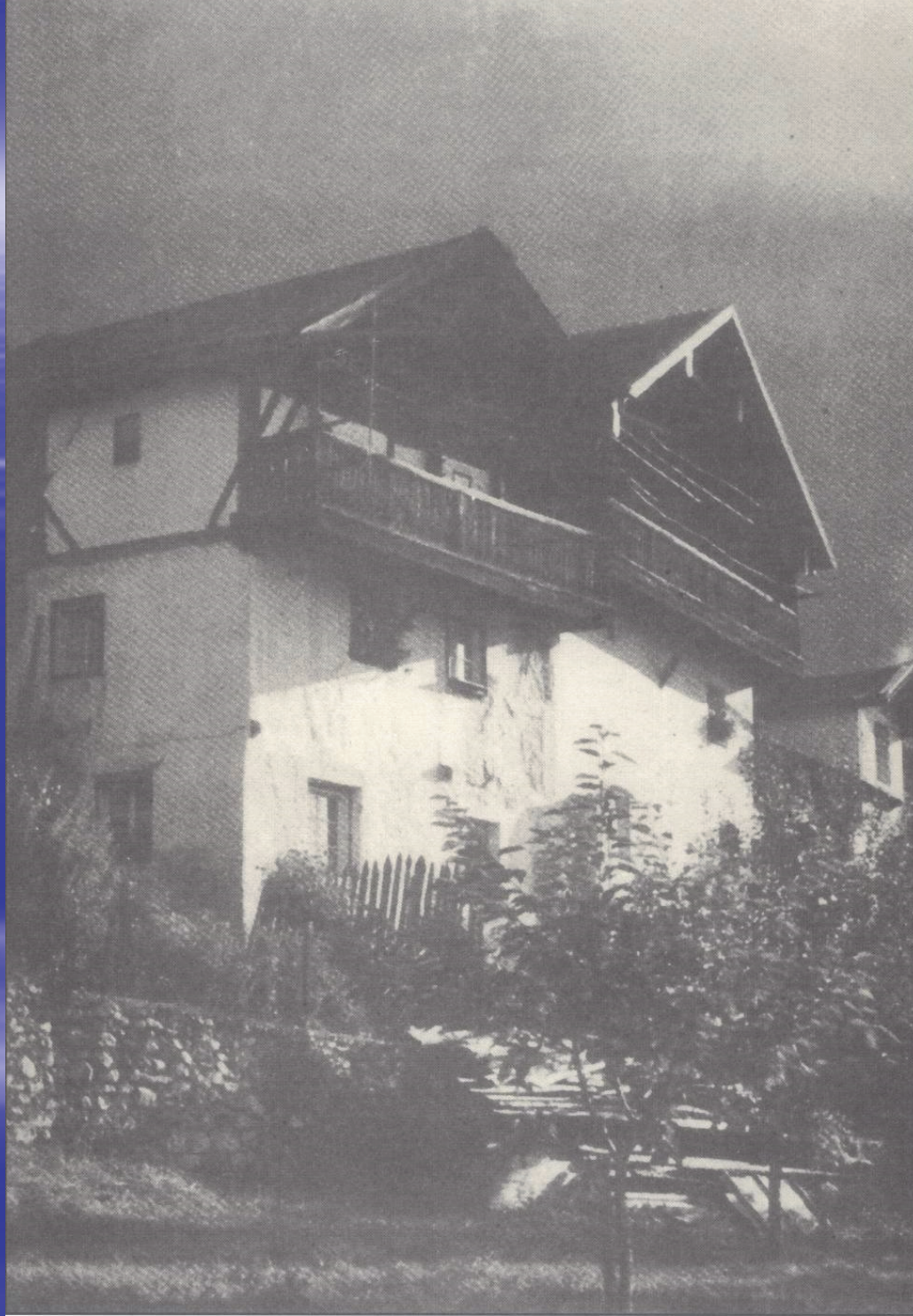
Ortsteil Loch am Fabriksteig