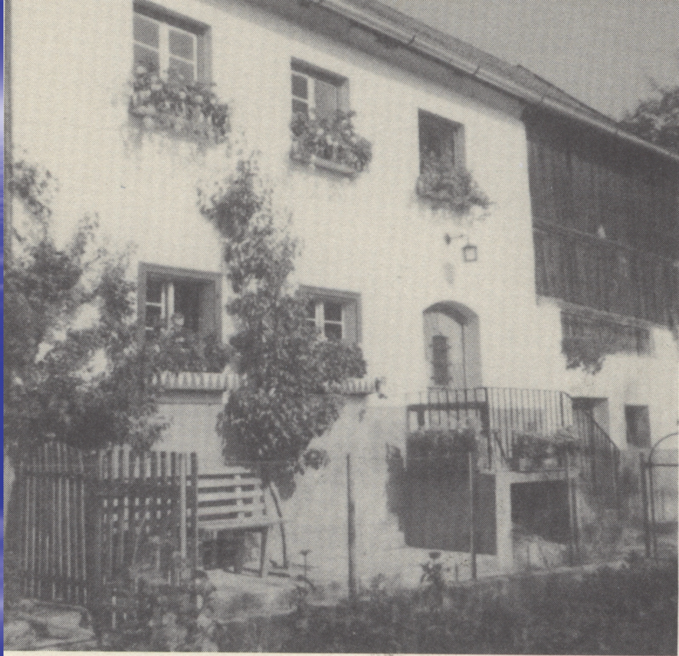
„s' Bargars Haus“