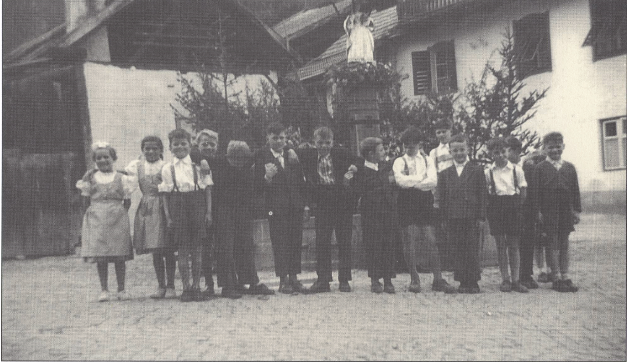
Am Dorfbrunnen 1958