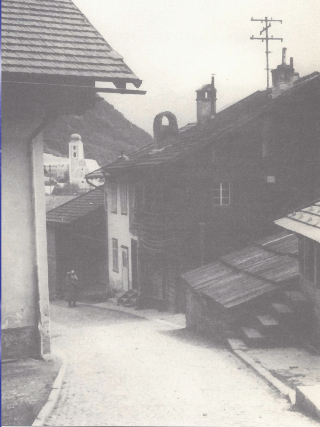
„Tures und Sineles Haus“