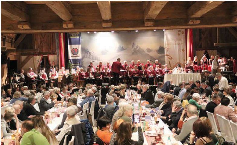
An die 200 Gäste und zahlreiche Ehrengäste waren in die Trofana gekommen, um gemeinsam mit dem IPA Chor Tirol zweimal 20 Jahre zu feiern.

die Geigerin“, der Bruggner Vierge-sang und der DoReMi Chor ein abwechslungsreiches Programm. Der Reinerlös fließt jedes Jahr in den Sozialtopf der IPA Tirol. Angehörige von verletzten, schwer erkrankten oder getöteten Polizisten werden damit unterstützt.