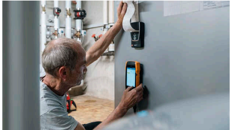
Sind Sie bereit für Ihre optimale Energiezukunft?

Wer auf der Suche nach individuellen und innovativen Energielösungen für private Haushalte, Unternehmen oder öffentliche Einrichtungen ist, findet in GUTMANN Energiesysteme, einem Tochterunternehmen von GUTMANN, einen lokalen „Alles-aus-einer-Hand“-Partner.