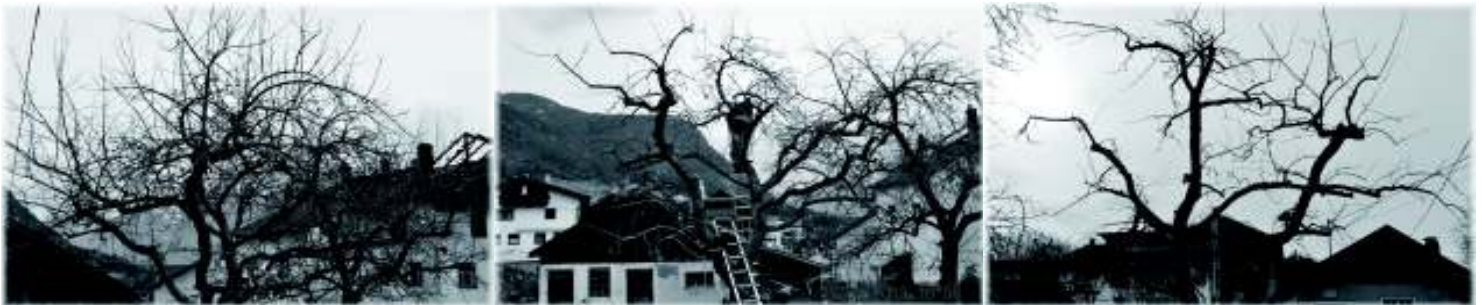
Der Apfelbaum im Obstanger vor