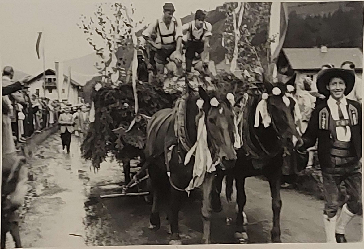
Festwagen des Verkehrsvereines Oetz. Ackerwagen. Pflügender Bauer wobei die Bauernsöhne den Pflug ziehen.