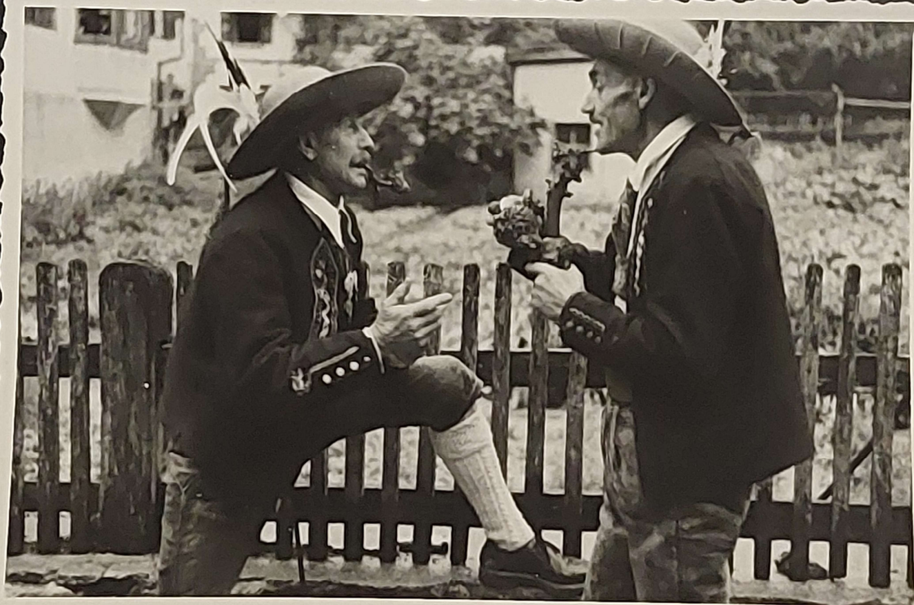
Zwei Oetztaler im Zwiegespräch.