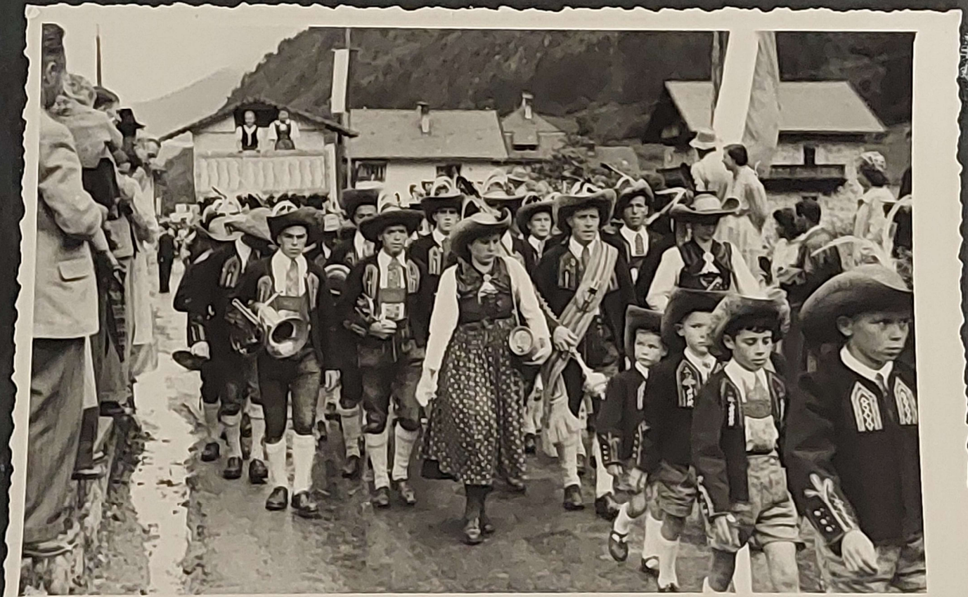
Musikkapelle Umhausen, und Jungschützen von Umhausen.