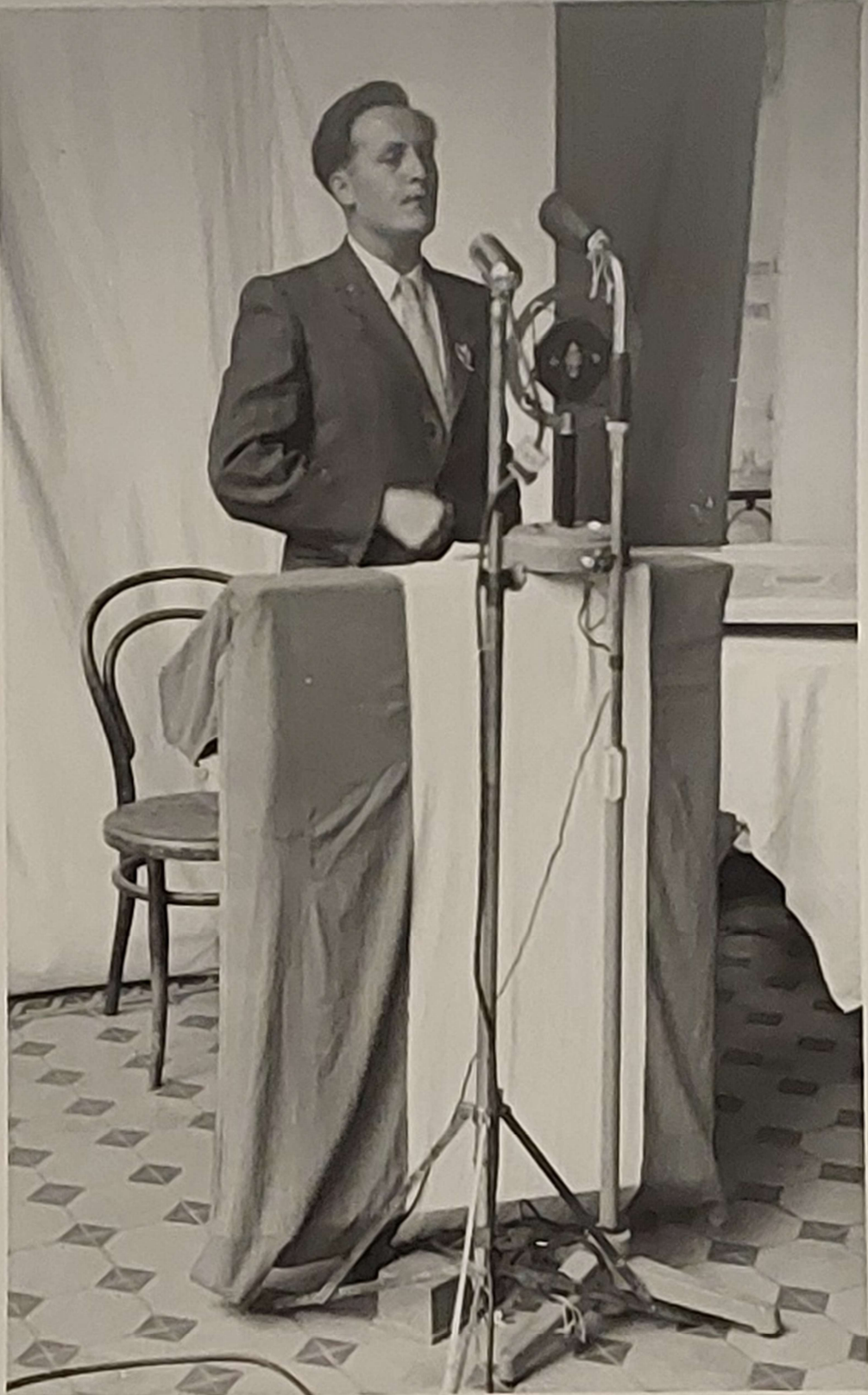
Bürgermeister Walter Gritsch von Oetz bei der Ansprache.