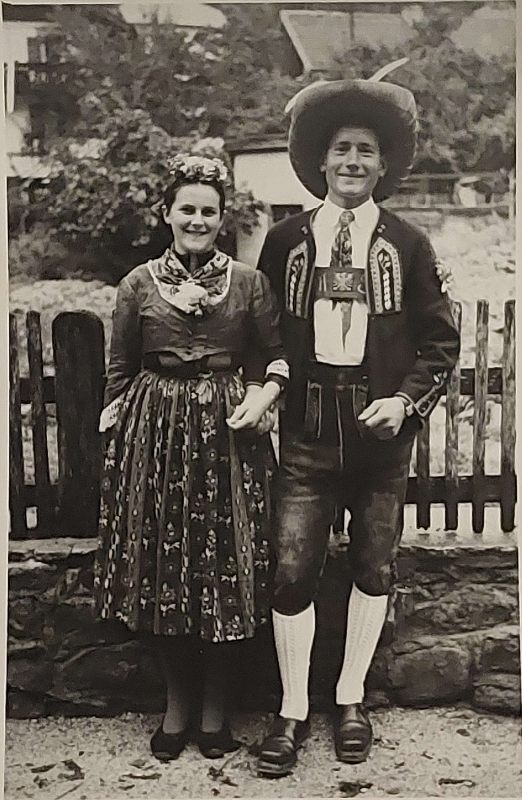
"Aus alter Zeit". Junges Oetztaleser-Trachtenpaar.