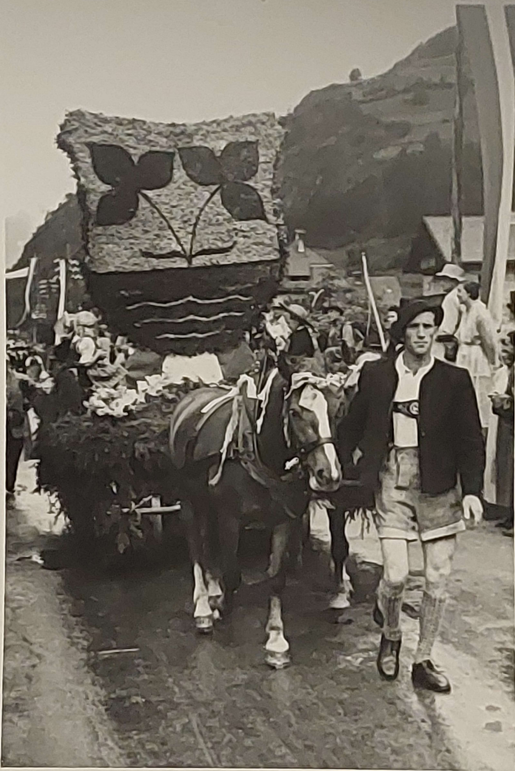
Festwagen der Gemeinde Oetz. Wappen der Gemeinde Oetz.