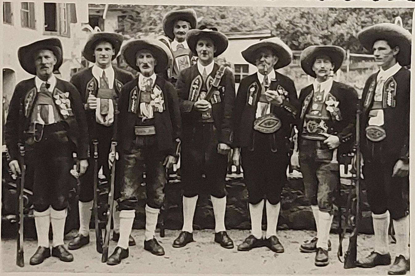
Schützengruppe aus Längenfeld.