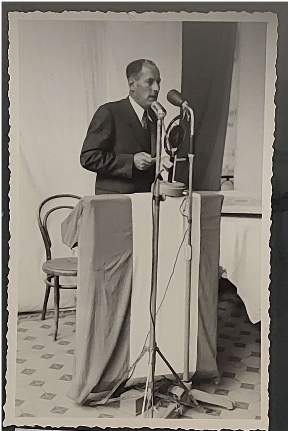
Bürgermeister Georg Fiegl von Sölden bei der Ansprache.