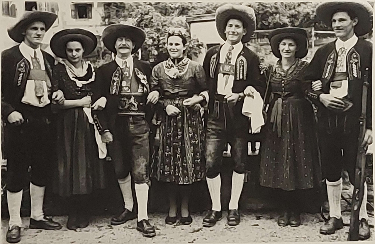
Trachtengruppe aus dem Oetztal.