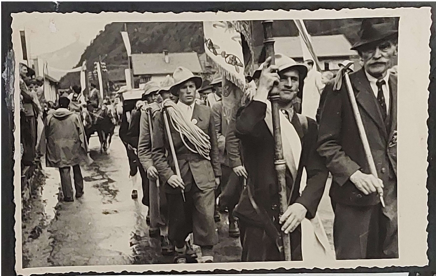
Bergführergruppe mit Bergführerfahne aus der Gemeinde Sölden.