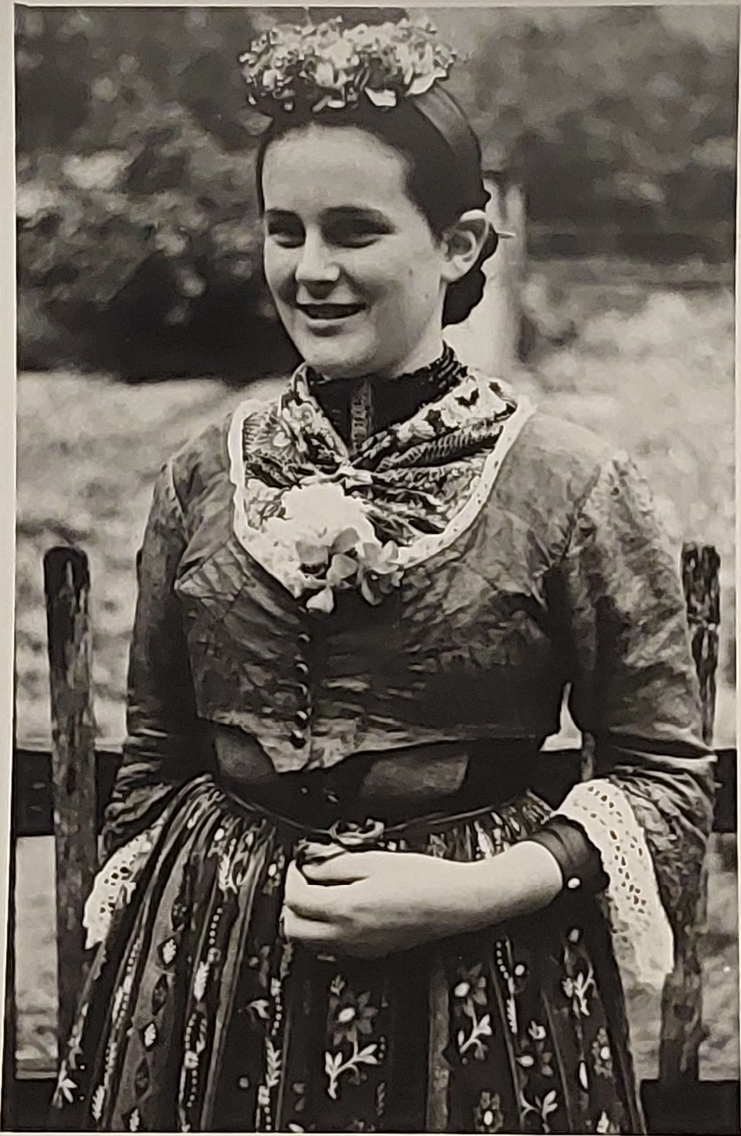
Fesche Oetztalerin aus Oetz.