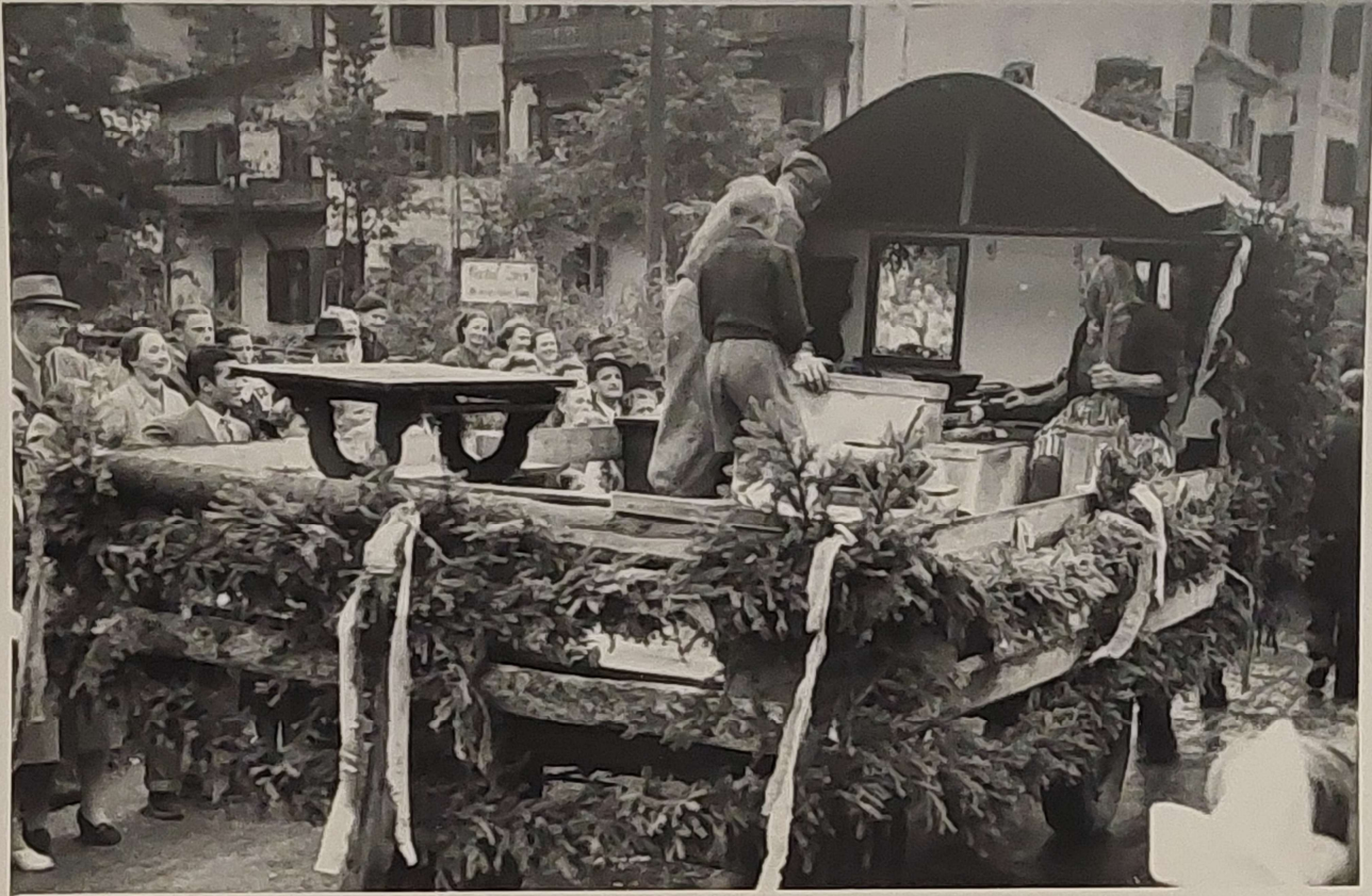
Festwagen der Gemeinde Längenfeld. Milchwirtschaft daheim.