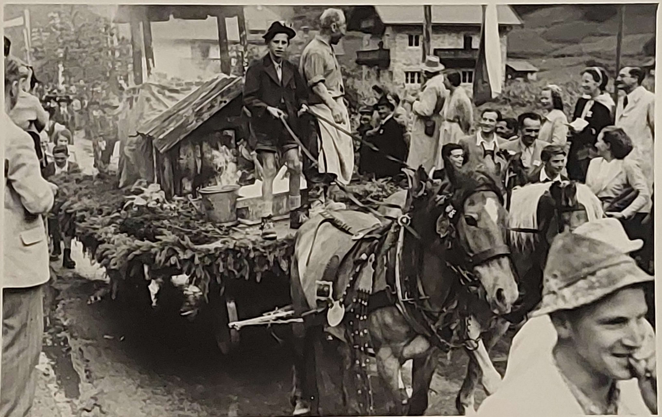
Festwagen der Gemeinde Sautens. Meilerofen. Das Kalkbrennen ist in der Gemeinde Sautens ein jahrhundertealter Wirtschaftszweig.