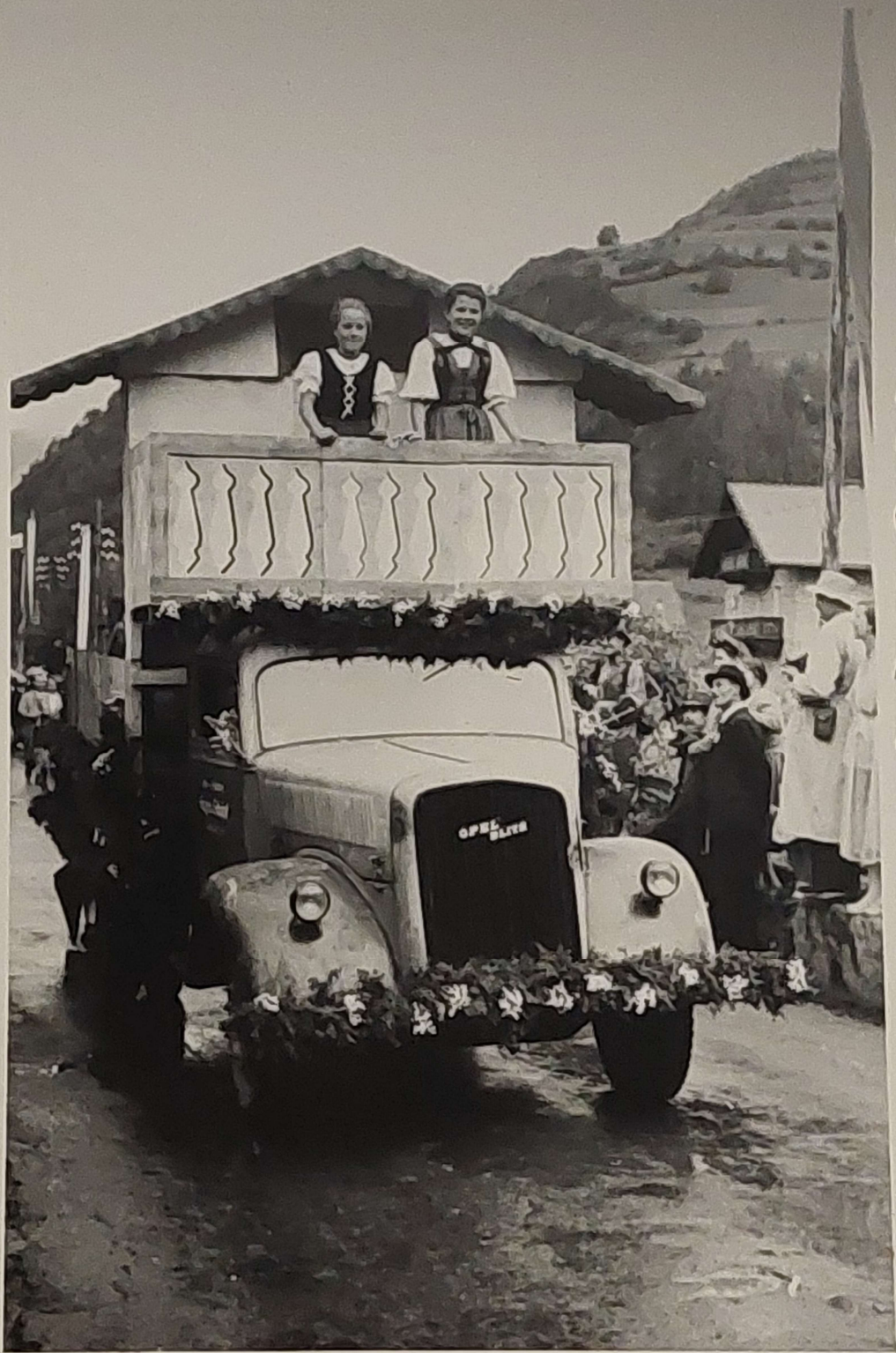
Festwagen der Gemeinde Umhausen. Oetztaler-Gastlichkeit.