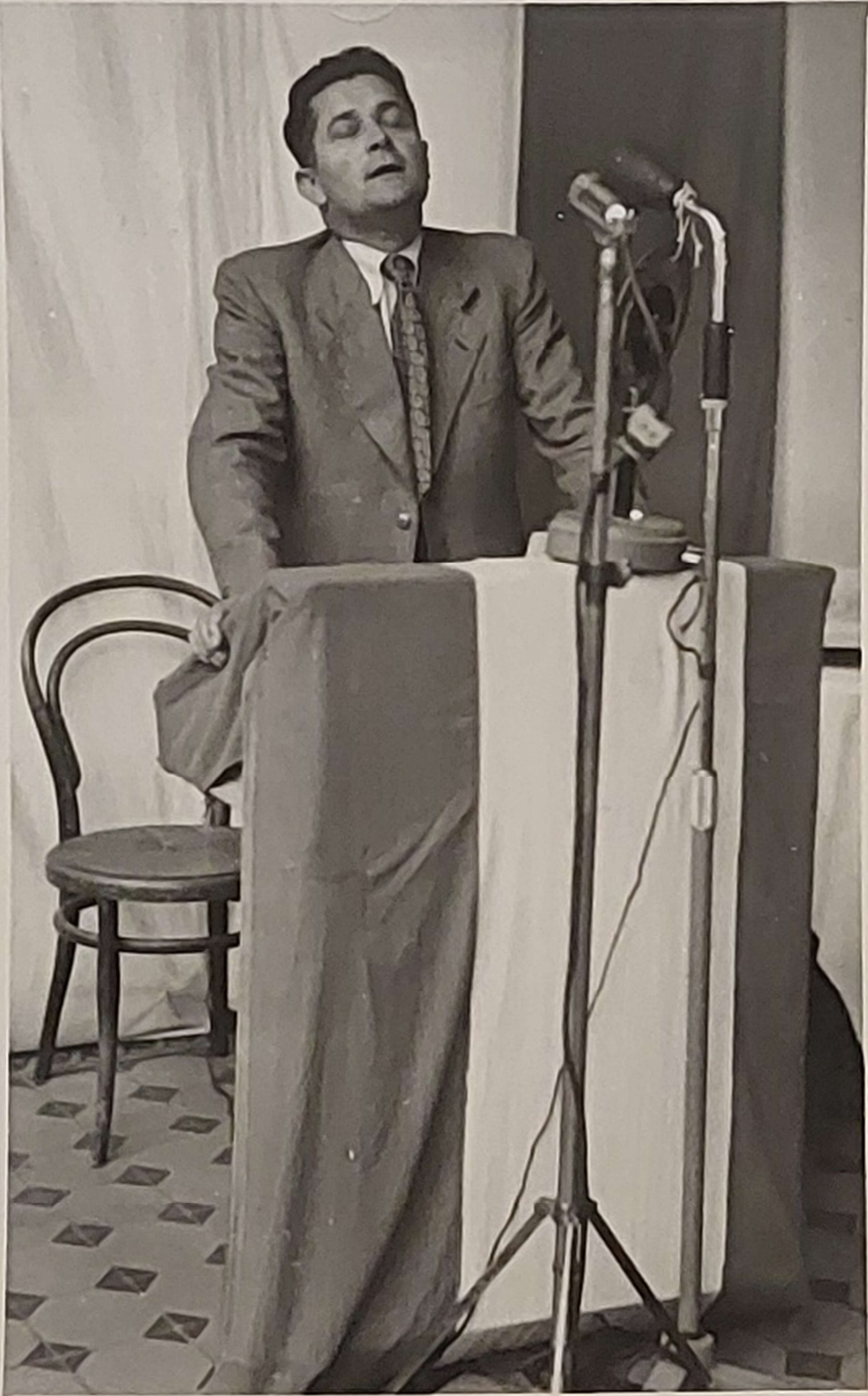
Landesrat Eduard Wallnöfer Landeslandwirtschaftsreferent bei der Ansprache.