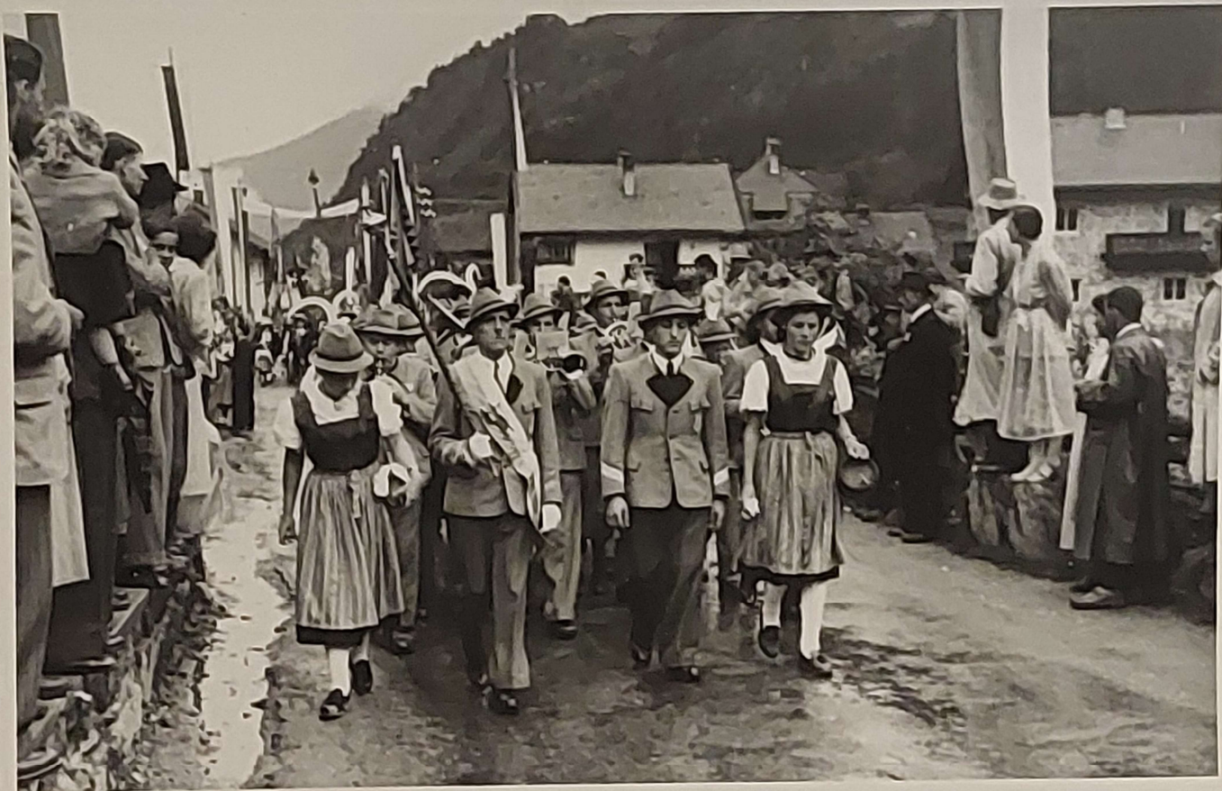
Musikkapelle Tumpen, Gemeinde Umhausen.