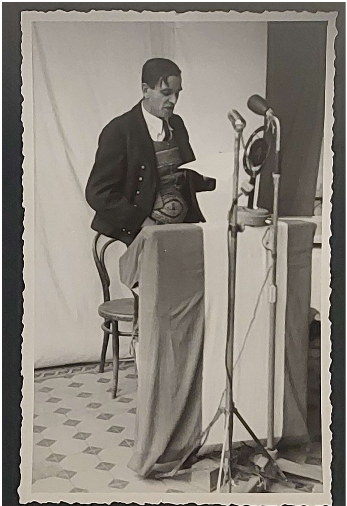
Bürgermeister Hugo Oberhofer von Sautens bei der Ansprache.