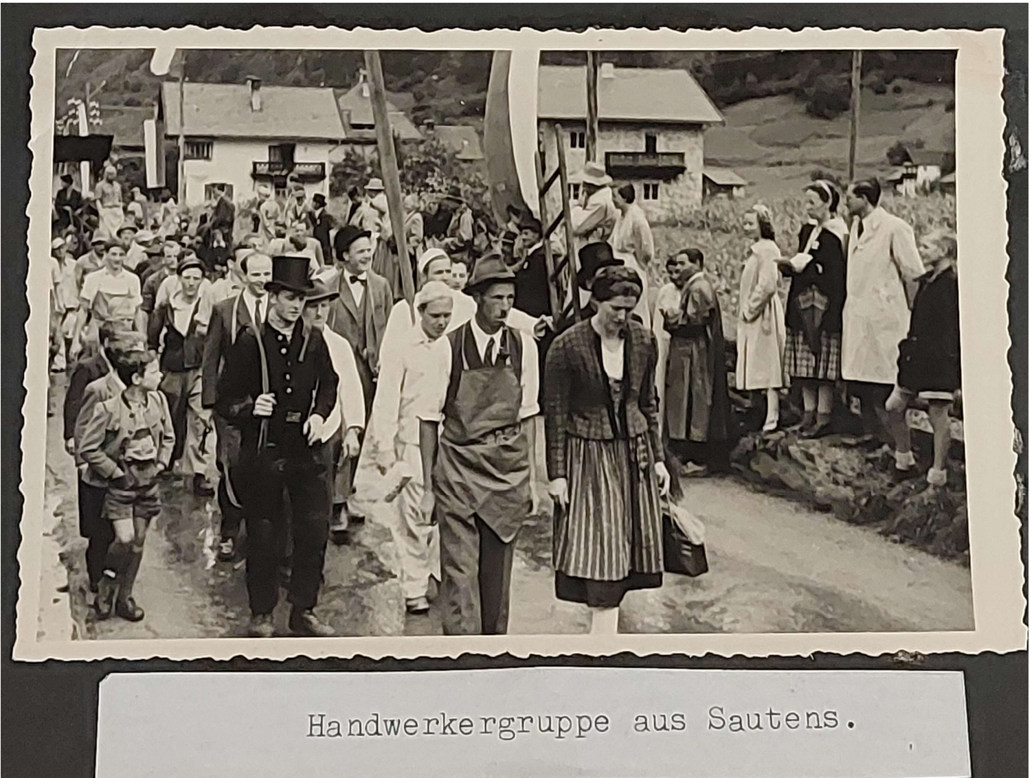
Handwerkergruppe aus Sautens.