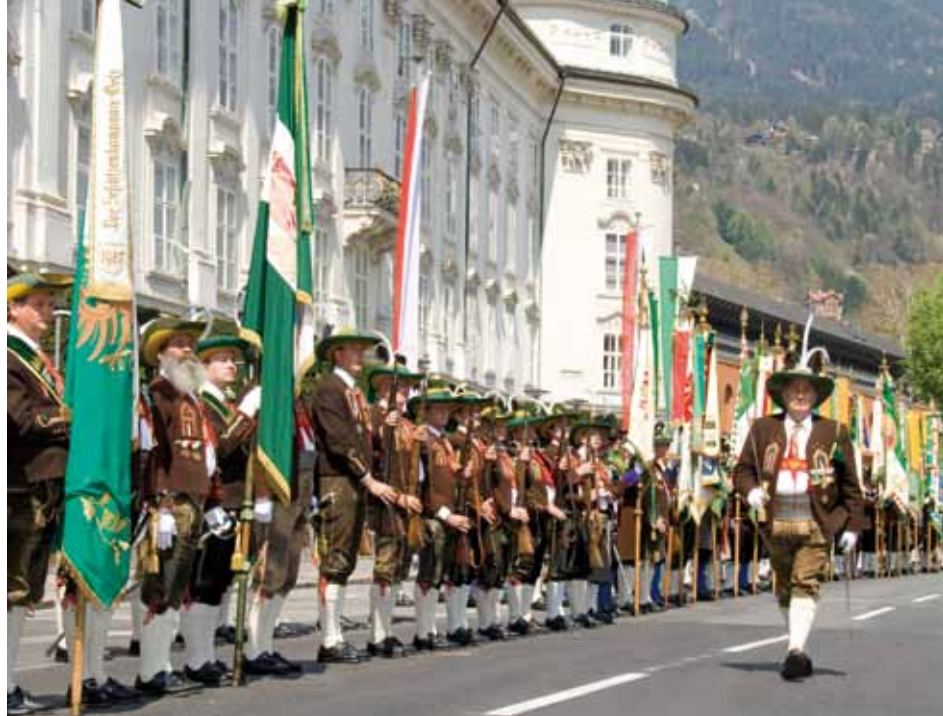
Bundesversammlung in Innsbruck - 23.04.2010 - Ehrenkompanie Oetz

Auch im Jahr 2010 hat sich in der Schützenkompanie Oetz, der mannstärksten des Bataillons Ötztal, wie immer sehr viel getan. Die Marketenderinnen und Schützen – ob jung oder alt – sind zu verschiedensten Feierlichkeiten ausgerückt und trugen so auch wieder dazu bei, kirchliche und weltliche Veranstaltungen zu verschönern. Verbundenheit zur Heimat, zur Tiroler Tradition, zu unserer wunderschönen Gemeinde sowie tatkräftige Mithilfe im Dorfleben zeichnet uns aus. Die 71 aktiven Mitglieder sind stolz auf ihre Kompanie und deren Kameradschaft. Nicht unerwähnt dürfen an dieser Stelle auch die Tätigkeiten der Jungschützen bleiben, die – neben vielerlei gemeinsamen Ausrückungen – auch beachtliche sportliche Leistungen, etwa bei verschiedenen Schießwettbewerben erbracht haben. Um euch einen Einblick zu geben, was heuer auf dem Programm stand, seien folgend die wichtigsten Veranstaltungen in diesem Schützenjahr aufgezählt: