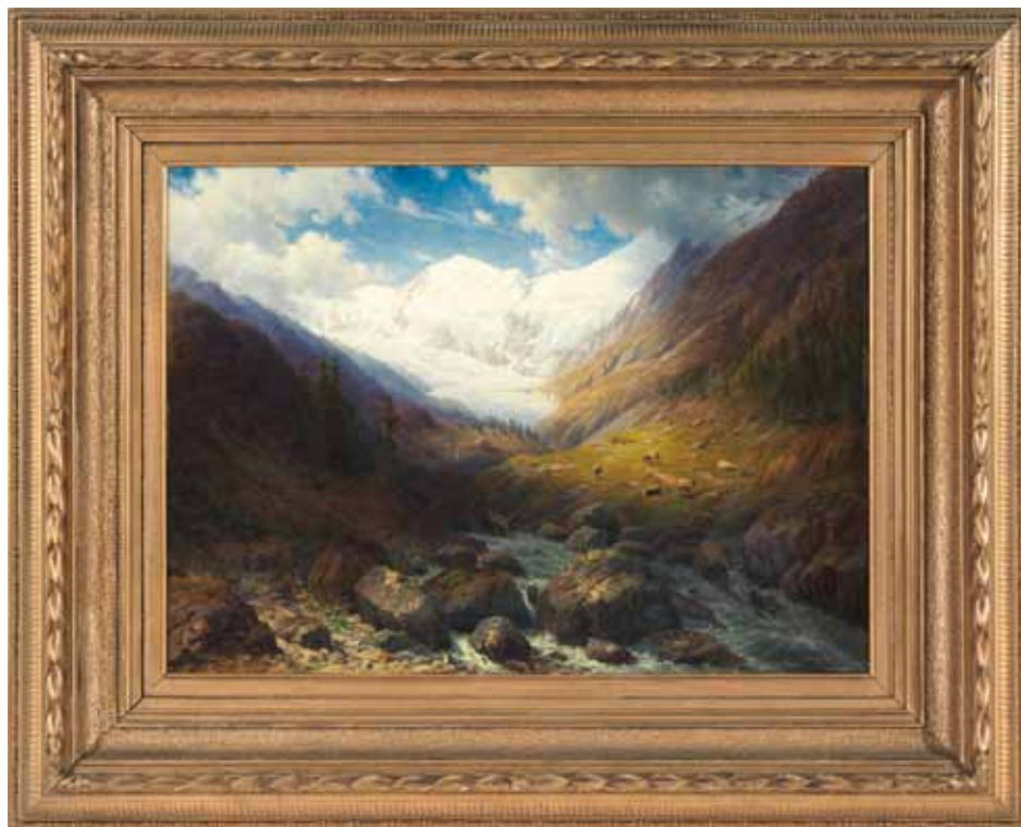
„Der Oetzthaler Ferner Gurgltal“ von Daniel Somoggi, München 1858

Die jüngst vergangenen Monate, oder eigentlich das ganze Jahr über, waren geprägt vom Schatten, die das neue Depot und Archiv vorauswerfen. Einerseits musste der Museumsbetrieb aufrechterhalten werden – mit Sonderausstellungen und den nötigsten Verrichtungen, auf die man nicht verzichten kann. Andererseits war man zu Entscheidungen gezwungen, besonders bei den Mitarbeiterinnen, die sich dann auf angenehme Weise gelöst haben. In der Organisation des Museumsbereichs ist manches im Umbruch