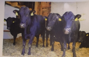
Wagyu-Rinder stammen aus Japan und zeichnen sich durch Fleischqualität aus.