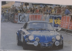
Die WiSo Klassik kommt in Fahrt: am Freitag, 2. August.