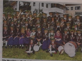
Die Musikkapelle Oetz freut sich über zahlreichen Besuch beim Frühjahrskonzert.

■ OETZ. Am Samstag, dem 6. April (20.15 Uhr) lädt die Musikkapelle Oetz zum Frühjahrskonzert in den Saal „Ez“ in Oetz ein. Bereits am 5. April (20.15 Uhr) findet eine öffentliche Generalprobe statt, zu der die Musikantinnen und Musikanten ebenfalls einladen. Kapellmeister Georg Klieber hat für dieses Konzert ein abwechslungsreiches Programm zusammengestellt. Eröffnet wird das Konzert mit der „Nordic Fanfare and Hymn“, nach den zwei symphonischen Werken „Askania“ und „Fate of the God“ kommt es zu einem Höhepunkt des Konzertes – die Komposition „Bilder eines Tales“ von Klaus Strobl wird gemeinsam mit dem Ötztaler Vieregensang uraufgeführt. Dabei werden auch Bilder aus dem Ötztal zu sehen sein. Der zweite Teil wird mit dem beschwingten Stück „Power of the Youth“ eingeleitet. Mit den moderneren Klängen von „Brass Time“ und „Glorious“ endet das Frühjahrskonzert, nicht ohne dem Schlussmarsch – „Du bist mein