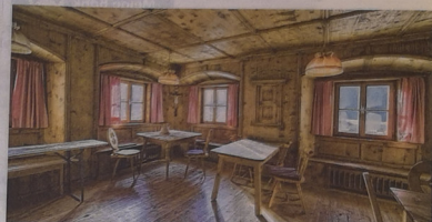
Eine einfache Stube mit Tisch und Stühlen – so sah die erste Raiffeisenbank Tirols aus. Dem Raum im alten Pfarrheim von Oetz, der ab 1888 die „1. Raiffeisensche Darlehenskasse“ beherbergte, gibt es noch immer.

nerungsverein (Vorgänger des Tourismusverbandes), die Freiwillige Feuerwehr sowie die Senner- und Viehzuchtgenossenschaft.