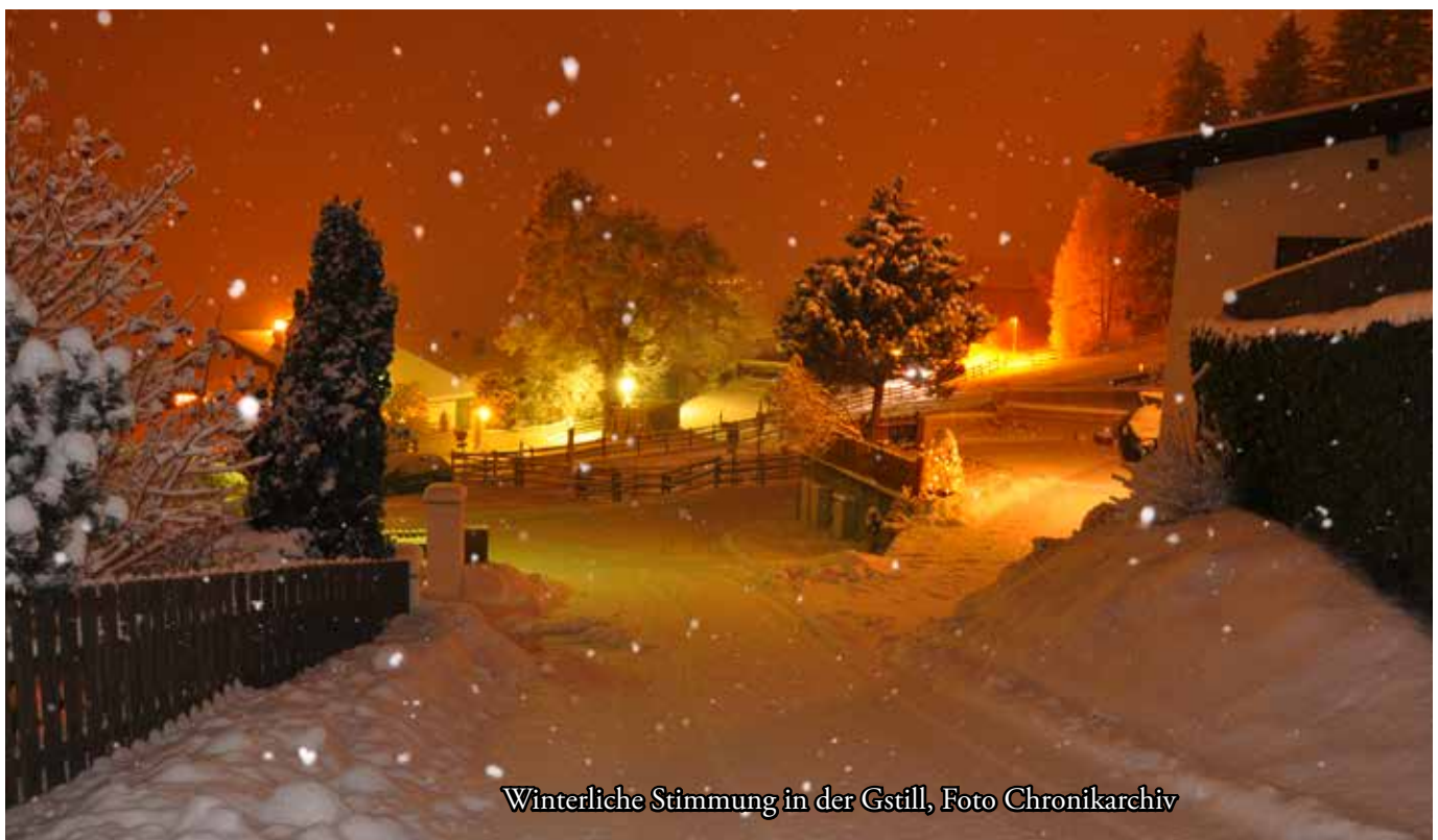
Winterliche Stimmung in der Gstill