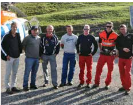
Foto: das 3-köpfige Heli-Team (rechts) und seine fleißigen Patscher Helfer