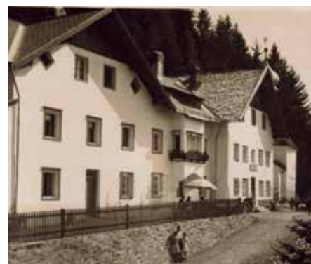
Ansicht des Gasthofes Heiligwasser nach einer Postkarte aus dem Jahre 1933

Wallfahrt und Einkehr ins Gasthaus sind eine Einheit so wie Leib und Seele zusammengehören. Wir wünschen dem Stift Wilten viel Erfolg für dieses Vorhaben! Oswald Wörle