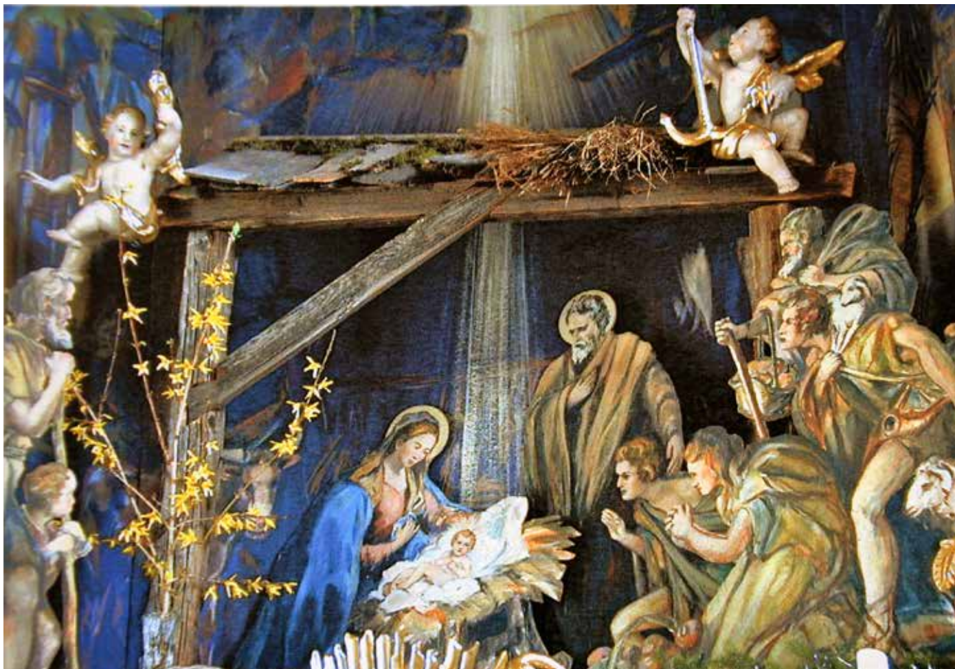
Altarkrippe in der Pfarrkirche Igls, gemalt von Josef Strobl. Sie entstand ungefähr zur gleichen Zeit wie die in unserer Kirche von Franz Seelos.

Die Redaktion des Patscher Dorfblattes wünscht allen Leserinnen und Lesern Frohe Weihnachten und für das neue Jahr Gottes Segen!