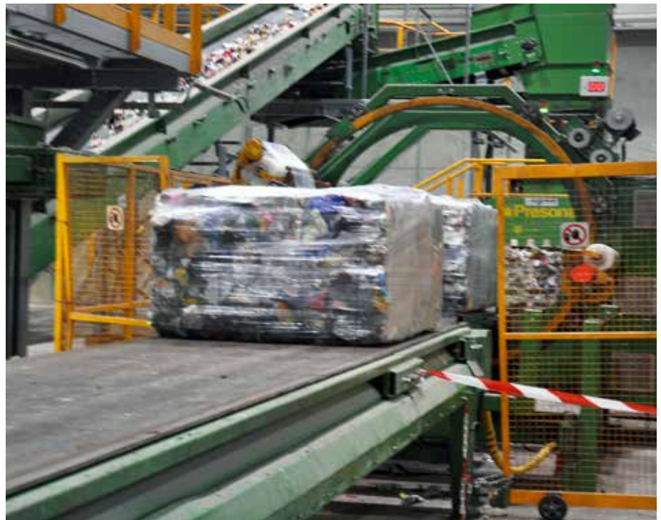
Zum Bild: Die kalorischen Fraktionen werden als Ersatzbrennstoffe einer thermischen Verwertung zugeführt, d. h. in Energiezentralen z. B. in der Industrie zur Energieerzeugung eingesetzt. Die Wertstoffe (z. B. Metalle) werden wieder in den Stoffkreislauf eingebracht.

Fotos: O. Wörle, Text: G. Zimmer und auszugsweise aus: Der ATM Jahresbericht 2012, 20 Jahre Abfallwirtschaft Tirol Mitte GmbH.