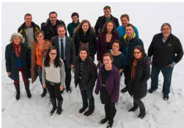
Im Bild: Lehrer/innen der Musikschule

Im Schuljahr 2013/14 begeht die LMS SÖM ihr 20-jähriges Bestandsjubiläum mit einer Reihe von Veranstaltungen. Im Zeichen des Jubiläums werden sowohl die traditionellen Schwerpunktkonzerte als auch zwei spezielle Jubiläumstermine stehen: Die erste dieser zwei großen Jubiläumsveranstaltungen ist ein Galakonzert , zu dem wir das Tiroler Landesjugendorchester eingeladen haben. Dieses Projekt des Tiroler Landesmusikschulwerkes existiert seit 10