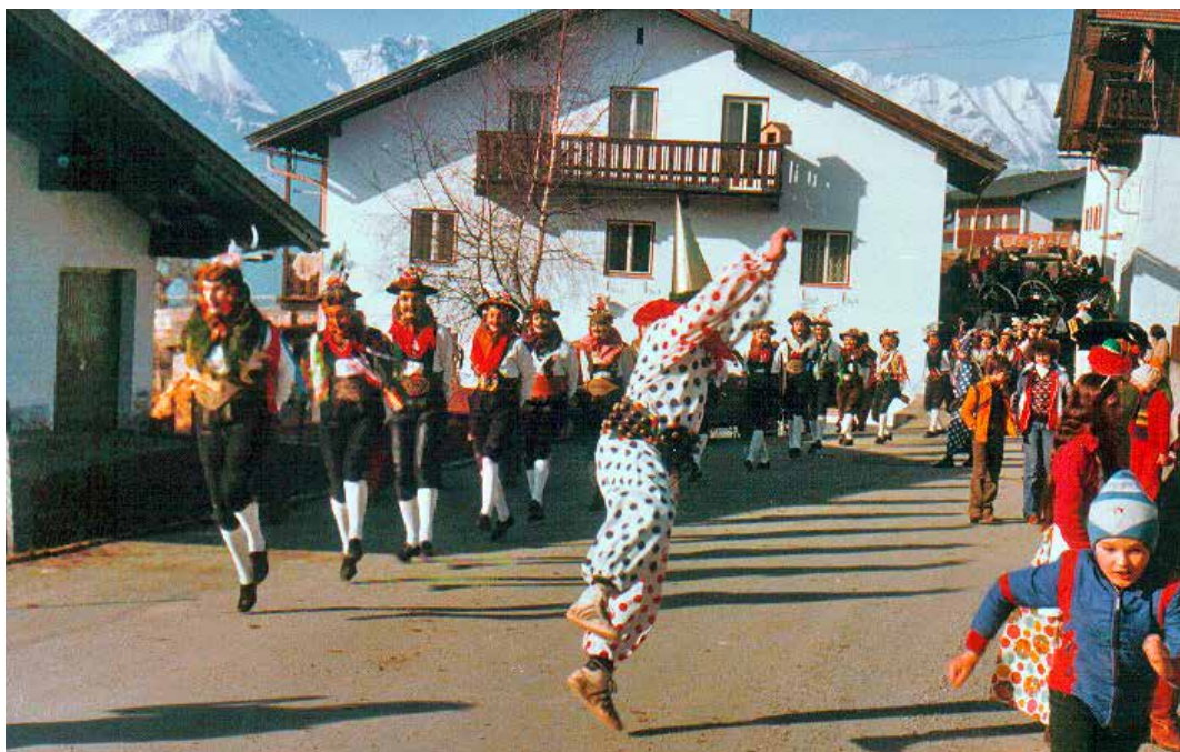
Unsinniger Donnerstag 1979: Schellenschlagen im Unterdorf

Namentlich gekennzeichnete Beiträge geben die Meinung der jeweiligen Autoren wieder und müssen sich nicht mit jener des Herausgebers decken.