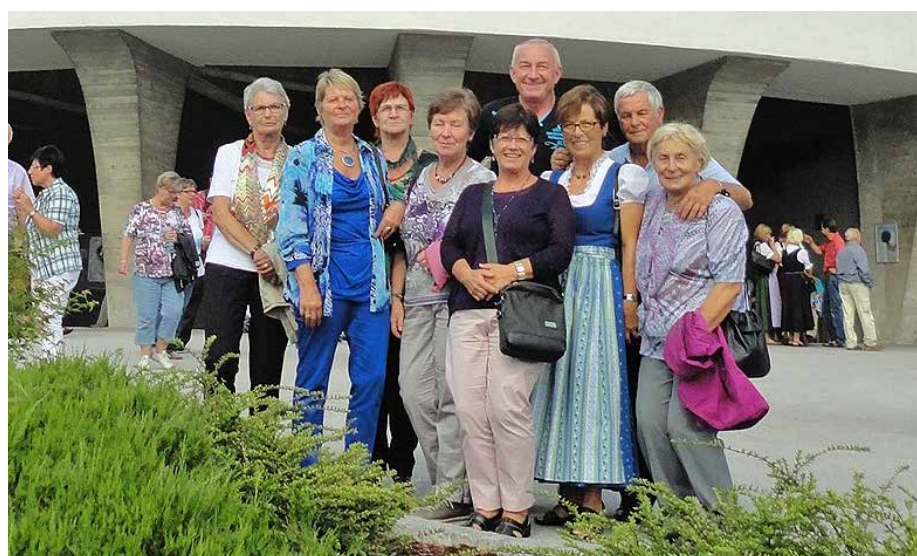
Besuch der Erler Passionsspiele