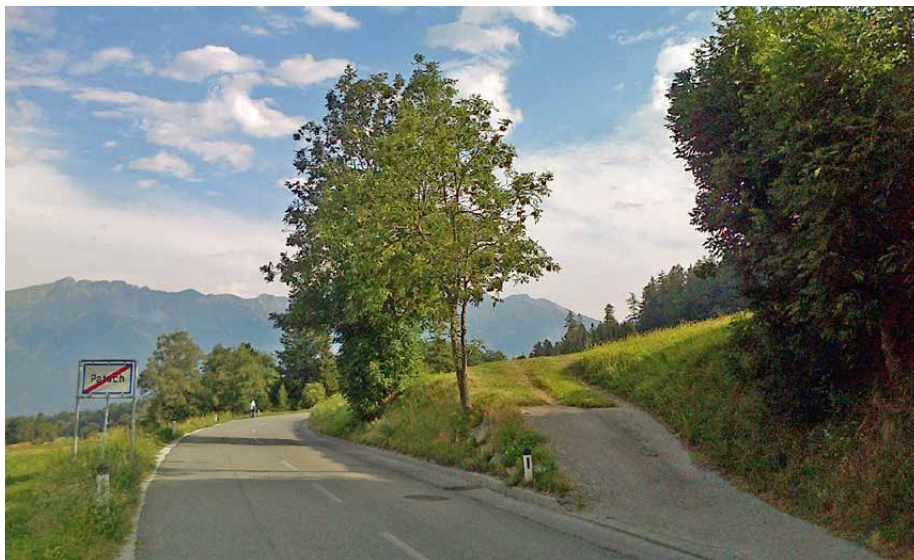
Foto: Auf diesem Grundstück an der Römerstraße, hinter der Feldauffahrt soll der geplante Lebensmittelmarkt entstehen.

Der besprochene Zeitplan sieht die Eröffnung des Marktes ab Mitte bis Ende 2014 vor. Die Gemeinde ist bestrebt, dass bis zu diesem Zeitpunkt das bestehende Geschäft weiterbetrieben wird.