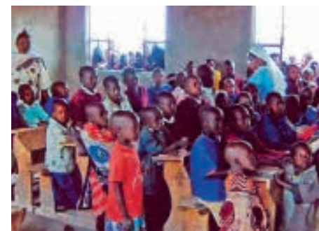
Eine Schulklasse in der Diözese Arusha