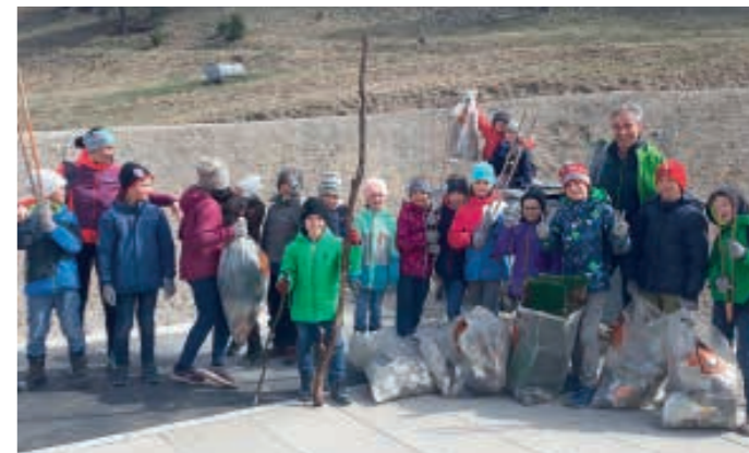
3. und 4. Klasse mit der eingesammelten „Beute“ am Ziel der Sportplatzterrasse.

Die Agrargemeinschaft Patsch bedankt sich für die tatkräftige Unterstützung bei allen fleißigen Helferinnen und Helfern! (Bernhard Haller für die Agrargemeinschaft)