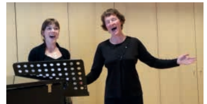
Die beiden stimmungsgewaltigen Sängerinnen überzeugten mit mehreren Duetten. Den Abschluss des Konzertes bildete das lustige Stück für zwei Katzen von Gioacchino Rossini.