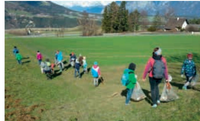
Bei Föhnsturm ging es querfeldein durch Patsch.