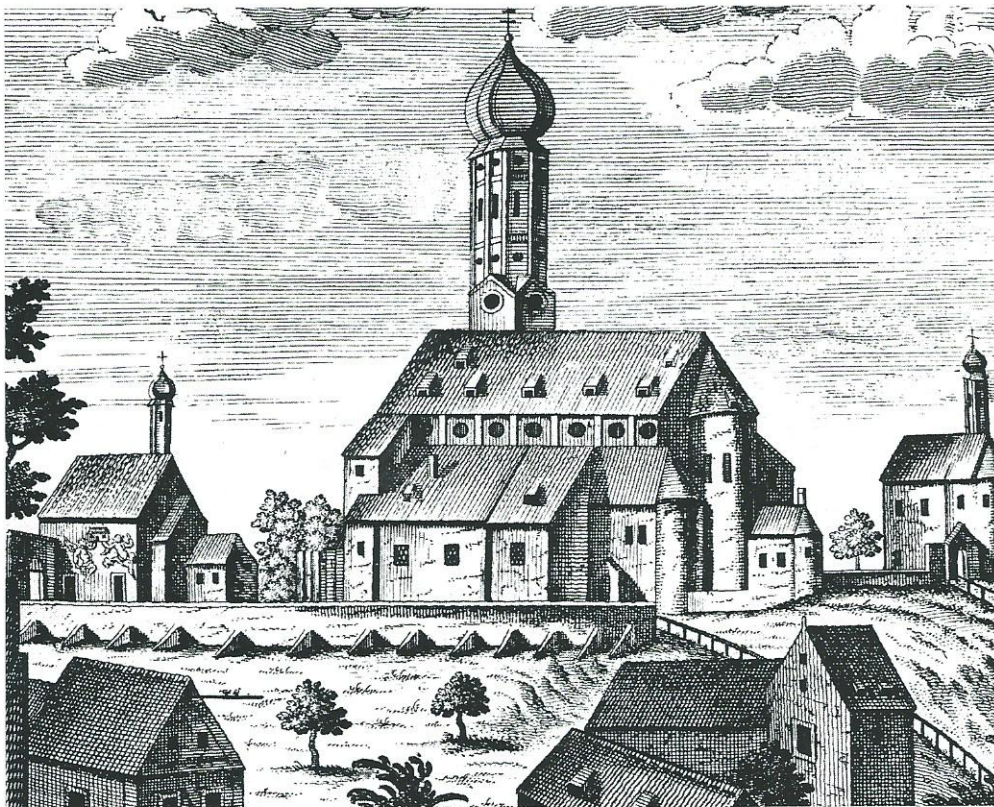
Das 1803 niedergelegte Kollegiatstift St. Veit auf halber Höhe des Weihenstephaner Bergs. Ausschnitt aus dem 1769 von den Brüdern Johann und Josef Klauber in Augsburg nach Entwurf von Johann Baptist Deyrer in Freising gestochenen Kollegiatstifts-Wappenkalender. In der Mitte die Stiftskirche, links die Loreto- und rechts die Nikolauskapelle.

Der dort enthaltene Sitzungsbericht vom 15. September 1740 enthält einen Eintrag mit der Überschrift „Einbeglaitung des hl. Leibs des S: Donati Mart.“. Darin ist zu lesen: 46 „Denn