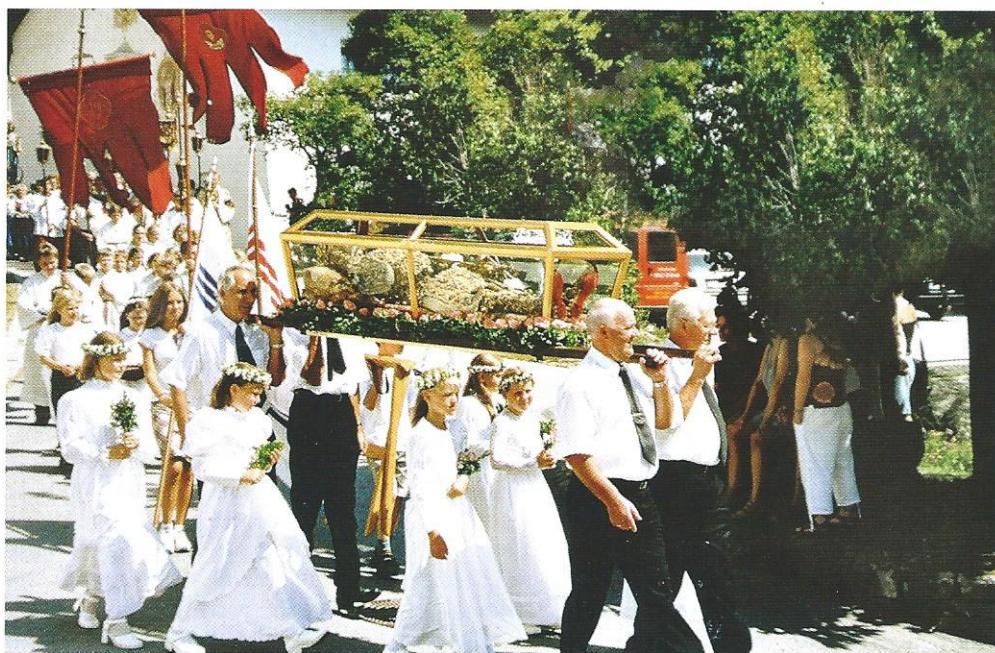
Die Leiberprozession zur 200-Jahr-Feier der Überführung am 7. August 2003.

Wenige Tage nach Ausstellung dieses Revers erfolgte am 29. September 1803 in Patsch die feierliche Übertragung des neu staffierten Heiligen Leibs vom Pfarrhof in die Kirche. Wir dürfen wohl davon ausgehen, dass der Reliquienschrein schon Ende Juli 1803, also ziemlich bald nach der Rückkehr