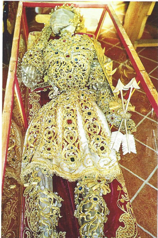
Die reich verzierten Gebeine des hl. Donatus im inneren Schrein. Die heutige Fassung wurde im Jahr 1803 unter Restaurierung und Ergänzung der ursprünglichen Zier von P. Marian Daniel vom Prämonstratenserstift Wilten geschaffen.

Verständlicherweise bemühten sich die neuen Besitzer des Heiligen Leibes darum, Näheres über die Geschichte des heiligen Donatus zu erfahren, über die Umstände der Erwerbung durch den Vorbesitzer, das Kollegiatstift St. Veit 36 in Freising, und über seine Verehrung in der bayerischen Bischofsstadt. Auch zu diesen Aspekten äußert sich der Autor des Hausbuches von Patsch. Unter der Überschrift „Donats ältere Geschichte“ 37 muss er zwar einräumen, dass man über das Leben dieses Märtyrers wenig Sicheres wisse,