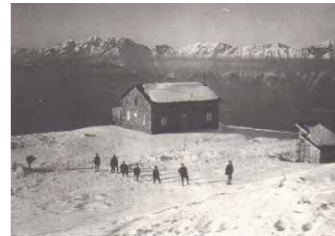
Schitourengänger vor dem Kaiser-Franz-Joseph-Schutzhaus am Patscherkofel um 1900.

Wir möchten an dieser Stelle unseren großen Dank aussprechen für all die prompte und professionelle Hilfe die uns entgegengebracht wurde, als unser Haus aufgrund eines technischen Defektes am 23. Dezember 2021 abgebrannt ist: Der Feuerwehr Patsch, die sofort zur Stelle war, sowie allen nachalarmierten Feuerwehren die gemeinsam alles gegeben haben um Schlimmeres zu verhindern. Der Feuerwehr Patsch welche die Nachtwache ver-