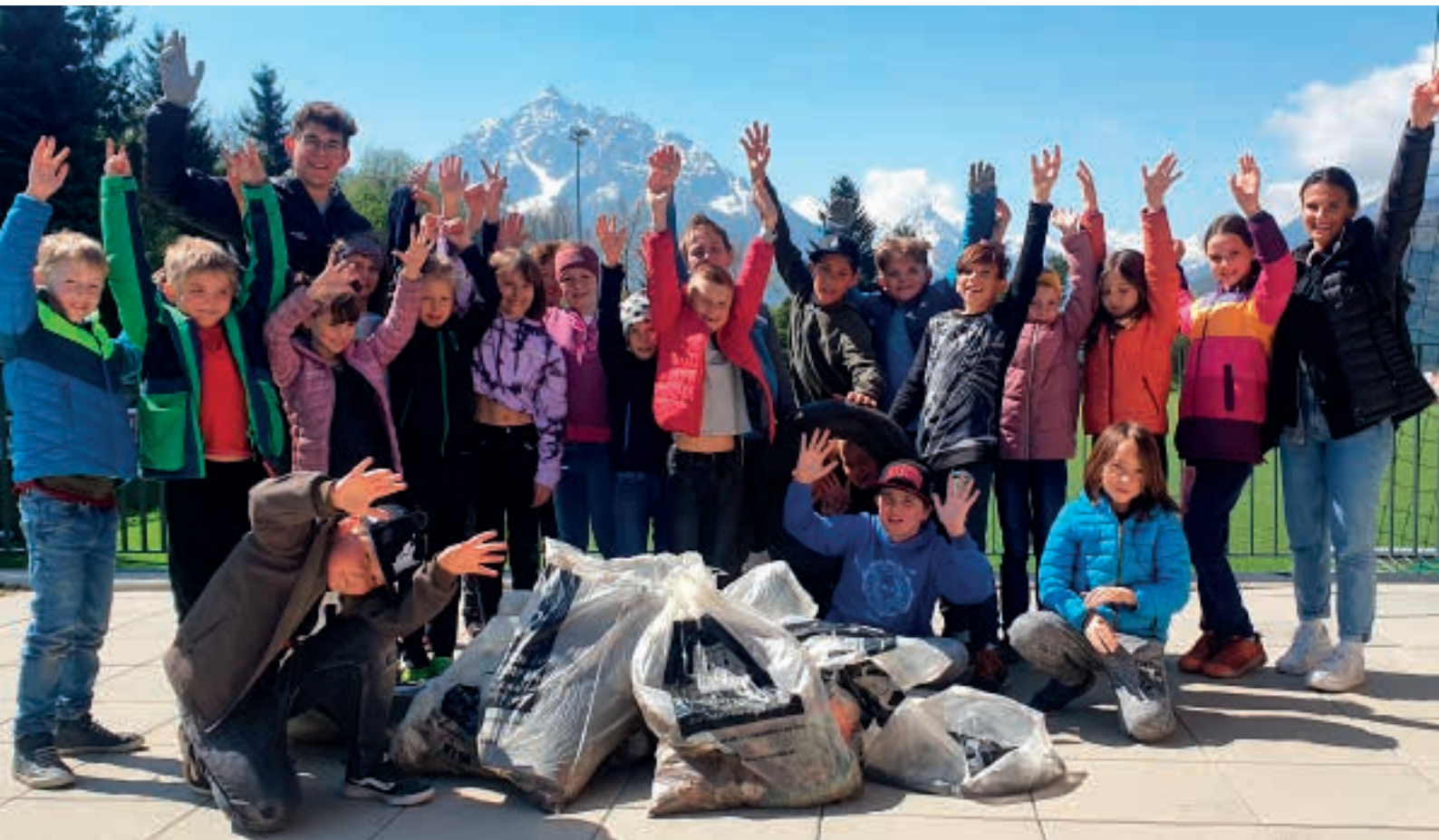
Die gute Tat für Natur und Umwelt machte sichtlich viel Spaß!