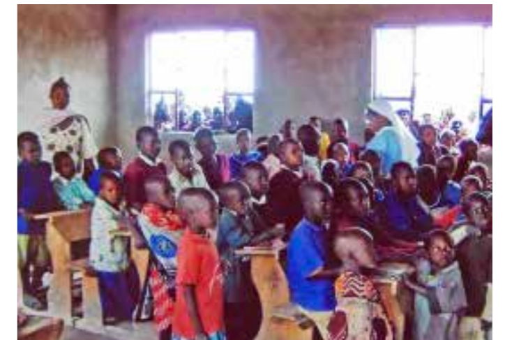
Eine Schulklasse in der Diözese Arusha.

Viele der Länder, in die Gelder fließen sind weit entfernt und unsere Spende in Anbetracht der weltweiten Not, nur Tropfen auf dem heißen Stein. Es freut und bestärkt uns aber jedes Mal, wenn wir E-Mails oder Post z.B. aus Tansania erhalten, die uns Einblick gewährt in die