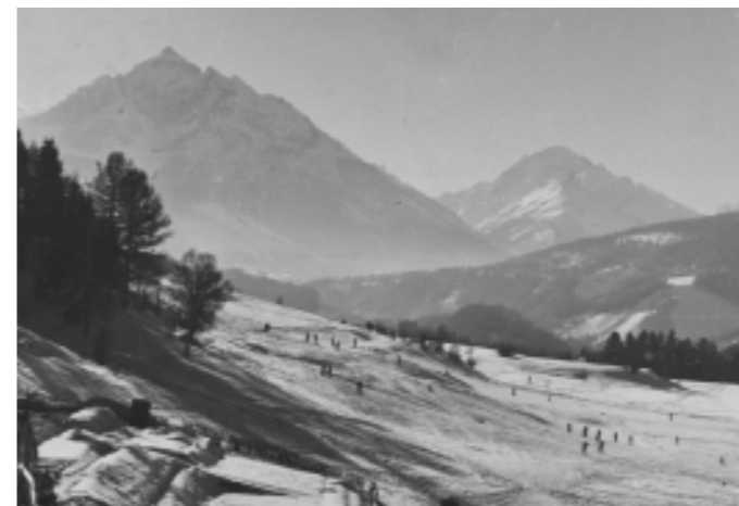
Übungswiese für Schifahrer am Ortsrand von Igls auf Patscherfeldern um 1920.

1. Die neue Heiligwasserstraße, die von Heiligwasser herab zur Römer- oder Salzstraße führt. Diese Straße wurde im Jahre 1912 eröffnet und bildet das erste Teilstück der geplanten Patscherkofelstraße. Die Strecke Heiligwasser – Römerstraße ist zirka 4000 m lang und hat ein durchwegs gleichmäßiges Gefälle von 14 Prozent. Die Straße bildet eine große Kehre und mehrere kleine Kurven, schlängelt sich durch herrlichen Hoch-