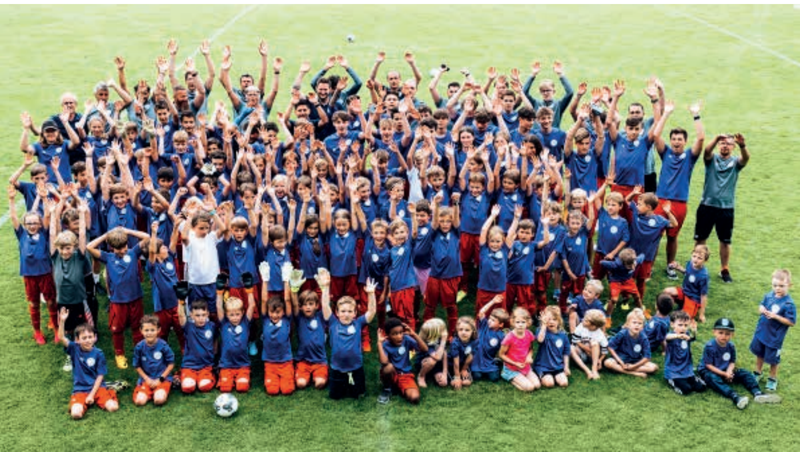
Ein erfolgreiches erstes Jahr...