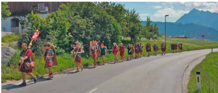
Der Asphalt der Römerstraße forderte seinen Tribut unter den Sandalen, welche zum Teil gegen Wanderschuhe getauscht werden mussten. Der Asphalt der Römerstraße forderte seinen Tribut unter den Sandalen, welche zum Teil gegen Wanderschuhe getauscht werden mussten.