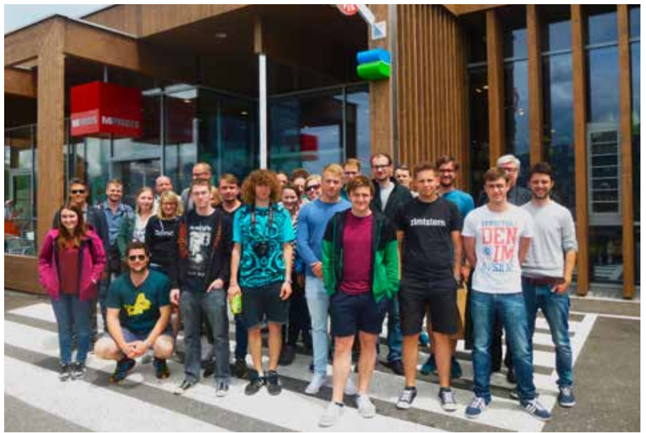
Die deutschen Bauingenieur-Studenten waren vom energieeffizienten MPREIS Passivhaus-Supermarkt in Patsch begeistert.

Von dieser Studienreise nehmen die zukünftigen Experten viel Detailwissen und Erfahrungswerte bestehender Passivhaus-Bauten mit.