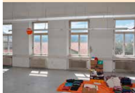
Großes Klassenzimmer vor dem Abbruch