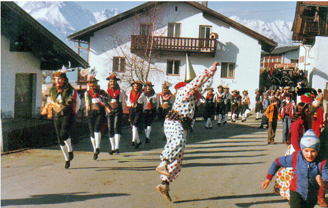
Unsinniger Donnerstag 1979: Schellenschlagen im Unterdorf

Impressum Herausgeber, Verleger und Eigentümer: Gemeinde Patsch, Dorfstraße 22 Redaktion: Oswald Wörle (Layout, Bilder), Gerhard Zimmer. Vereine: Hans Braunegger Kinder, Jugend, Bildung: Nina Redlich Allgemeines: Hannes Stöckholzer und Claudia Holz knecht Amtliches, Personelles (Gratulationen): Bgm. Andreas Danler Für den Inhalt verantwortlich: Bgm. Andreas Danler Namentlich gekennzeichnete Beiträge geben die Meinung der jeweiligen Autoren wieder und müssen sich nicht mit jener des Herausgebers decken.