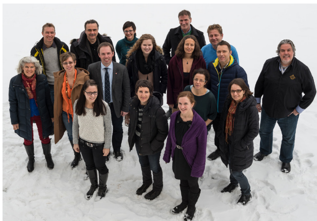
Im Bild: Lehrer/innen der Musikschule

Im Schuljahr 2013/14 begeht die LMS SÖM ihr 20-jähriges Bestandsjubiläum mit einer Reihe von Veranstaltungen. Im Zeichen des Jubiläums werden sowohl die traditionellen Schwerpunktkonzerte als auch zwei spezielle Jubiläumstermine stehen: Die erste dieser zwei großen Jubiläumsveranstaltungen ist ein Galakonzert , zu dem wir das Tiroler Landesjugendorchester eingeladen haben. Dieses Projekt des Tiroler Landesmusikschulwerkes existiert seit 10