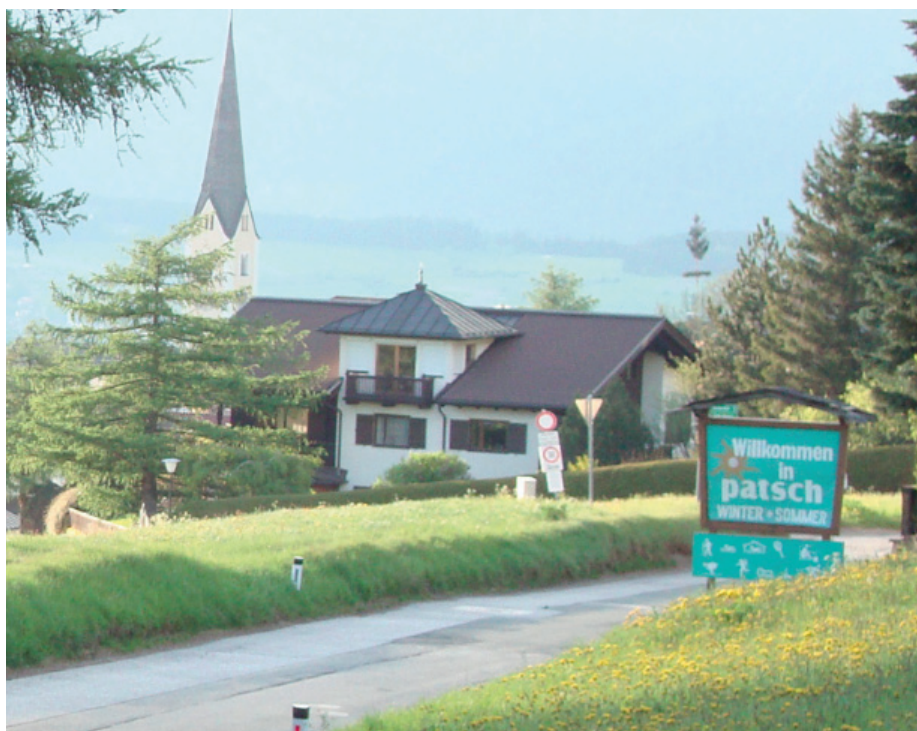
Foto: Patscher Ortstafel beim Zollerhof im Jahr 2010