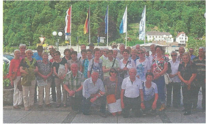
Danach ging die Fahrt weiter in die Drei-Flüsse-Stadt Passau mit Stadtbesichtigung.

Mit 48 Teilnehmern waren wir am 22. Mai auf einer Rundreise durch unser Nachbarland Bayern. Nach einem Weißwurstessen in Altötting, wurden die hl. Stätten des Wallfahrtsortes