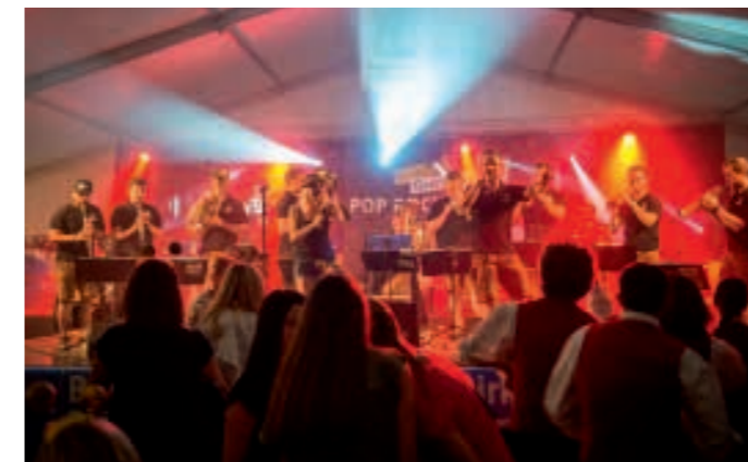
Partystimmung im Festzelt mit der Blaskapelle Gehörsturz