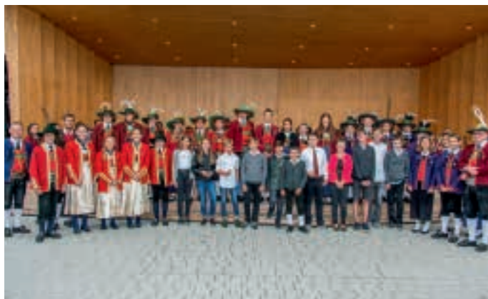
Die geehrten Jungmusikanten aus unserem Bezirk beim „Tag der Jugend“

Alle 15 Jahre trifft es eine Musikkapelle aus dem Musikbezirk Innsbruck Land, das Bezirksmusikfest auszurichten. Für uns war es nach 2003 heuer wieder soweit. Die Ausrichtung eines solchen Mega-Events ist für den Verein einmal eine große Ehre, aber vor allem eine riesen Herausforderung! Besonders heutzutage, wo man sich mit einem ständig wachsenden Aufwand durch einen Dschungel von Gesetzen, Regulierungen, Vorschriften, Sicherheitsmaßnahmen, usw. durchkämpfen muss, die natürlich auch mit steigenden Ausgaben verbunden sind.