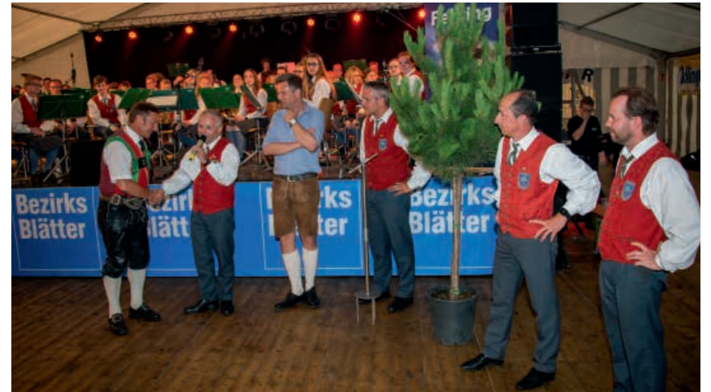
Übergabe des Gastgeschenks, einer Fehringer Föhre, die in der Nähe unseres neuen Probelokals gepflanzt wird und somit als Zeichen der Freundschaft und Verbundenheit der beiden Gemeinden stehen soll