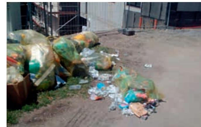
Gstail, linkes Bild: bereits am 16.6. wurden gelbe Säcke abgelagert - erst am 20.6. war die Abholung = bitte die Entsorgungszeiten laut Müllkalender beachten !

nur, wenn die dafür notwendigen Vorgaben eingehalten werden. Zwei Ereignisfälle aus jüngster Zeit möchte ich aufzeigen. Sie regen zum Nachdenken an, weil sie ohne Aufwand zu vermeiden gewesen wären: