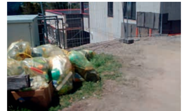
rechtes Bild: ein verantwortungsbewusster Bürger bereinigte das Ärgernis