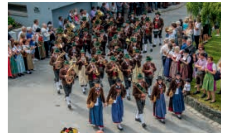
Die Musikkapelle Aldrans beim Festumzug durchs Dorf