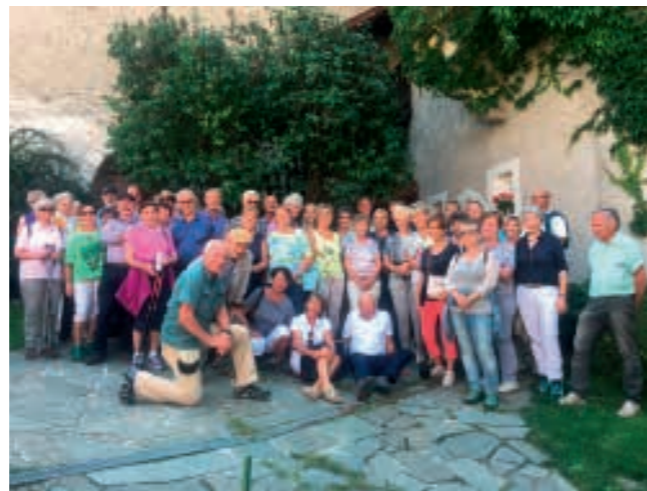
Foto im Burghof Reifenstein

Nach der Burgbesichtigung konnten wir bei herrlichem Wetter in Sterzing noch einen Stadtbummel unternehmen