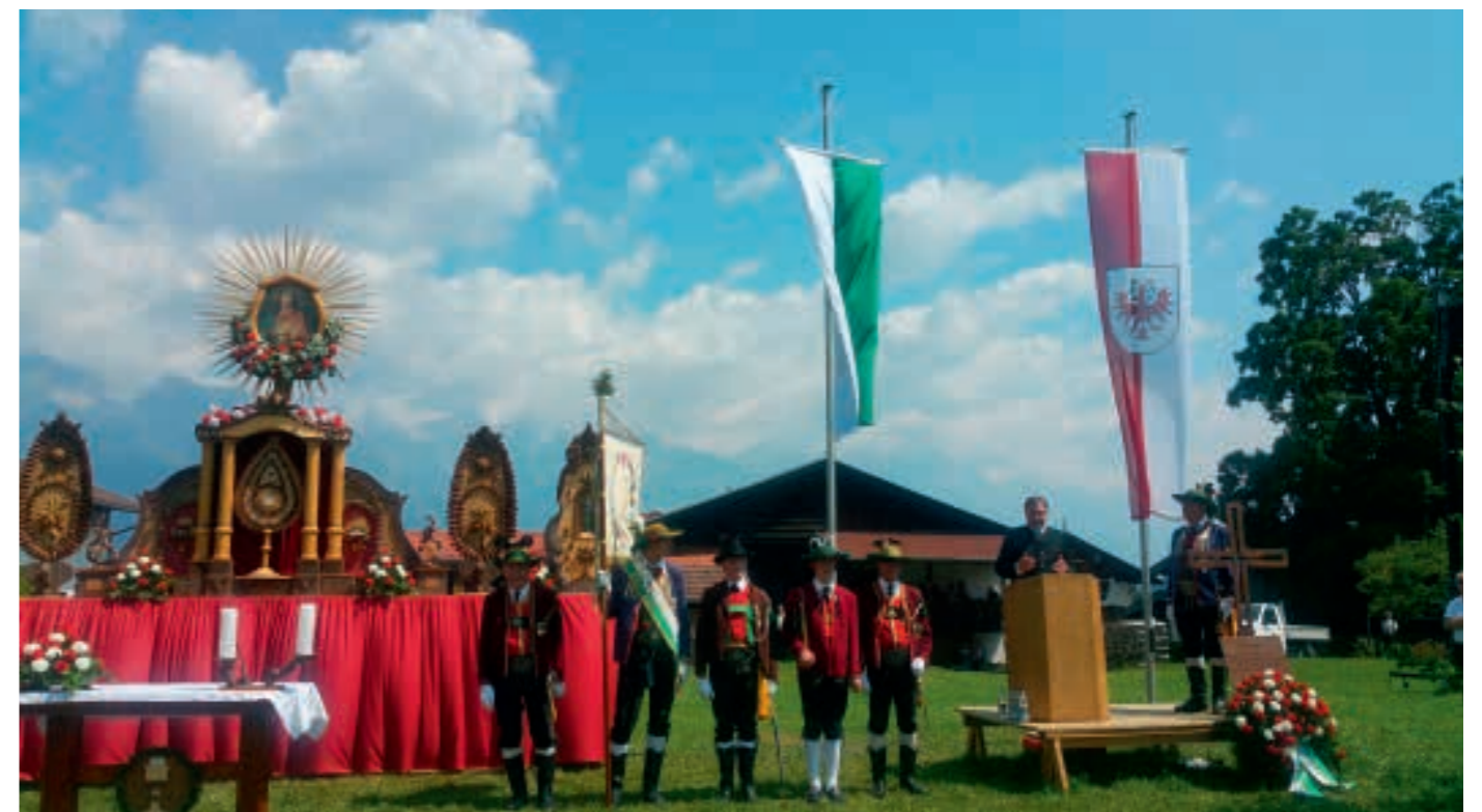
Günther Platter bei der Festrede am 1. Juli 2018 nach der Feldmesse in Mutters