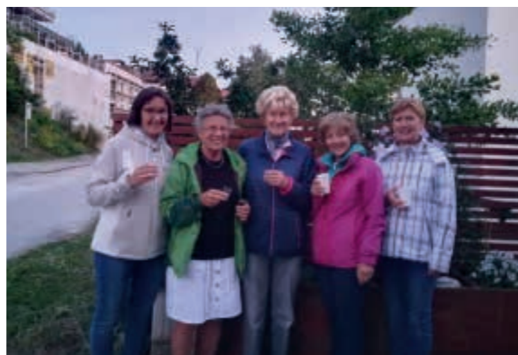
verabschiedet in den Familienverbandruhestand