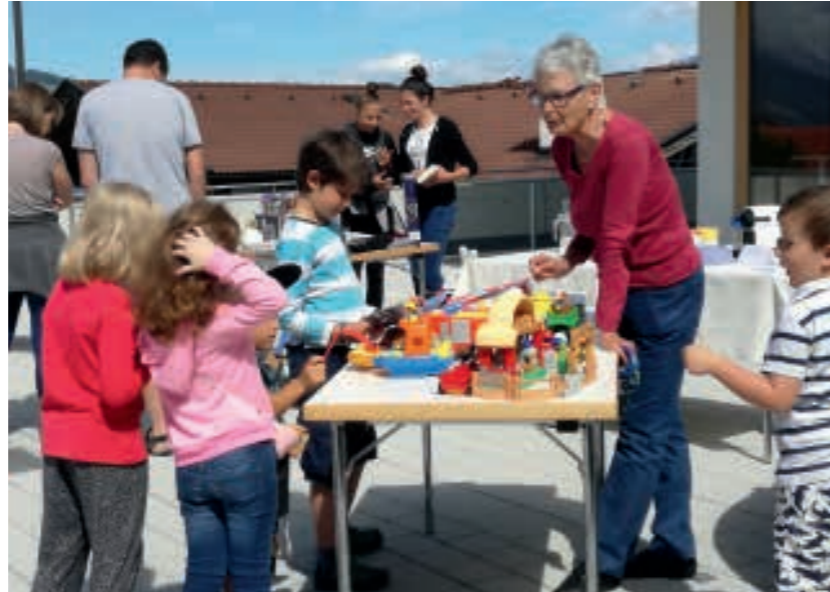
Die Qual der Wahl

Die Qual der Wahl hatten am 23. Juni vor allem die Kinder. Bei schönstem Wetter fand unter freiem Himmel, auf unserem neuen Dorfplatz, der 1. Patscher Kinderflohmarkt statt. Auf 16 Verkaufstischen boten Kinder, Eltern und Großeltern ihre Waren feil, Bücher, Cd's, Spiel- und Sport-sachen, Bekleidung und noch mehr. Es wurde gehandelt, verkauft, weiterverkauft oder auch getauscht. Es war ein fröhliches Treiben, bei dem die Kleinen ihre Geschäftstüchtigkeit ausprobieren konnten. Das gelang ihnen schon sehr gut, bei den Verkäufern hatte zum Schluss „keiner weniger aber dafür etwas anderes“ stellten die meisten fest. Altwaren werden nicht entsorgt, sondern wiederverwertet, das Hauptziel wurde somit erreicht. Da viele schon eifrig überlegen, was sie das nächste Mal verkaufen könnten oder umgekehrt gerne