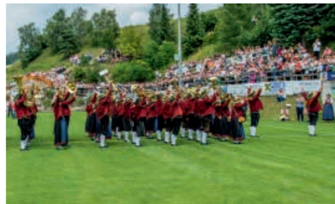
Die Musikkapelle Grinzens lies bei ihrer Rasenshow am Sportplatz die Stimmung zum Kochen bringen