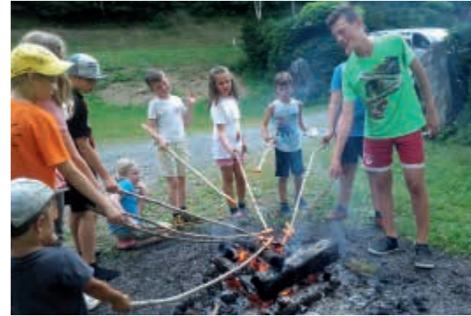
selbst gegrillt schmeckts doch am besten