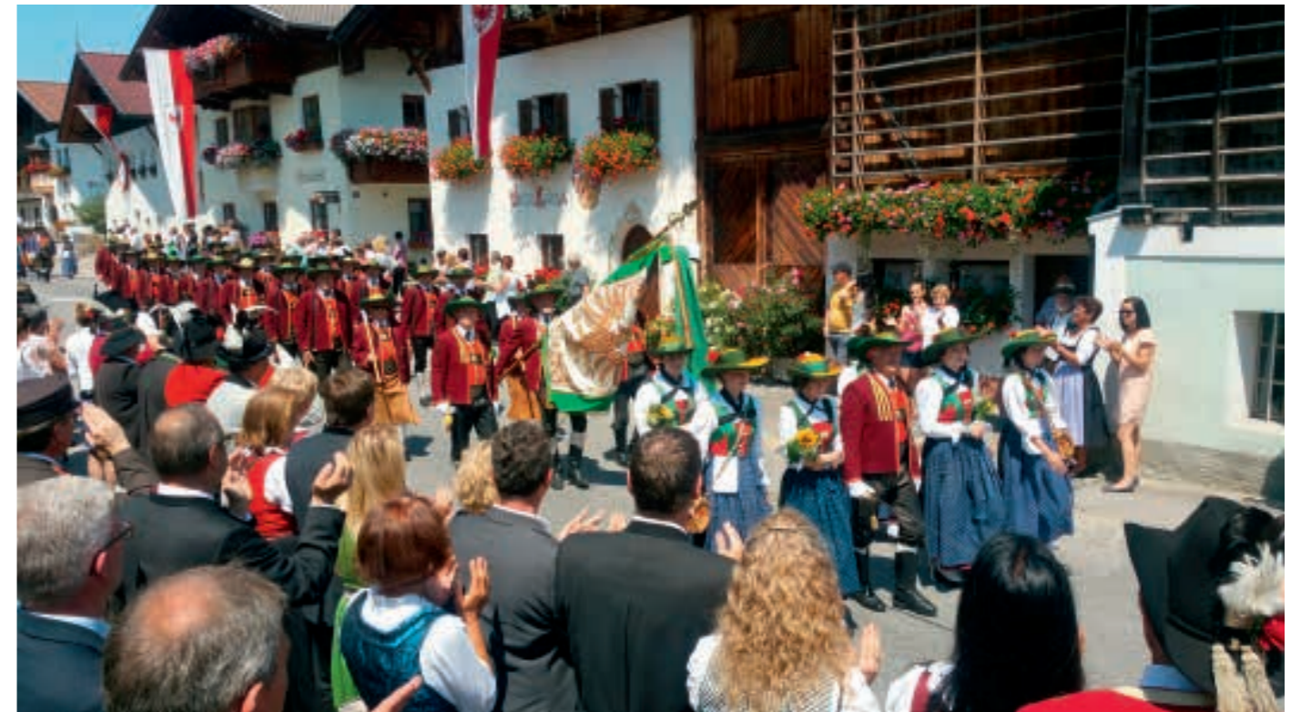
Defilierung der Patscher Kompanie vor prächtiger Kulisse der Mutterer Dorfstraße