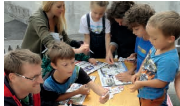
hier wird eifrig getauscht

erwerben möchten, werden wir diese Veranstaltung sicherlich wiederholen.