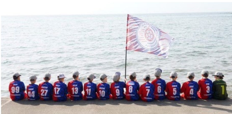
Nachwuchs FC Patscherkofel beim Istria Football Festival