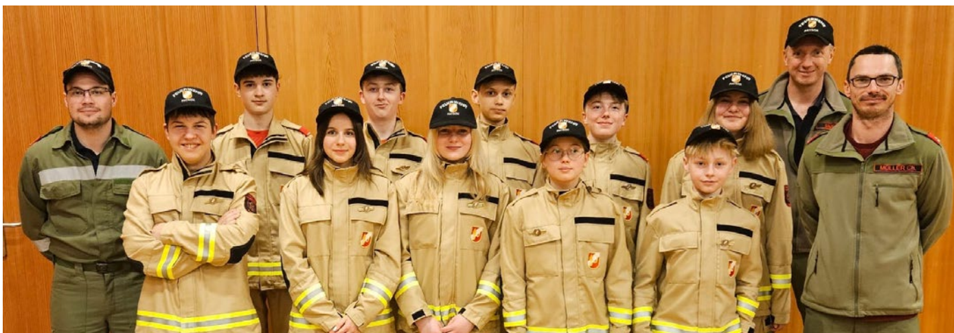
Die Jugendgruppe der FF-Patsch beim Wissenstest in Zirl