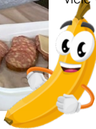
Der gesunde Jause-Tag ist immer ein Highlight!

Wir sind dankbar für die anhaltende Unterstützung und das Engagement aller Beteiligten und freuen uns auf viele weitere gesunde Jause-Tage an unserer Schule.