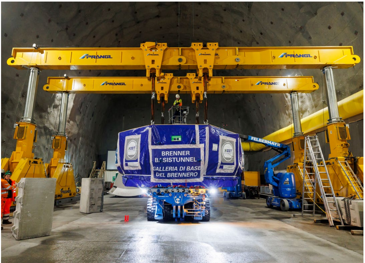
Transport Antrieb beim Baulos Pfons-Brenner, BBT SE