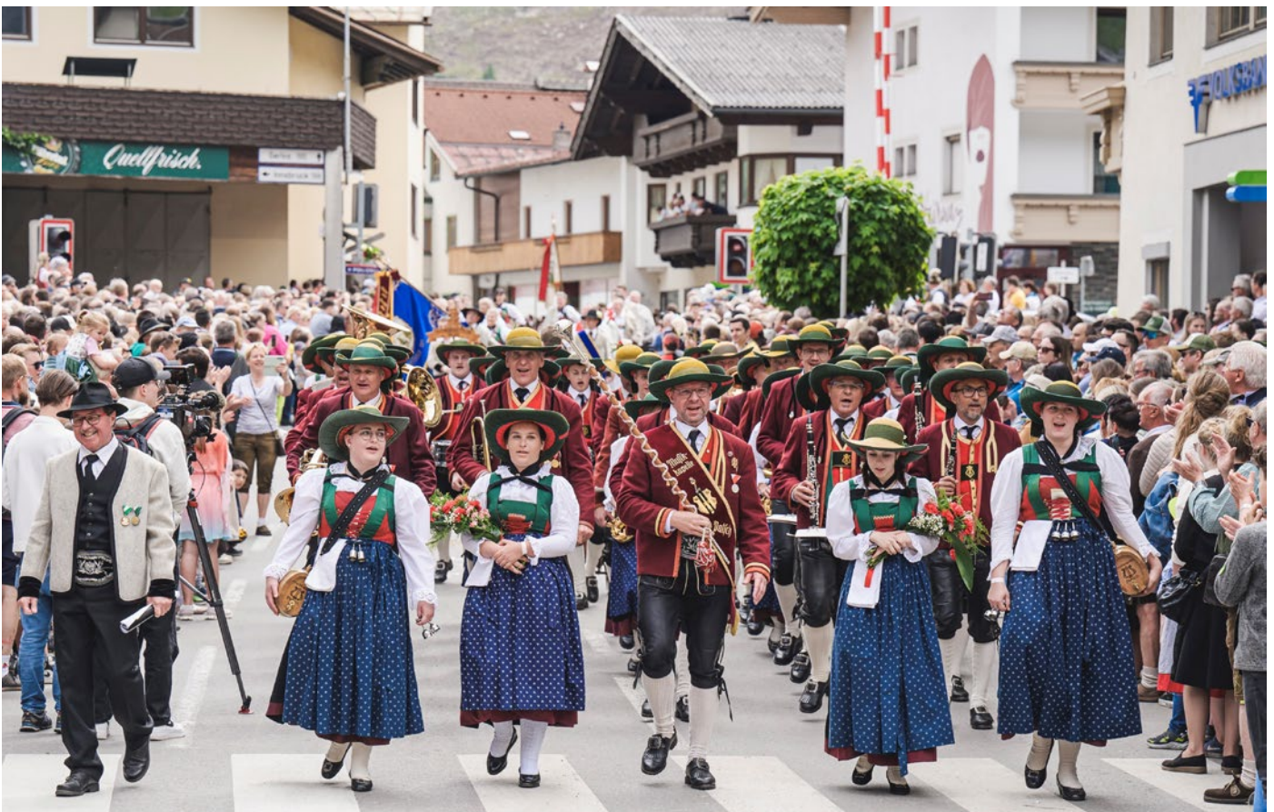
Festumzug beim Gauderfest in Zell am Ziller

Unser zweites Konzert-Highlight wird das Cäcilien-Konzert am 22. November sein.