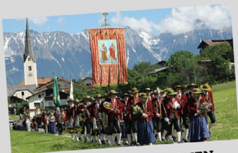
UNSERE 4 PROZESSIONEN

FRONLEICHNAM HERZ-JESU HL. DONATUS HOHER FRAUENTAG